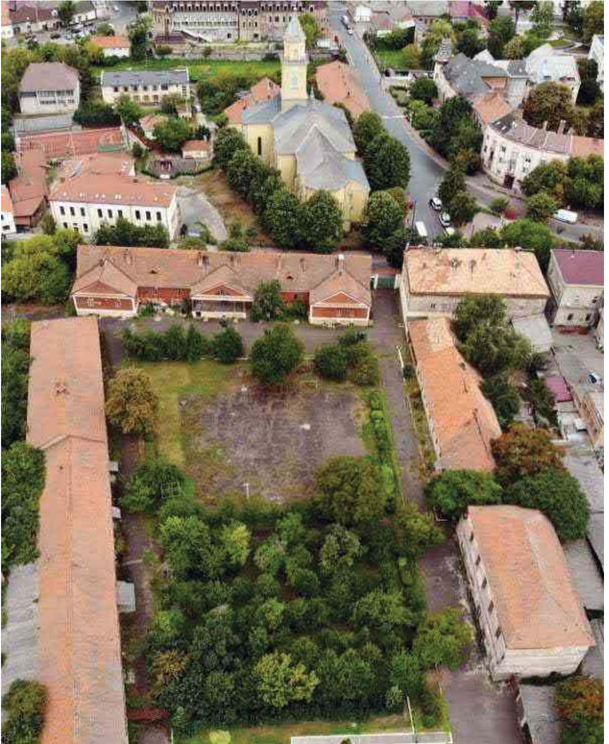
Рис. 1. Загальний вид на палац Бетлена–Ракоці і римо-католицьку церкву в Берегові (вид з сходу).