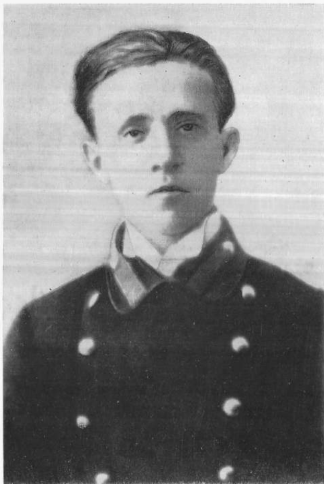
Василь Блакитний під час перебування в семінарії.