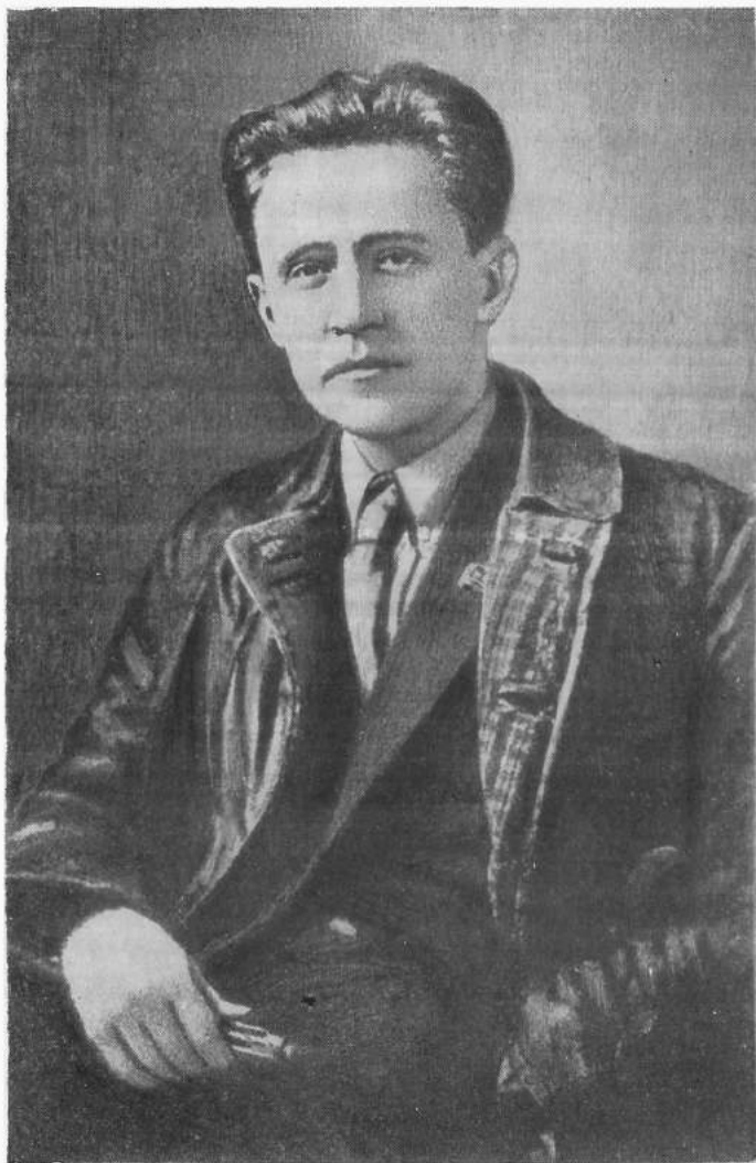
Василь Блакитний. Фото 1923 року.