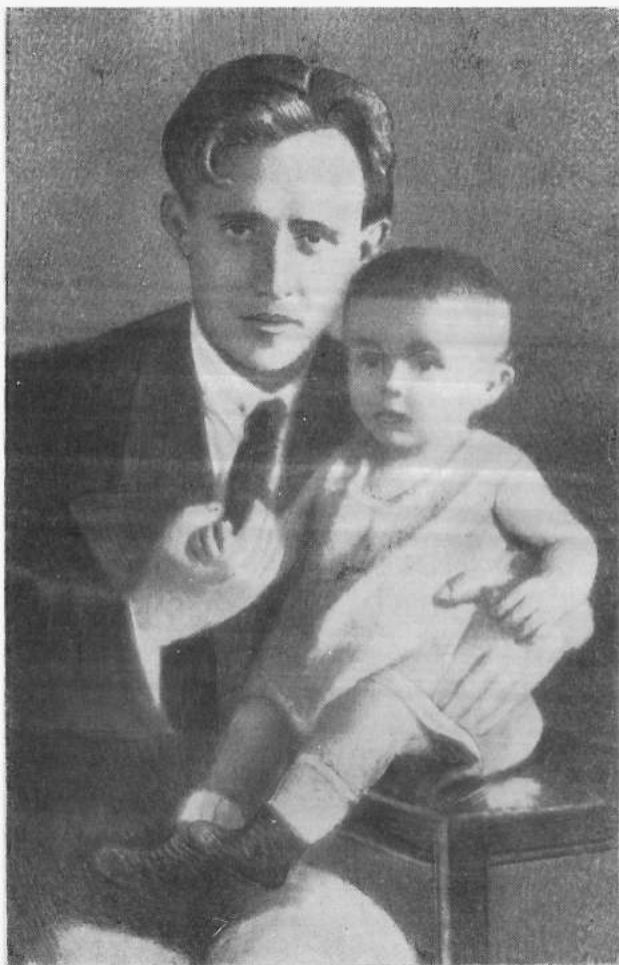
Василь Блакитний з донькою Майєю. Фото 1924 року.