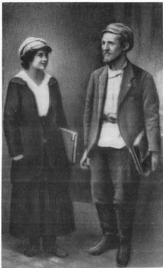
Василь Блакитний та Л. Є. Вовчик. Фото 1919 року.