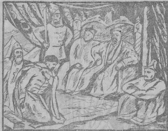
Князь із єпископом на поклоні у татарського хана.

Щоби «грецька віра» стала зрозумілішою, ближчою до давніх слов'ян, щоби ті краще приймали віру своїх князів—молитви, служба й уся учта перекладаються на слов'янську, старо-українську мову, пристосовуються до старих звичаїв. Бо було це все в інтересах грецьких купців, та українських князків, які з тими купцями торгували. Церква допомагала князкам та їх боярам держати «простий нарід» в покорі собі і збирати з нього данину й податки—основу їх багатства і влади. І запанувала християнська віра на просторах України, як і по сусідніх слов'янських землях.