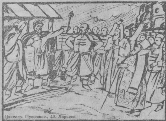
Цинкогр. Пушкінск., 40. Харьков.

Недовго проіснувала українська держава: намагалася знову собі підвернути Україну польська шляхта, змагалися за неї московські царі з боярами, зазіхали кримські хани. Селянство ж і робітництво українське не палали вже бажанням боронити владу своїх, рід-