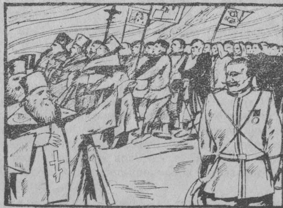
Дві підпори царату (церква й поліція).

Серед вірних знаходилися люде й групи, яким ясним ставала вся невідповідність поліцейської церкви словам про милосердя бога. Вони намагалися якось церковне життя виправити, виправити саму релігію. Так народжувалися так звані «секти» та «ересі»—групи евангелістів, баптистів, мальованців то-що. Але