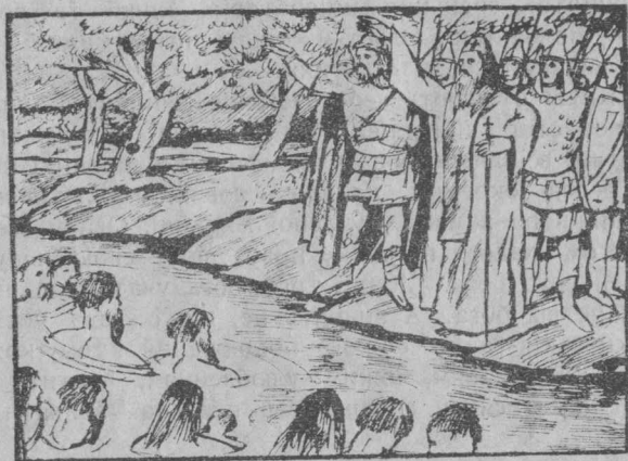
Приєднання слов'ян до християнської віри.

Темна й несвідома людина створила собі релігію, віру в бога. А остання стала могутнім знаряддям її поневолення. З допомогою релігії гнобителі й визискувачі примусили працювати на себе пригноблених, завели лад насильства й привчили працівників дивитися на цей лад, як на одвічний і довічний, освячений богом, який за всі муки, всю працю на землі віддячить шасливим життям після смерти.