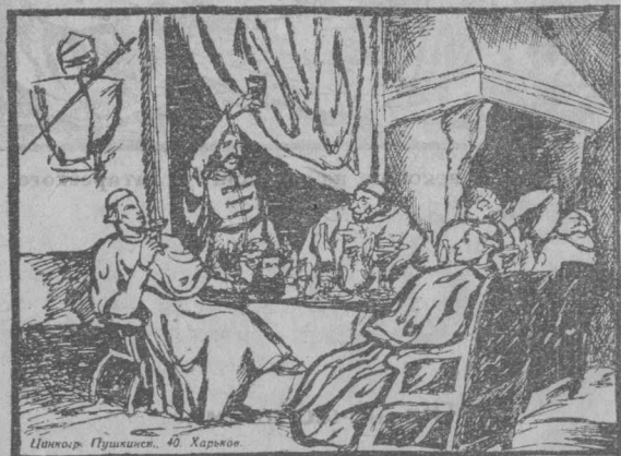
Польська шляхта й католицьке духівництво на дозвіллі.

Після татар, по перерві, Україну було підбито під владу польської шляхти, поміщиків—магнатів.