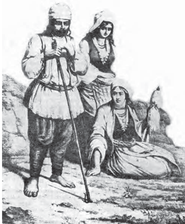
Болгари Бессарабії. 1837 р.

Чимало болгар під час колонізації переїхало до бессарабських міст. Як зазначав А.О. Скальковський, у 1819 р. кожний четвертий житель Кишинєва був болгариним [25, с. 19]. Вони зайняли частину міста, що називалася «Булгарією». В 1819 р. в Ізмаїлі проживало 404 болгарські сім'ї, в Рені – 194, в Акермані – 70, у Кілії – 18 [18, с. 20]. Після Указу 1819 р. за розпорядженням І.М. Інзова задунайським поселенцям, що проживали в містах, були надані земельні наділи під улаштування колоній. У результаті з 1820 р. розпочалося їхнє переселення з міст у нові села. Так, велика група болгар з Ізмаїла на чолі зі стариком Бано утворила в 1821 р. с. Баннівку (Болградський район). У 1822 р. кишинівські болгари (244 сім'ї) заснували с. Задунаївку (Арцизький район), а група болгар з Акермана поселилася в колишньому татарському селі Ескі-Кубей, яке на честь І.М. Інзова назвали Іванівкою (с. Нова Іванівка Арцизького району).