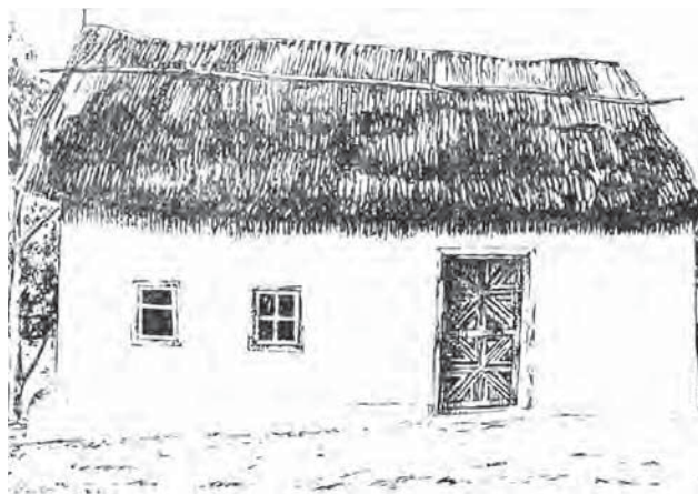
Будинок болгарина-переселенця XIX ст.

Початок болгарської колонізації до Бессарабії був пов'язаний з російсько-турецькими війнами 1768–1774 та 1787–1791 рр., під час яких на боці Росії в добровільних військових формуваннях брали участь болгары. Після завершення цих війн частина добровольців залишилася на території Бессарабії. Зокрема, після війни 1768–1774 рр. на півдні Бессарабії, переважно в містах, поселилося близько 2 тис. болгар та гагаузів [8, с. 67]. У цей період на землях, що були зайняті російськими військами, з'являлося багато болгарських купців, ремісників та селян, які селилися в містах