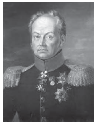
Портрет І.М. Інзова

Будинок Інзова в Кишиневі