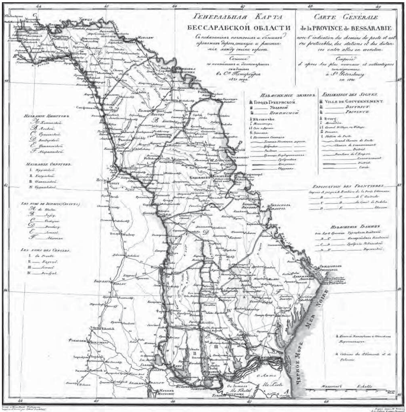
Карта Бессарабської області 1821 р.