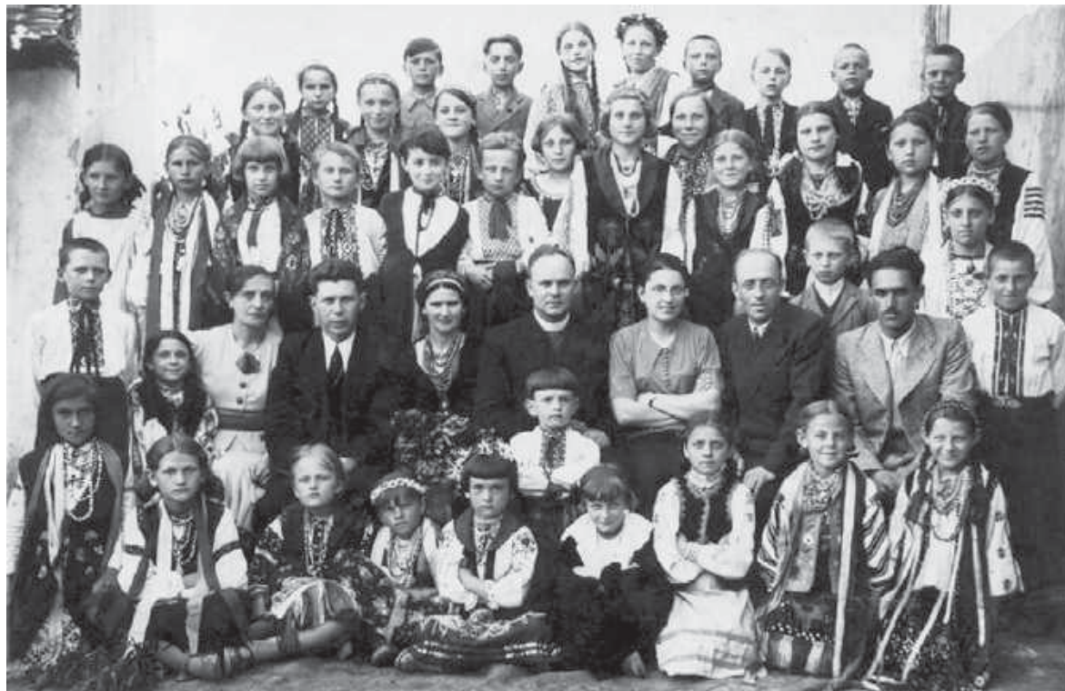
1. Учасники свята «Поклін матері», влаштованого товариством «Рідна школа». м. Березани (нині – Тернопільської обл.). 4–5 червня 1938 р.