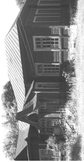
згорі: корпус Кінашівської школи, яка побудована на кошти М.М. Кочубея. Фото 2011 р. ( ліворуч ); будинок М.М. Кочубея в с. Кінашівка. Фото початку ХХ ст. ( праворуч ) унизу: будинок Кочубеїв у с. Дубовичі. Фото 1898 р. (з книги В. Гурби "Дубовичі історико-красназничий нарис") ( ліворуч ); будинок Кочубеїв у с. Дубовичі. Фото 2012 р. ( праворуч )