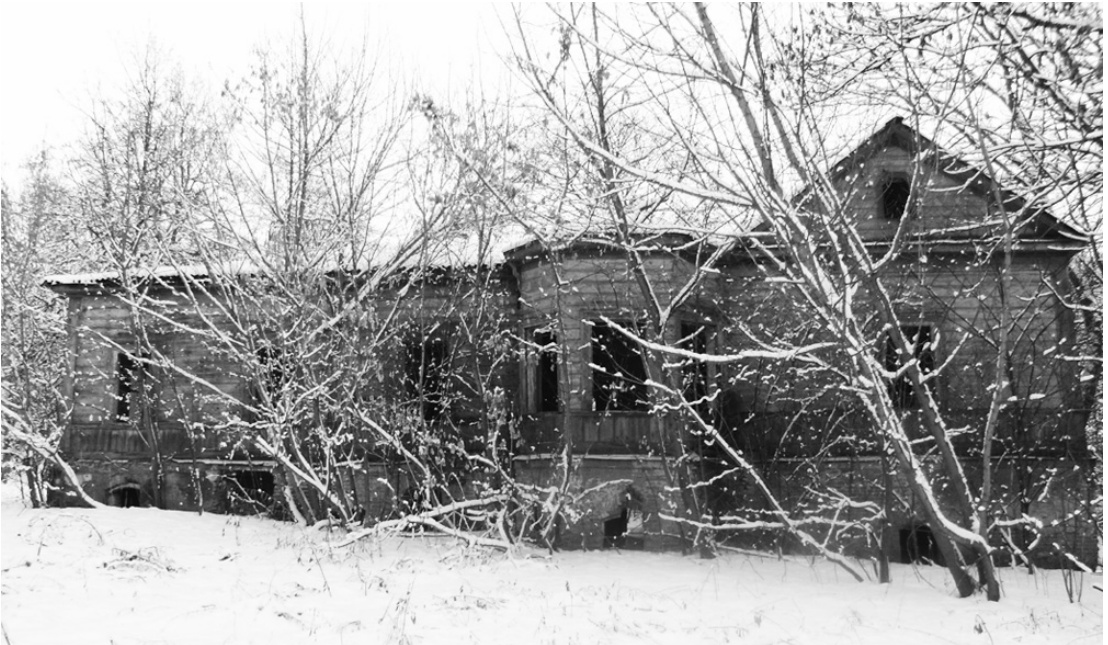
Будинок Кочубеїв у с. Ярославць. Фото 2012 р.

У цілому, варто зазначити, що маєтки генерального судді В.Л. Кочубея та його нащадків – це невід’ємна частина історії Чернігово-Сіверського краю. Кочубеї внесли великий вклад у розвиток та розбудову садиб, парків, церков. Деякі з цих пам’яток уціліли до сьогодні, але з огляду на їх стан – здебільшого потребують негайної й невідкладної реставрації чи відновлення.