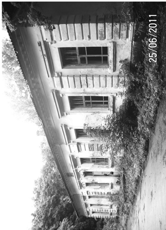
угорі: будинок Кочубеїв у м. Батурин. Фото 1911 р. (ліворуч); Будинок-музей Генерального судді В. Кочубея в м. Батурин. Фото 2010 р. (праворуч) унизу: будинок Кочубеїв у с. Тиниця. Фото 2011 р. (ліворуч); скарбниця Кочубеїв у с. Тиниця. Фото 2011 р. (праворуч)