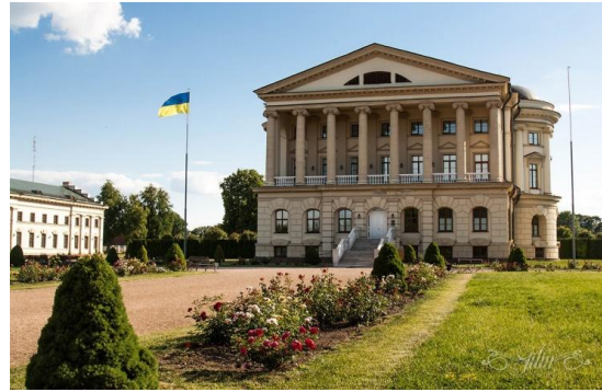
Рис. 4. Палац гетьмана Кирила Розумовського в Батурині, архітектор Чарлз Камерон, 1799-1803 рр. 19.05.2019 р. в палаці гетьмана урочисто відкрита виставка «Григорій Орлик: видатний син видатного батька України. Повернення на Батьківщину».