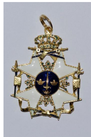
Рис. 2. Наукова реконструкція ордену Меча, 2020 р. З фондової колекції Національного заповідника «Гетьманська столиця».