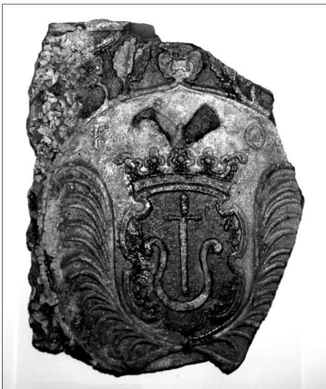
Рис. 2. Кахля з будинку Пилипа Орлика в Батурині, XVIII ст. на її меншій сестрі Варварі.

Старший син Анастасії, Карл Густав, служив офіцером у полку «Руаяль-Полонь», який був створений у 1747 р. Г. Орликом у Франції та разом з рідним дядьком переймався питаннями «козацької нації». Про його особисте життя згадок не віднайдено.