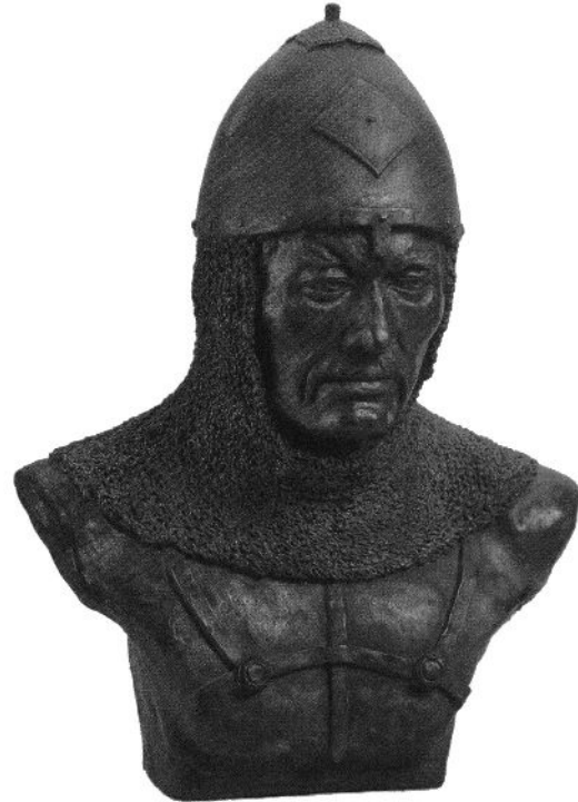
Рис. 58. Антропологічна реконструкція погруддя половця із Квашніково.

злегка набрякла складка верхньої повіки) ознак. Такий метисний антропологічний тип був притаманний для багатьох народів Південного Сибіру і Алтаю (Касаткин 2007, с. 86).