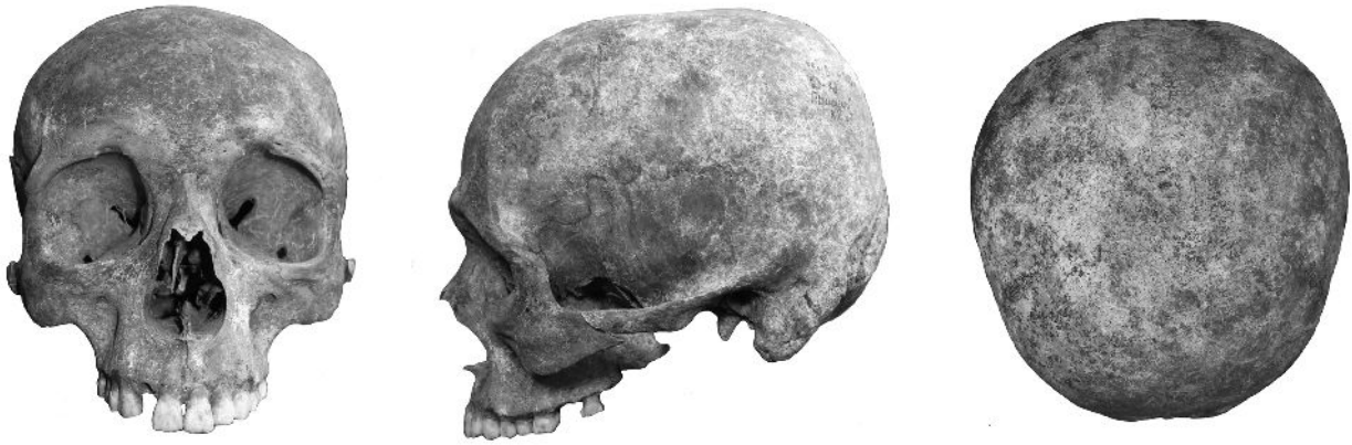
Рис. 59. Череп чоловіка 55-65 рр. з пох. 7, кургану 2 у с. Пришиб.

Подібні результати були отримані Е.А. Шепель і за даними краніометрії. Дослідницею наголошувалось про дисперсне розповсюдження монголоїдних і європеїдних ознак в досліджуваній групі, які свідчать про стадію біологічного змішання.