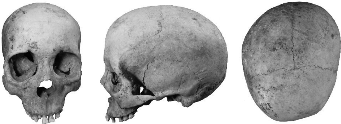
Рис. 60. Череп жінки 30-40 рр., з пох. 7, кургану 1 у с. Пришиб.