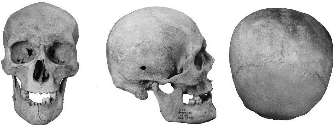
Рис. 61. Череп чоловіка 40-50 рр., з пох. 6, кургану 2 у с. Знам'янка.