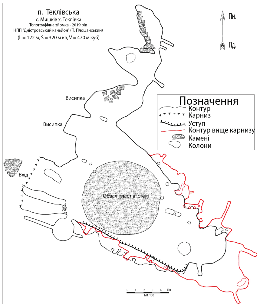
Рис. 1. План печери Теклівська неподалік с. Мишків.

Середня ширина проходів печери Теклівська має 3,2 м, а середня висота – 1,6 м.