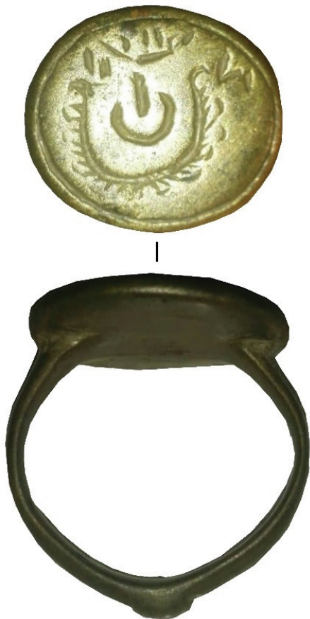
Фото 1. Перстень зі щитком ранньомодерного часу з смт Золотий Потік біля Бучача.

виготовлені вони зі сплавів кольорових металів (міді, цинку, латуні, бронзи, білону), рідше – зі срібла чи золота. На відміну від аналогічних ювелірних виробів, походження котрих сягає ще давньоруського часу, про ці знахідки досі не має окремих публікацій.