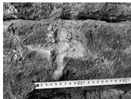
Рис. 4. Грецький рівнораменний хрест справа від входу до печери «Романтична».

Лише тепер можемо констатувати, що печеру Романтична використовував монах-самітник як окремих скит, який був пов'язаний із культом святого Онуфрія. Цей культ набув особливого поширення на території Середньої і Верхньої Наддністрянщини та Галичини в ХVI–ХVII ст. і пов'язаний із християнською релігійно-містичною течією