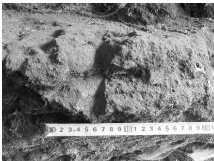
Рис.3. Грецький рівнораменний хрест зліва від входу до печери «Романтична».

Печера Романтична /рис. 2/, вхід якої розташований за 25 м на південний схід від попередньої (її координати: 25°48'23,84" східної довготи та 48°40'52,27" північної широти). Печера горизонтальна, ерозійно-гравітаційна, сформована в товщі альбських вапняків світло-сірого кольору. Відкладами (наповнювачами) є суглинки, піски, дрібні уламки породи. Печера зручна для проживання. Біля її входу розташований подовгастий (проходить вздовж скель) та широкий (близько 2 м) майданчик. На стелі простежено густу кіптяву, на дні помітні сліди згарища: деревне вугілля, перепалені уламки каміння, дрібні куски глини світло-червоного, чорного, темно-коричневого кольору. Під час обстеження печери знайдено кілька фрагментів ліпної (точне датування неможливо визначити) та гончарної (ХVI–ХVII ст.) кераміки [2, с. 209-210; 4, с. 238]. З обох сторін прямокутного входу, який має розміри 1,3 x 1,3 м, у скельній породі висічено два рівнораменні грецькі хрести з незначним розширенням на кінцях /рис. 3; 4/.