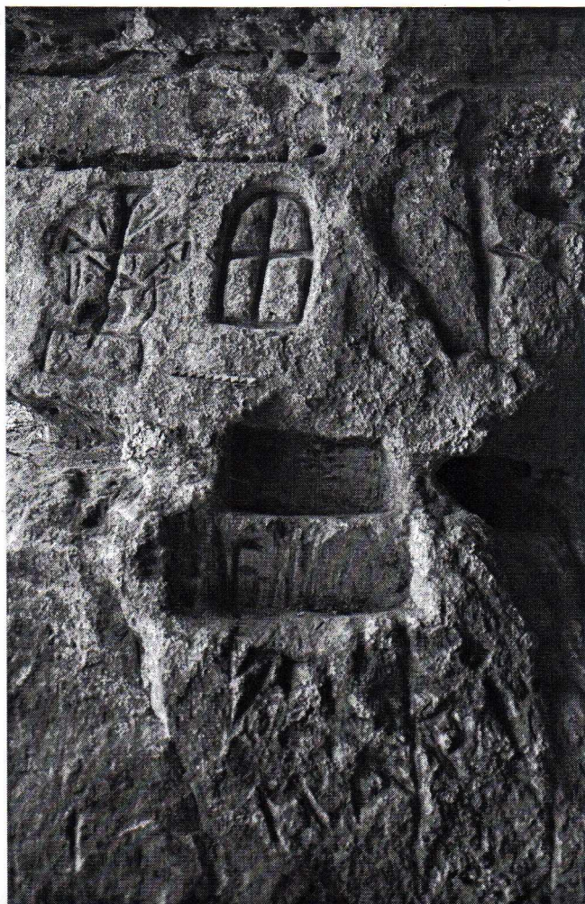
Фото 2. Зображення рунічних та християнських символів (північна ділянка печери «Легенда» с. Угринь)

Ледь далі знаходиться руна Кеназ («Факел», фонетичне звучання «к», «д», «ng»), що відносяться до молодших скандинавських рун (IX-XI) Вона – руна таланту. Під нею висічена руна Дагас («день», фонетичний звук «d») – відображає гармонійні зміни. За ними зображено очевидно руна Алгіз («лось», фонетичний звук «г» («z»)) – вона є символом захисту від злих сил. Можливо, що це руна Кеназ («Факел», фонетичне звучання «к», «g», «ng»), яка відноситься до молодших скандинавських рун (IX-XI). За магічним символом це руна таланту (фото 3).