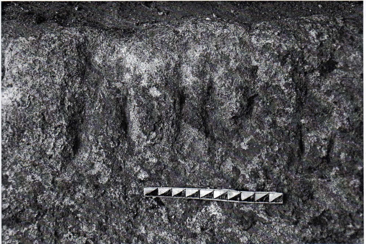
Фото 1. Рунічний напис біля північного входу до печери «Легенда» в с. Угринь.

Зовсім несподіване відкриття зроблене лише нещодавно. Ретельно досліджуючи цей грот, автору вдалося виявити у ньому давньогермацькі рунічні написи. Так, при вході до печери виявлено напис трьох рун (фото 1). Перша Еваз (у транскрипції означає латинський звук «е»), друга Хаггал («х»), а наступна – Вуньйо («w»). У поєднанні цих рун читається «ehw», що з давньогерманської ехва або ахва означає «річка» [12, с. 81]. Окремі рунічні знаки виявлені в печері. Так, біля зображеного грецького хреста та символічних двеврей входження до раю є вибита руна Науд (перекладається як «нужда», у транскрипції означає звук «n»). У ритуально-магічному значенні вона символізувала примушування та вирішення проблем.