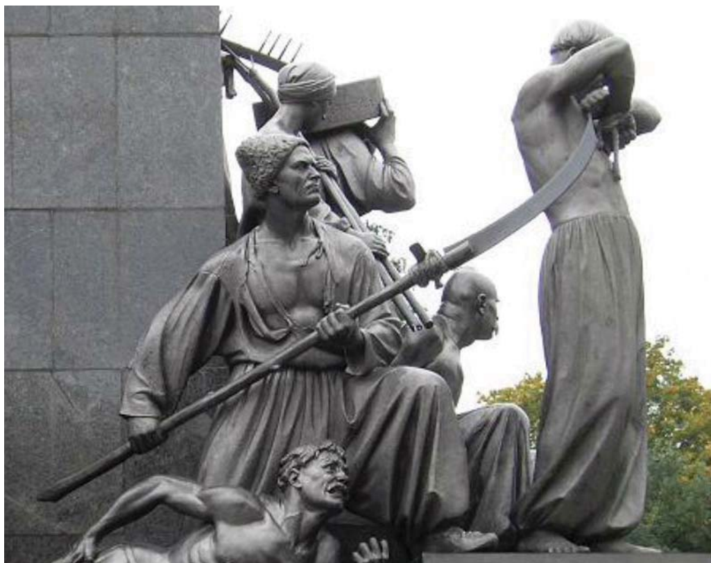
Рис. 1. Фигура гайдамака с боевой косой в скульптурной композиции памятника Т. Г. Шевченку (авторы: М. Г. Манизер и И. Г. Лангбард), г. Харьков.

су, которой отбивал всех, кто хотел его схватить, какой-то солдат напал на него с таким же оружием, но не мог ничего поделывать и, несмотря на свою бойкость, едва избежал, чтобы тот не перерезал его пополам. Тогда какой-то шляхтич ... и какой-то немецкий солдат... бросились в воду по шею и начали бой, казак, хоть и был пробит четырнадцатью пулями, встретил их еще с большим упорством, что очень удивило польское войско и даже его королевское величество, в присутствии которого заканчивался этот бой. Король очень увлекся храбростью этого человека и приказал крикнуть, что дарует ему жизнь, когда он покажется, на это последний гордо