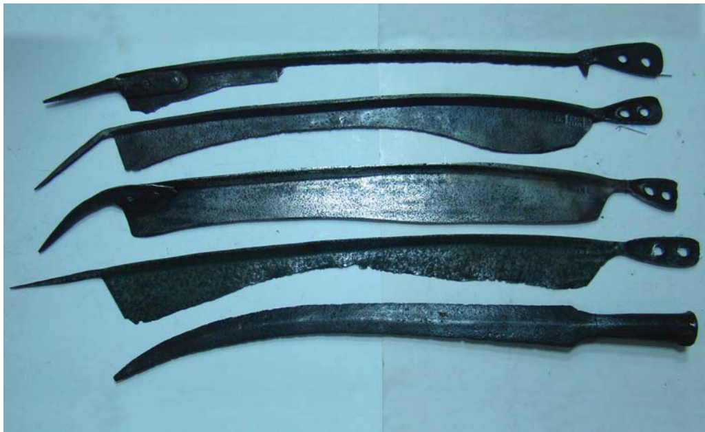
Рис. 4. Бойові коси в колекції Музея історії зброї, м. Запоріжжя (фото автора).

в верхней части и имеющим черен с двумя сквозными отверстиями и приклепанный граненый шип (Кп 1546, Кп 1436).