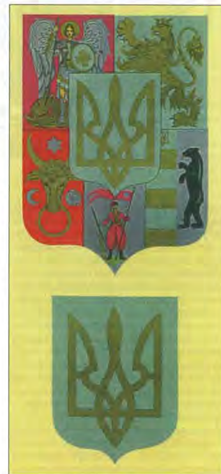
Середній і малий державні герби України за М.Битинським. 1930-ті рр.

Великий і малий герби 1918 р. стали першим втіленням ідеї дуалізму українського державного герба, яка згодом набула свого розвитку. Так, наприкінці 30-х рр. ХХ ст. відомий український геральдист М.Битинський на замовлення Уряду УНР в екзилі розробив проект державних відзнак України, серед них великого, середнього й малого державних гербів. Лейтмотивом цієї праці – справжнього шедевра українського геральдичного мистецтва – стала соборність українських земель, що на час створення