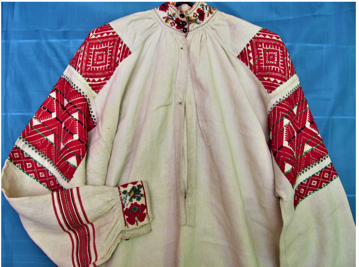
Рис. 5, 6