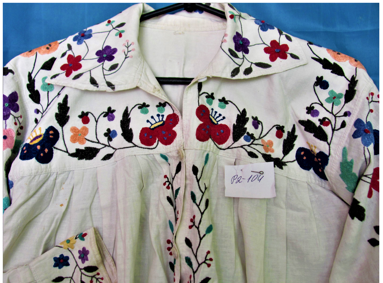
Рис. 3, 4