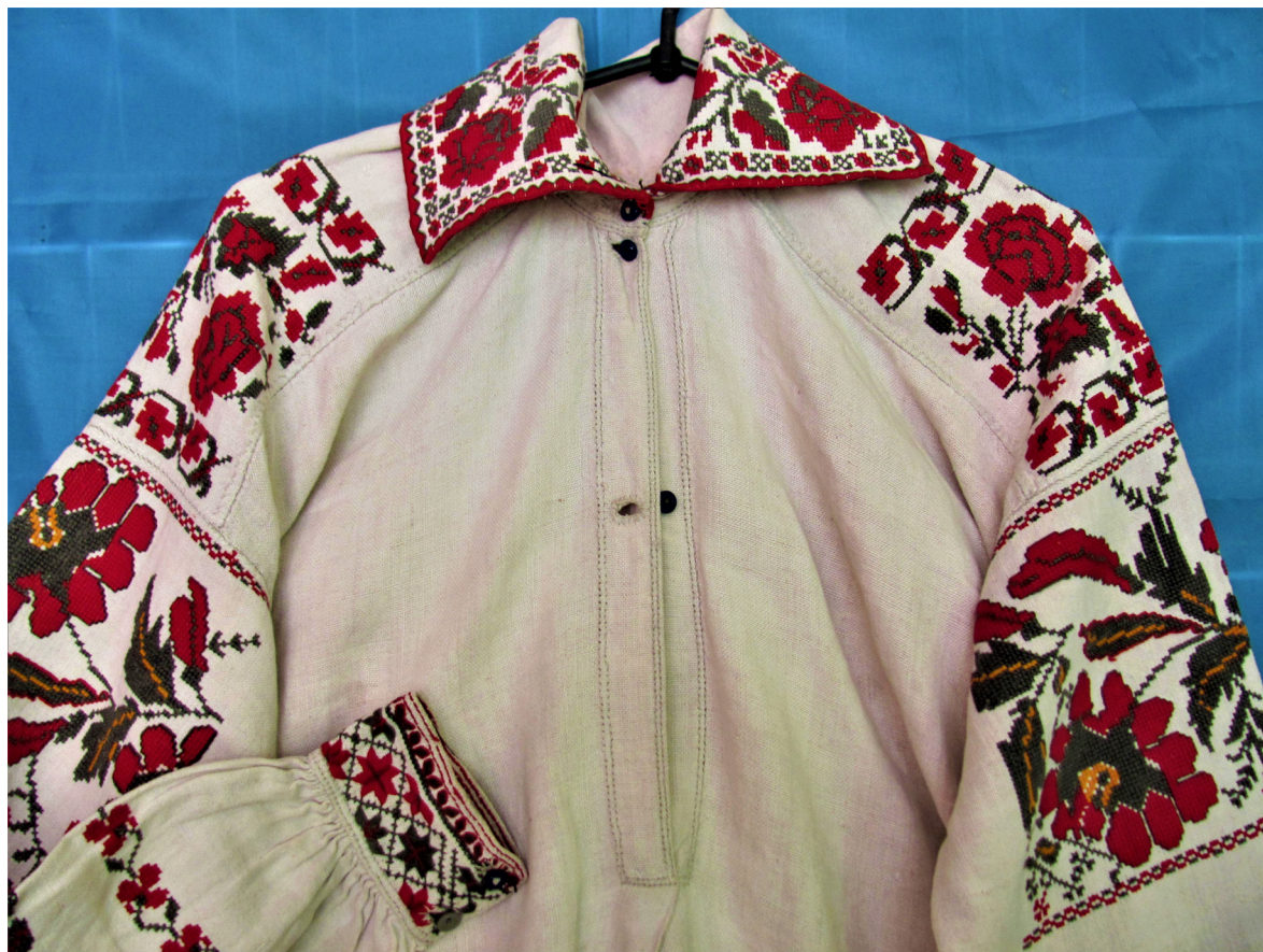
Рис. 9, 10