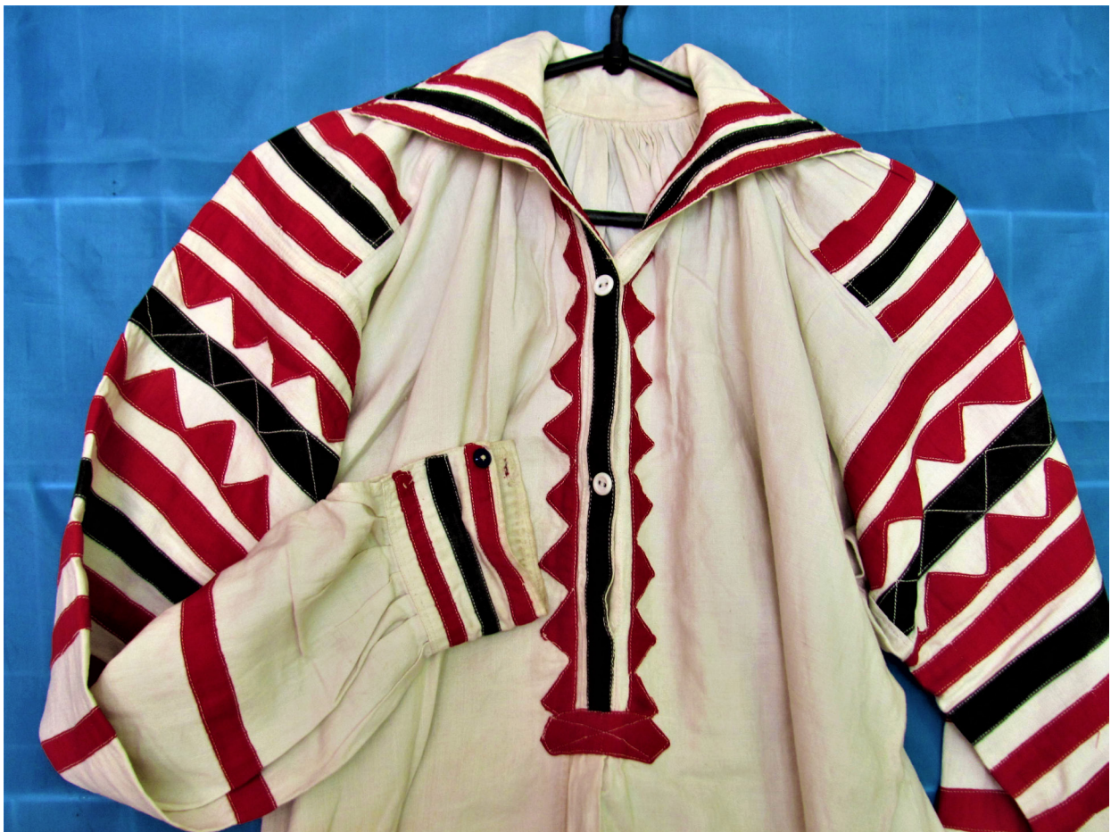
Рис. 7, 8