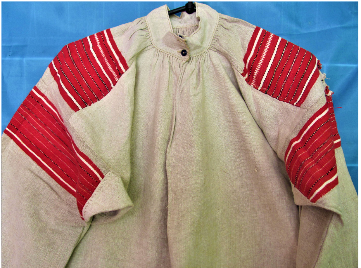
Рис. 1, 2