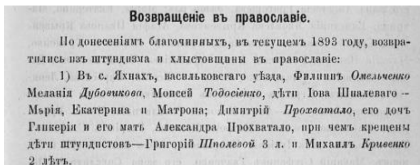
Список жителів с. Яхни, які повернулись у православ'я (КСВ № 10 за 1893 р., с. 125)