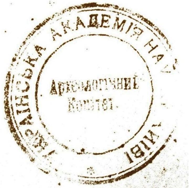
Рис. 13, 17, 18, 19