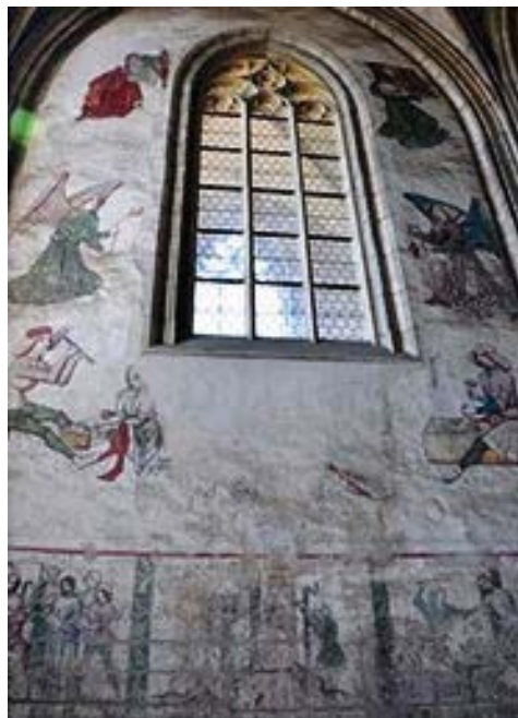
Рис. 39, 40, 41-1, 41-2