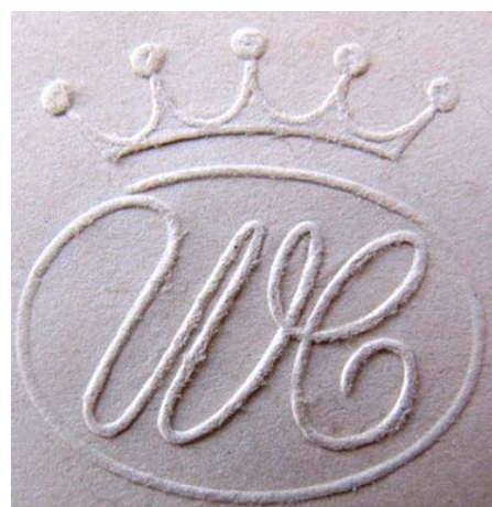
Рис. 35, 36, 37, 38-1, 38-2