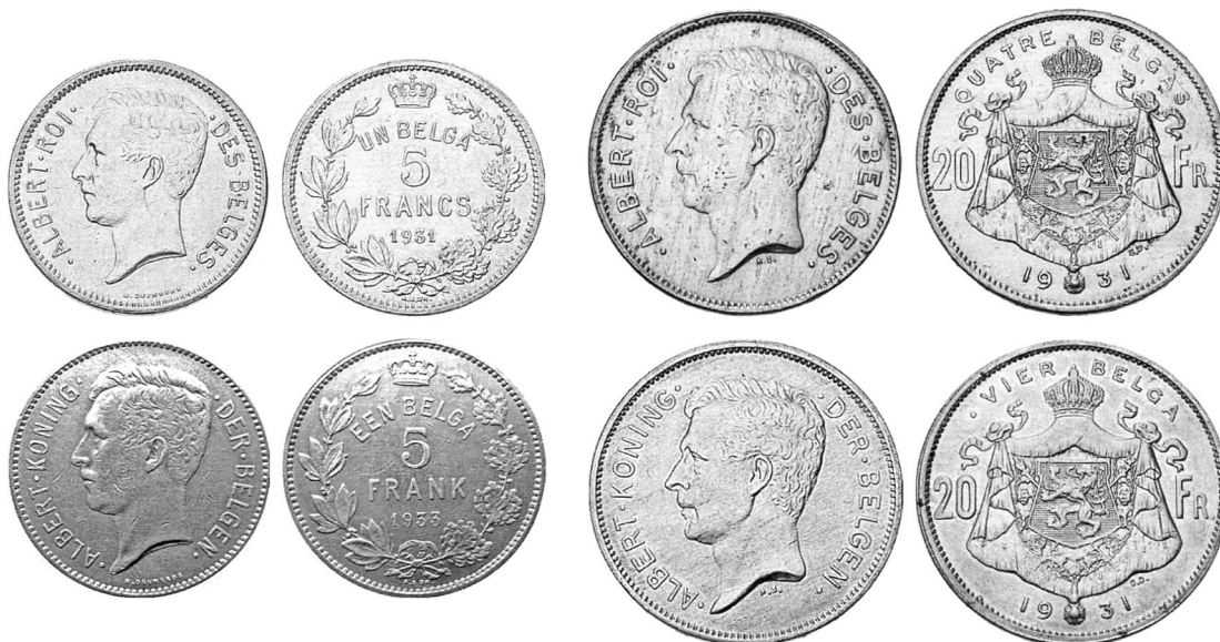
Монети подвійного номіналу — у бельгах та франках.