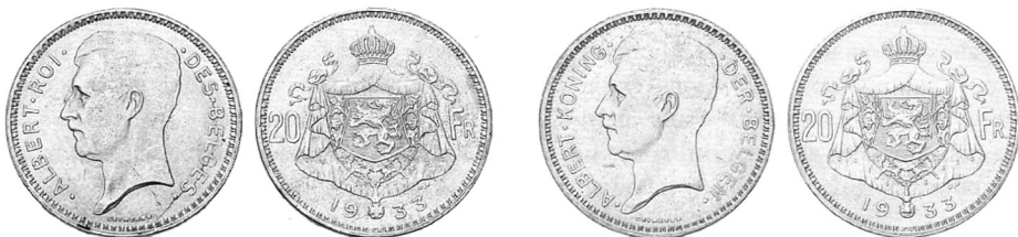
20 франків, срібло, 1933 р. Зліва — «французький» тип, справа — «фламандський».

Аверси 1 бельги — 5 франків та 4 бельг — 20 франків однакові: профіль короля Альберта I обличчям наліво й легенда «ALBERT · ROI · DES · BELGES» (для «французького» типу) чи «ALBERT · KONING · DER · BELGEN» (для «фламандського» типу) — «Альберт король бельгійців». Реверси монет відрізняються. Дизайн 1 бельги — 5 франків простіший: під короною у лаврово-дубовому вінку номінал та рік карбування в чотири рядки. При цьому центр монетного поля займає позначення номіналу у франках (відповідно «5 FRANCS» для «французького» типу чи «5 FRANK» для «фламандського»), а позначення номіналу в бельгах — вгорі меншими літерами й лише прописом — «UN BELGA» французькою мовою чи «EEN BELGA» нідерландською. Реверс монети у 4 бельги — 20 франків оформлений подібно до дизайну золотої 20-франкової монети 1914 р.: герб, що розділяє номінал «20 FR.» й рік унизу, угорі ж добавлено номінал у бельгах прописом — «QUATRE BELGAS» для «фран-