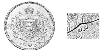
Ініціали Г. Девреза «G.D.» на реверсі монети номіналом 20 франків 1933–1934 рр.