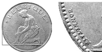
Підпис А. Боннетена «BONNETAIN» на 1 франку 1922–1935 рр. і на 2 франках 1923–1930 рр.

Монету номіналом 1 бельга — 5 франків підготували Годфруа Деврез (Godefroid Devreze) (аверс) та Олександр Евереп (Alexandre Everaerts) (реверс). Підпис першого «G. DEVREESE» знаходиться внизу вздовж буртика під портретом короля. Другий майстер залишив ініціали «A. E GR.» внизу вздовж буртика під вінком.