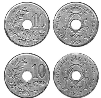
10 сантимів, мідно-нікелевий сплав. Угорі монета 1923 р. «французького» типу, унизу — монета 1927 р. «фламандського» типу.

Він унікав розкошів двору, любив приймати гостей, багато мандрував. Увійшов до історії насамперед своєю роллю в Першій світовій війні. В самій Бельгії король вважався національним героєм, а в усіх країнах Антанти його слава була величезною.