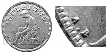
Ініціали А. Боннетена «A.B.» на 50 сантимах 1922–1934 рр.

50 сантиметрів, 1 франк і 2 франки 1922–1935 рр. із зображенням алегорії Бельгії, що лікує рану, розробив Арман Боннетен — відомий бельгійський скульптор, медальєр і гравер з Брюсселя. На 50 сантимах він поставив лише ініціали «A.B.» зліва вздовж буртика біля ноги Бельгії. На 1 і 2 франках на тому ж місці міститься підпис «BONNETAIN».