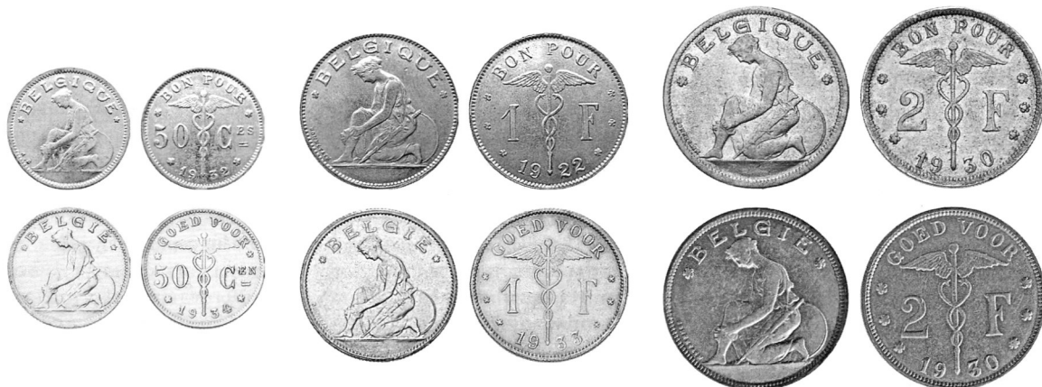
Угорі — «французькі» 50 центимів (нікель, 1932 р.), 1 франк (нікель, 1922 р.), 2 франки (нікель, 1930 р.). Унизу — «фламандські» 50 центимів (нікель, 1934 р.), 1 франк (нікель, 1933 р.), 2 франки (нікель, 1930 р.).

2 франки «французького» типу карбувалися у 1923 і 1930 рр. Відомий варіант монети 1923 р. із «медальним»