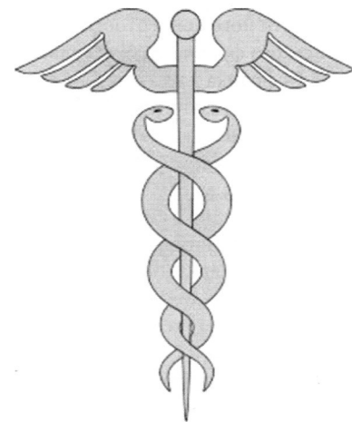
145 Кадуцей — емблема торгівлі й миру на бельгійських монетах 1920-х — 1930-х років.