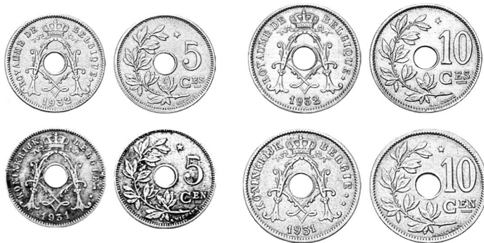
Нейзильберові монети Бельгії: вгорі — «французький» тип — 5 сантимів (1932 р.) і 10 сантимів (1932 р.), внизу — «фламандський» тип — 5 сантимів (1931 р.) і 10 сантимів (1931 р.). На позначення нового монетного металу додано зірочку в оформлення реверсів.

На звороті монет центральне місце посідає зображення кадуцея — емблеми торгівлі в новітній час, а в античності — жезл бога-заступника торгівлі Гермеса (Меркурія). У античних греків та римлян кудуцей, чи керикіон, був, подібно сучасному парламентарському прапору, необхідним атрибутом глашатаїв, що посилалися у ворожий табір, і запорукою їхньої недоторканності. Тобто на монеті зображення можна прочитати як символ торгівлі, примирення, недоторканності Бельгії. На монеті кадуцей зображений традиційно у вигляді крилатого жезла, обвитого двома зміями. По сторонам від нього —