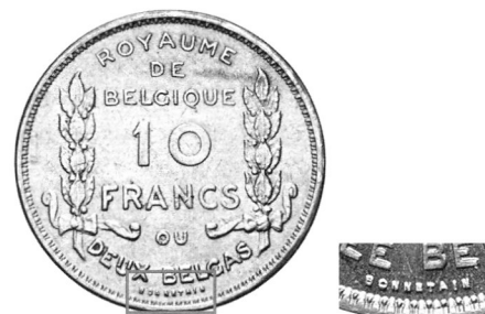
Підпис А. Боннетена «BONNETAIN» на реверсі монети номіналом 2 бельги — 10 франків.

Над дизайном нікелевої монети номіналом 4 бельги — 20 франків спільно працювали А. Боннетен (аверс) та Г. Деврез (реверс). Обидва поставили свої ініціали — відповідно «A.B.» під зрізом ший короля та «G.D.» справа під гербом.