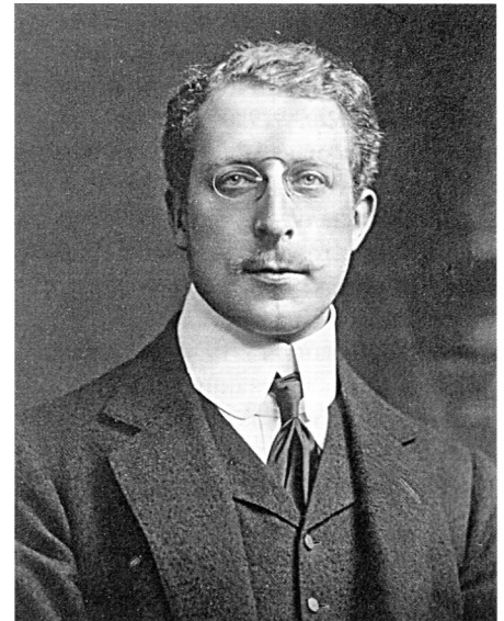
Альберт I — третій король бельгійців (1909–1934).

Карбування 10-сантимої монети розпочалося у 1920 р. Далі «французький» тип карбувався багатомільйонними тиражами у 1921, 1923, 1926–1929 рр., а «фламандський» — у 1921–1922, 1924–1930 рр. Для 1920–1921 рр. карбування відомі два типи монети —