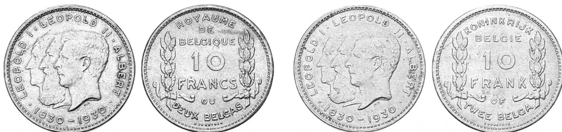
2 бельги — 10 франків (нікель, 1930 р.), «французький» (зліва) та «фламандський» (справа) типи.

Коли з'ясувалося, що нікелеві монети, хоч і високих номіналів, але не з дорогоцінного металу, є непопулярними серед населення, 10 жовтня 1933 р. прийнято рішення про заміну металу вищого номіналу на дорогоцінний — срібло. Проте повернення до довоєнного стандарту не відбулося — монета карбувалася з металу лише 680-ї проби