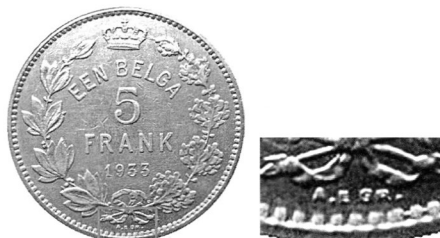
Ініціали Г. Девреза «A. E GR.» на реверсі монети номіналом 1 бельга — 5 франків.

Автором обох сторін монети номіналом 2 бельги — 10 франків є А. Боннетен. На аверсі його ініціали «A.B.» знаходяться під зрізом ший Альберта I, а на реверсі підпис «BONNETAIN» — внизу вздовж буртика.