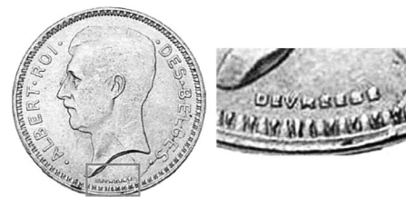
Підпис Г. Девреза «DEVREESE» на аверсі монети номіналом 20 франків 1933–1934 рр.

Г. Деврез став автором обох сторін срібної монети номіналом 20 франків 1933–1934 рр. На аверсі його прізвище «DEVREESE» знаходиться внизу вздовж буртика, а на реверсі — ініціали «G.D.» справа під гербом.