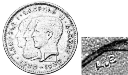
Ініціали А. Боннетена «A.B.» на аверсі монети номіналом 2 бельги — 10 франків.

Автором обох сторін монети номіналом 2 бельги — 10 франків є А. Боннетен. На аверсі його ініціали «A.B.» знаходяться під зрізом ший Альберта I, а на реверсі підпис «BONNETAIN» — внизу вздовж буртика.