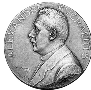
Арман Боннетен (1883–1973), бельгійський скульптор, медальєр і гравер. Медаль.

Арман Боннетен (Armand Bonnetain), який отримав завдання розробити дизайн нової серії монет, знайшов просте, а разом з тим оригінальне й навіть патріотичне рішення. Хоча для Бельгії Перша світова війна завершилася перемогою й звільненням, але вона принесла країні великі людські та матеріальні втрати. Тому майстер на аверсі монет зобразив не портрет короля, хоч той і був національним