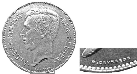
Підпис Г. Девреза «G. DEVREESE» на аверсі монети номіналом 1 бельга — 5 франків.

Монету номіналом 1 бельга — 5 франків підготували Годфруа Деврез (Godefroid Devreze) (аверс) та Олександр Евереп (Alexandre Everaerts) (реверс). Підпис першого «G. DEVREESE» знаходиться внизу вздовж буртика під портретом короля. Другий майстер залишив ініціали «A. E GR.» внизу вздовж буртика під вінком.