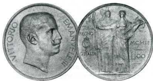
100 лір, золото, 1903 р., проба Д. Трентакосте.