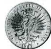
25 центезимо, нікель, 1903 р.