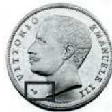
«Якір» на 20 лірах 1902 р. на означення того, що монета викарбована із золота Еритреї.

За монетою в 5 лір зберігалася традиційна назва італійської талерної монети — скудо ( ital. scudo — щит). Золоту монету в 20 лір італійці називали «маренго» ( ital. «margengo» ). Поява цієї назви пов'язана із випуском в Італії в 1800 р. після переможної битви біля Маренго 20-франкової монети із легендою «L'Italia délivrée à Marengo» ( франц. «Італія, звільнена біля Маренго» ).