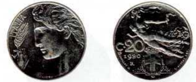
20 центезимо, нікель, 1920 р. Номінал подано скорочено – «С • 20».

На аверсі мідно-нікелевої монети в 20 центезимо зображено коронований щит Савойської династії, накладений на схрещені гілки дуба й лавра. Угорі півколом легенда «REGNO D'ITALIA». На реверсі – номінал і рік карбування в три рядки «CENT. /20/1918» у шестикутнику, довкола якого замкнений вінок з лавра й дуба. Так як монети перекарбовувалися зі старих, то достатньо часто на монетному полі можна побачити фрагменти попередніх зображень