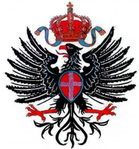
Малий герб Італії з королівського штандарту: під короною чорний орел із савойським щитом на грудях