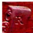
Знак Римського монетного двору «R» на 1, 2 і 5 центезимо 1908–1918 рр.