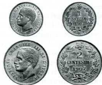
1 центезимо (1902 р.) і 2 центезимо (1907 р.), бронза.

У роки правління двох попередників Віктора-Еммануїла III в Італії карбувалися ще два бронзові номінали – 5 і 10 центе-