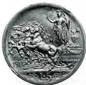
1 ліра (1915 р.), 2 ліри (1915 р.) і 5 лір (1914 р.), срібло. Тип «Жвава квадрига» (« Quadrigo briosa »).

чи легенд. З тієї ж причини гурт може бути або плоский, або рубчастий, або ж на ньому поєднуються плоскі фрагменти й рубці. Монети 1920 р. мають виключно плоский гурт, а тому досить вірогідно, що вони є не перекарбованими зі старих монет, а карбувалися на нових планшетах.