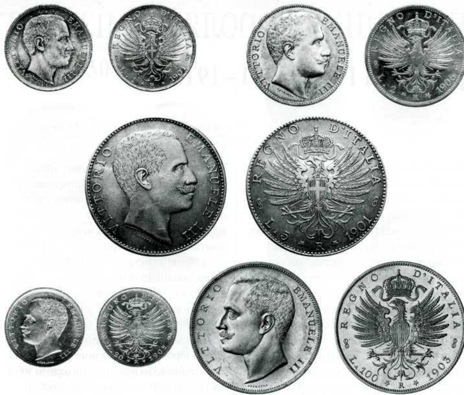
1 ліра, срібло, 1901 р., 2 ліри, срібло, 1906 р., 5 лір, срібло, 1901 р., 20 лір, золото, 1905 р., 100 лір, золото, 1903 р. Номінали подано скорочено — «L. 1», «L. 2», «L. 5», «L. 20» чи «L. 100».