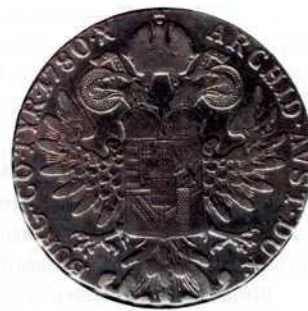
Італійський талер, срібло, 1918 р. й талер Марії Терезії, датований 1780 р.

Можливо, європейцям важко було сплутати ці монети, але італійці вважали, що неписьменні жителі Еритреї не побачать великої різниці.