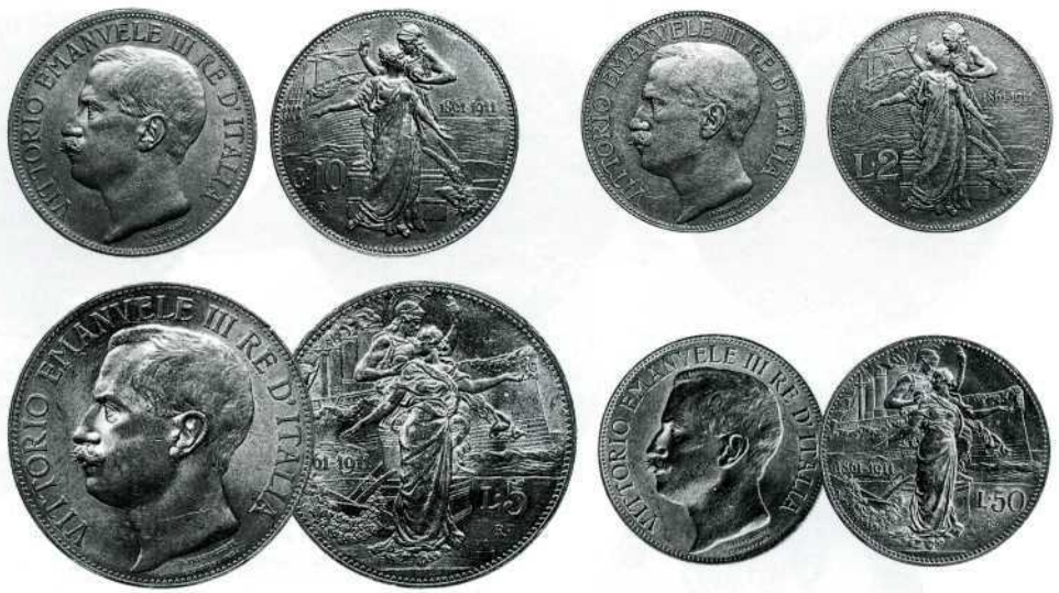
Ювілейні монети до 50-річчя Королівства Італії, 1911 р.

Ювілейні монети 1911 р. У 1911 р. Італія урочисто відзначала 50-ту річницю проголошення королівства, яке об'єднало північну та південну частину країни 18 лютого 1861 р. До цієї дати згідно до Королівських законів від 19 січня та 25 червня 1911 р. випущено серію ювілейних монет, яка включає номінали 10 центезимо, 2 ліри, 5 лір та 50 лір. Тираж 2 лір регулярного карбування було при цьому зменшено.