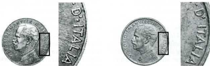
Варіанти аверса 5 центезимо 1913 р. зі словами «D' • ITALIA», або «D'ITALIA» в легенді.