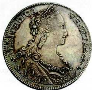
Аверс талера Венеціанської Республіки 1781–1797 рр. — прототип аверса італійського талера 1918 р.

Можливо, європейцям важко було сплутати ці монети, але італійці вважали, що неписьменні жителі Еритреї не побачать великої різниці.