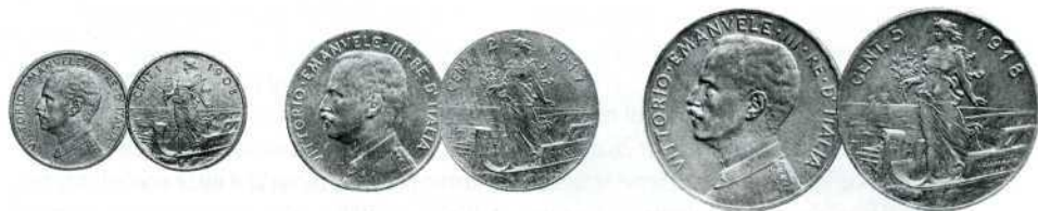
1 центезимо (1908 р.), 2 центезимо (1917 р.) і 5 центезимо (1918 р.), бронза. Номінал подано скорочено — «CENT. 1», «CENT. 2» чи «CENT. 5».