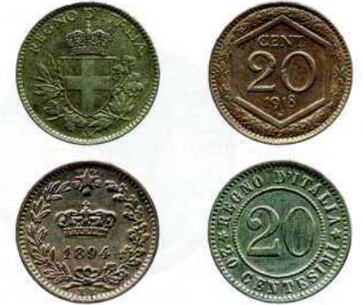
20 центезимо, мідно-нікелевий сплав, 1918 р. Перекарбування із монети 1894–1895 рр.