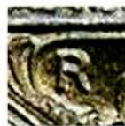
Знак Римського монетного двору «R» на 1, 2 і 5 лірах 1914–1917 рр.