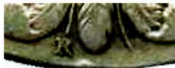
Знак Римського монетного двору «R» на італійському талеро 1918 р.