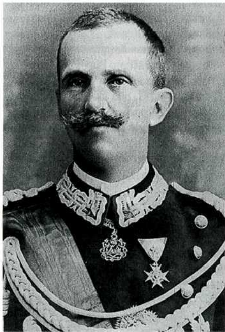
Віктор-Еммануїл III (1869–1947), король Італії (з 1900 р.) і один з найбільших колекціонерів у історії нумізматики – його колекція налічувала понад 100 тисяч монет

Грошова система Італії на початку XX ст. Королівство Італія нового часу виникло у 1861 р. в ході Рісорджименто й об'єднання країни під владою Сардинського королівства. Правляча в Сардинському королівстві Савойська династія стала правлячою династією Італії. Після ліквідації Папської області в 1870 р. й перенесення столиці з Турину до Риму об'єднання Італії було остаточно завершено. Королівство стало першою державою з часів розпаду Римської імперії, яке контролювало увесь Апеннінський півострів (крім невеликих анклавів Сан-Марино і Ватикан). 29 липня 1900 р. короновано Віктора-Еммануїла III. Він увійшов в історію не лише як третій і останній король Італії нового часу, але й завдяки найбільшій пристрасті свого життя – колекціонуванню монет. Колекція короля була справді величезною – понад 100 тисяч монет. Більш того, колекція є також величезним архівом, якщо зважити на те, що кожна монета в