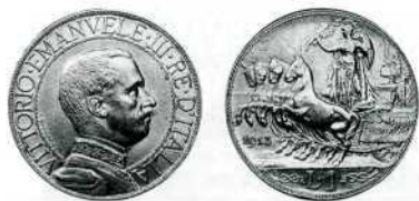
1 ліра (1913 р.) і 2 ліри (1908 р.), срібло. Тип «Швидка квадрига» (« Quadrigo veloce »).