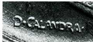
Підпис Д. Каландри на аверсах 1, 2 і 5 лір 1914–1917 рр.