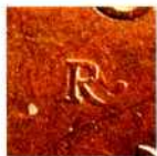
Знак Римського монетного двору «R» на ювілейних монетах 1911 р.