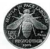
20 лір, золото, 1906 р., проба.