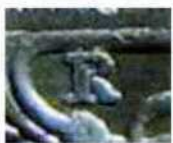
Знак Римського монетного двору «R» на 1 і 2 лірах 1908–1913 рр.