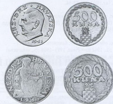
500 кун, золото, 1941 р. Є неофіційними випусками й ніколи не перебували в грошовому обігу.

Медальєром на монетному дворі працював професор Академії мистецтв у Загребі Іво Кердич (Ivo Kerdić). Він у 1941 р. розробив серію пробних екземплярів хорватських монет, яку не було пущено у тираж. Єдиною обіговою монетою, автором якої є І. Кердич, стали 2 куни 1941 р. Підпису майстра на монеті немає.