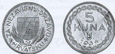
Монетовидний знак з лицевим номіналом 5 кун, срібло, 1934 р.

У 1930 р. з'явилася цікава нумізматична пам'ятка, хоча вона й не є власне монетою. Хорватські усташі викарбували монетовидні знаки з лицевим номіналом 5 кун із зображенням хорватського геральдичного щита й легендою «ZA NEZAVISNU DRŽAVU HRVATSKU», що перекладається як «За Незалежну Державу Хорватську». Датовані знаки 1934 р. Відомі варіанти у бронзі, мідно-нікелевому сплаві, сріблі та цинку. Їх розглядають як пропагандистські жетони, хоча не виключено, що усташі бачили в них гроші майбутньої незалежної Хорватії.