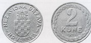
2 куни, цинк, 1941 р.

Через викладені обставини було прийнято рішення щодо зміни монетного металу з нікелю на дешевший цинк. Єдиним номіналом, який ще міг обслуговувати ринок, залишалися 2 куни. На аверсі монети зображено герб НДХ у коловій легенді «NEZAVISNA DRŽAVA HRVATSKA» («Незалежна Держава Хорватія»). На реверсі — у плетеному колі номінал «2 KUNE» та рік карбування «1941» в три рядки.