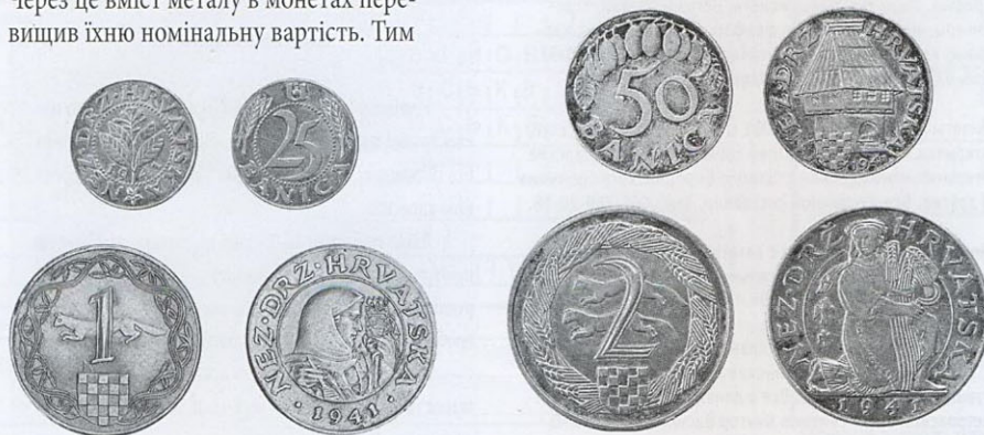
Пробні монети Незалежної Держави Хорватія, 1941 р.

Анте Павелич (1889–1959), засновник і голова хорватської фашистської організації усташів, «поглавник» Незалежної Держави Хорватія (1941–1945). Після краху НДХ йому вдалося втекти з Югославії. Засуджений заочно югославським народним судом до смертної кари, переховувався у Австрії, Італії, Аргентині, Іспанії. Помер у Мадриді.