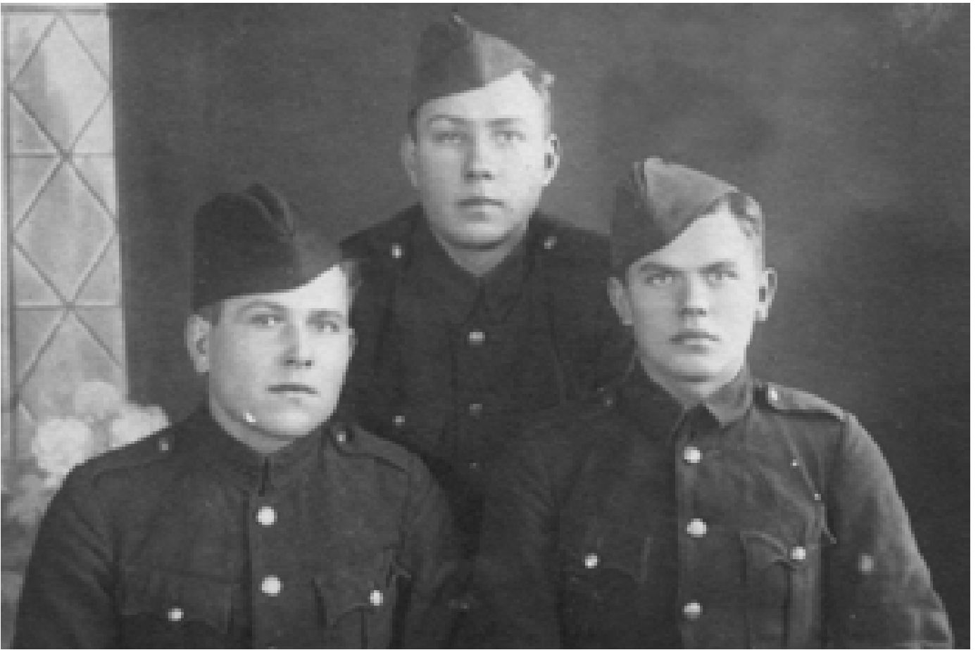
Українські офіцери 115-го батальйону в уніформі німецької охоронної поліції. На мундирах відсутні будь-які знаки приналежності

дороги від можливих нападів партизанів. В список стратегічних об'єктів потрапили ключові села, мости, млини, вапняний завод, паперова фабрика, і, звичайно ж, штаб батальйону. Одна рота завжди трималася в резерві, займаючись у цей час безперервними навчаннями. У випадку, коли місцева поліція чи агентура доносили про появу в околицях того чи іншого села партизанів, резервна рота виїжджала на місце, де здійснювала прочісування лісу для знаходження і знищення наявних партизанських загонів.