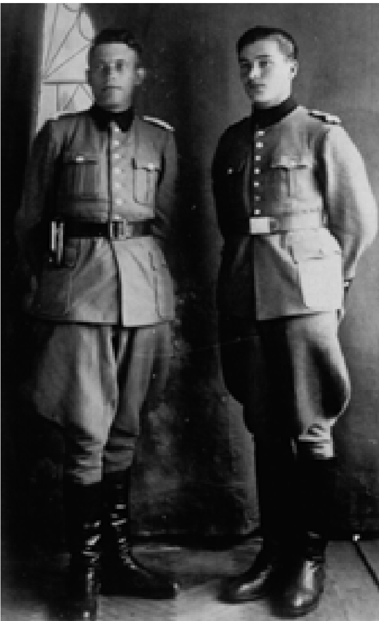
Група шуцманів 115-го батальйону в литовській уніформі. 1942 рік

Таким чином, новостворений 115-й батальйон шуцманшафту (який часто називають батальйоном української поліції) опиняється на початку осені 1942 р. у тренувальному таборі під Мінськом, де особовий склад проходить найпростішу військову підготовку, яка продовжується у будь-яку вільну хвилину впродовж всього існування частини — за принципом «солдат завжди повинен бути зайнятий».