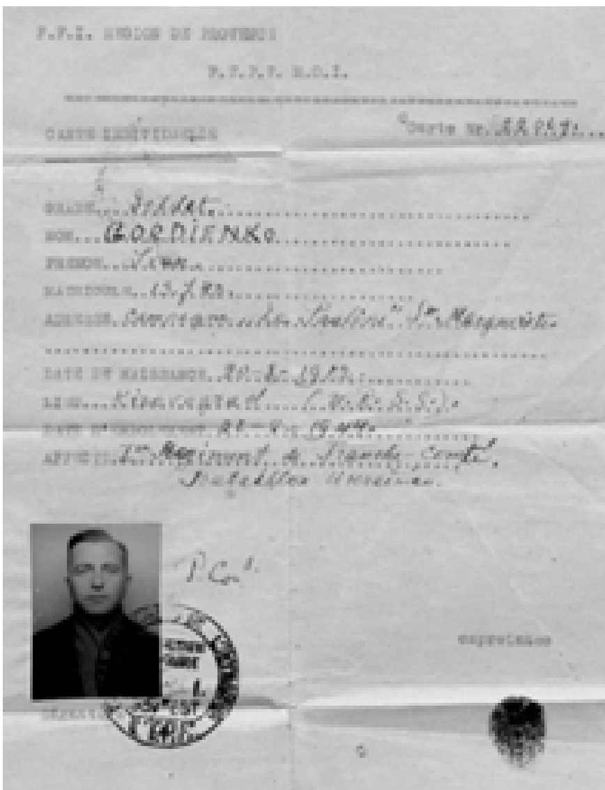
Французька особова картка стрільця Українського батальйону ФФІ

ще через рік звільнили за амністією тих, хто дожив, офіційно знизивши терміни відбуття покарання до 10 років ВТТ 35 .