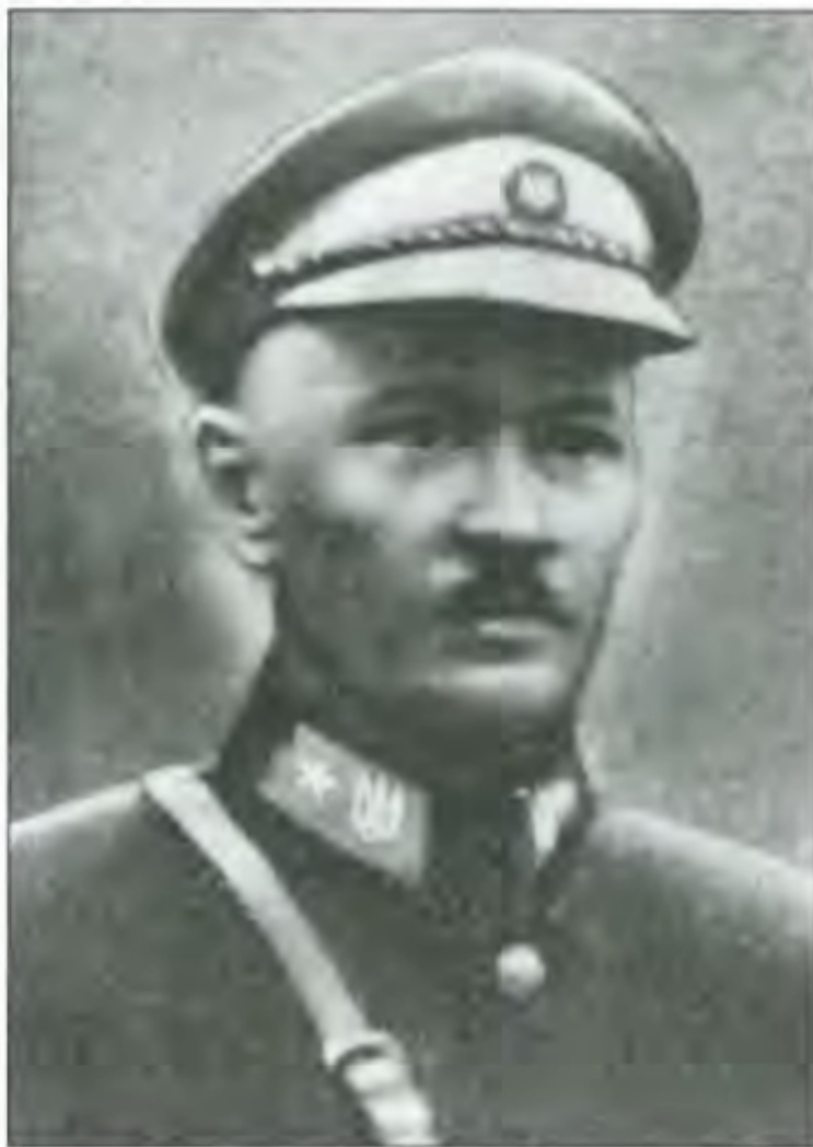
Микола Шаповал, полковник (пізніше генерал-хорунжий)

Помітивши ворога в околицях Кам'янця-Подільського, полковник О.Удовиченко вирішує силами дивізії перейти в наступ. Група полковника В.Ольшевського в складі 1-го Синьо-