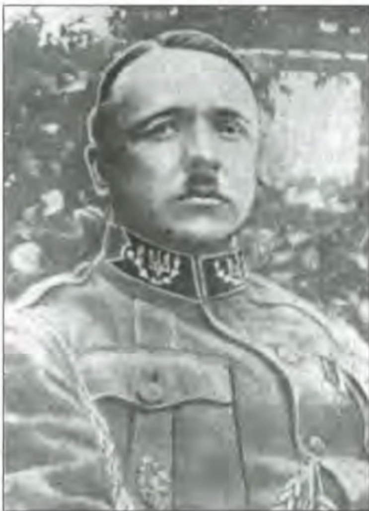
Олександр Удовиченко, генерал штабу, генерал-хорунжий, командир 3-ї Залізної дивізії