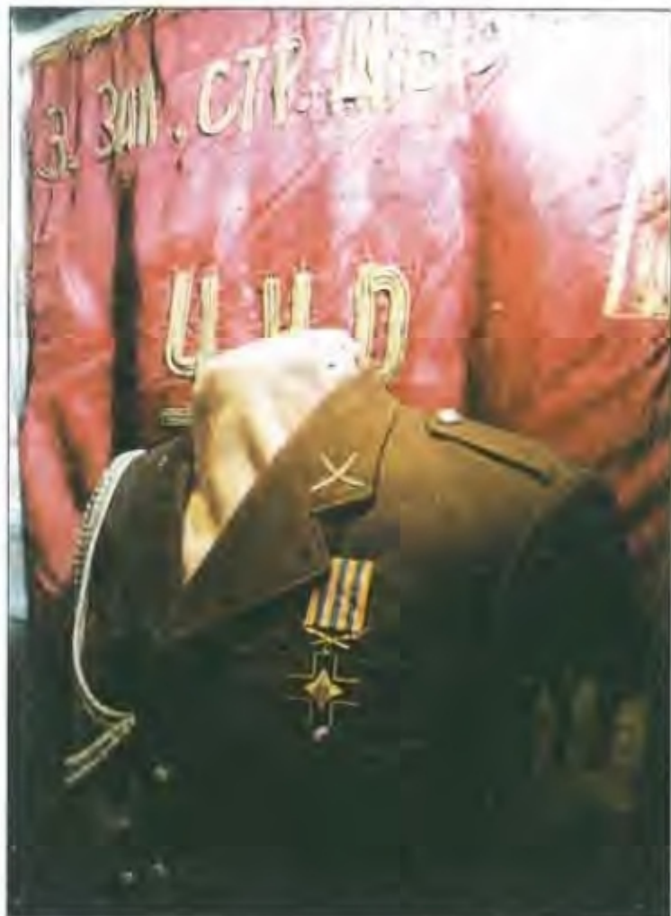
Однострій вояка і Бойовий прапор 3-ї Залізної стрілецької дивізії Армії УНР. 1919 р. Центральний музей Збройних Сил України

Бої 22 – 29 червня на переправі через р.Случ були дуже важкими: