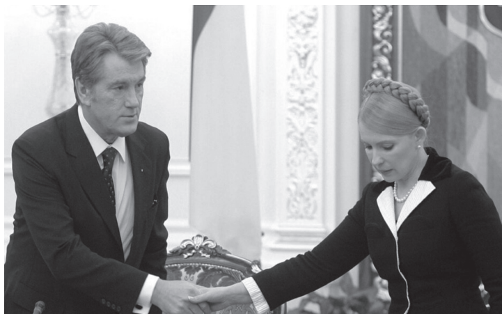
Віктор Ющенко і Юлія Тимошенко

боку, головними переговорниками були насамперед Андрій Клюєв як політична фігура та Володимир Лавринович і Сергій Ківалов як юристи. І з великою долею імовірності можна стверджувати, що ці переговори та їх затягування прямо залежали від Віктора Януковича, який довго був не готовий прийняти будь-яке рішення. Він розумів, що в такій конфігурації він стає розмінною монетою і, за бажання, за новою Конституцією його могли просто обдурити і запропонувати крісло президента комусь іншому. З одного боку, він дуже хотів мати хоч якусь відносно вагому посаду, але водночас боявся, що його можуть використати і просто усунути від будь-яких владних важелів. Власне цей страх і допоміг йому утвердити, чи не вперше за багато років, відносно-самостійну позицію. А зустріч з Плющем стала для нього тією соломинкою, за яку він готовий був ухопитися, бо в Партії регіонів не могли не зрозуміти, що Ющенко не жартує. Для нього єдиним завданням на той момент було недопущення до влади Юлії Тимошенко. Відтоді Віктор Ющенко, по суті, став головним союзником Віктора Януковича.