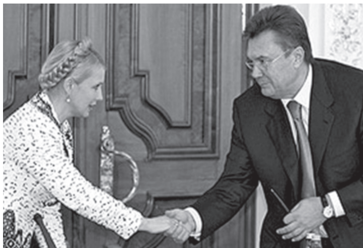
Юлія Тимошенко і Віктор Янукович

Парламентська опозиція отримує право призначати першого заступника голови Верховної Ради, голів комітетів з питань бюджету, регламенту, свободи слова і ЗМІ. Виконавча влада в містах, районах і областях належить виконкомам місцевих рад, які обираються за пропорційною системою. При цьому зберігаються прямі вибори міських голів, керівників сіл і селищ. Проектом запроваджується жорсткий імперативний мандат і для депутатів парламенту, і для депутатів місцевих рад. Згідно з перехідними положеннями, наступні вибори парламенту відбудуться восени 2014 року 237 .