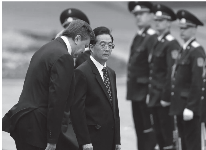
Віктор Янукович і голова КНР Ху Цзіньтао

в якій економічні клани відіграють вирішальну роль у політичному житті країни» 1178 . «Надання капіталів без будь-яких вимог позбавляє економічні еліти почуття відповідальності і скорочує число стимулів для проведення реформ, потенційно здатних завдати шкоди їхньому бізнесу» 1179 , – наголосив Парментье.