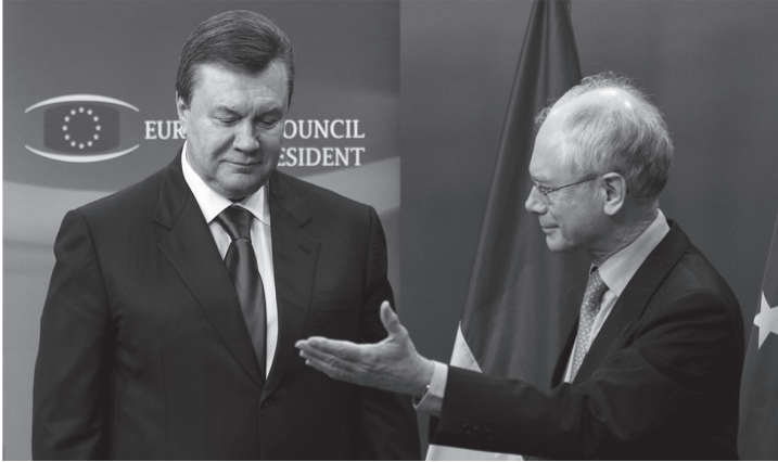
Президент Європейської ради Герман Ван Ромпей і Президент України Віктор Янукович в Брюсселі. 1 березня 2010 р.

Янукович здійснив 1 березня 2010 р. – на четвертий день після інавгурації. Він вирушив до столиці Бельгії – Брюсселя. Під час візиту Янукович зустрівся з керівництвом ЄС: президентом Європейської Комісії Жозе Мануелем Баррозу, президентом Європейської Ради Германом Ван Ромпеем, президентом Європейського парламенту Єжи Бузеком та верховним представником ЄС із закордонних справ і політики безпеки, першим віцепрезидентом Єврокомісії Кетрін Ештон 1008 .