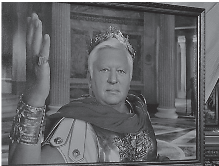
Віктор Пшонка в образі Цезаря