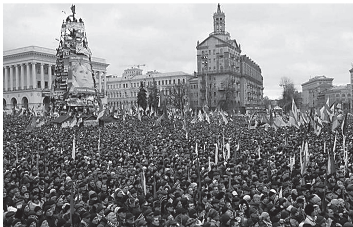
Майдан. 8 грудня 2013 р.

На задалегідь оголошене віче на майдані Незалежності в Києві зібралися, за різними оцінками, декілька сотень тисяч людей. За офіційними даними Міністерства внутрішніх справ України, в акціях протесту взяли участь 100 тисяч осіб. За даними опозиції, на центральні вулиці столиці 8 грудня вийшли на мітинг від 500 тисяч до 1 мільйона людей.