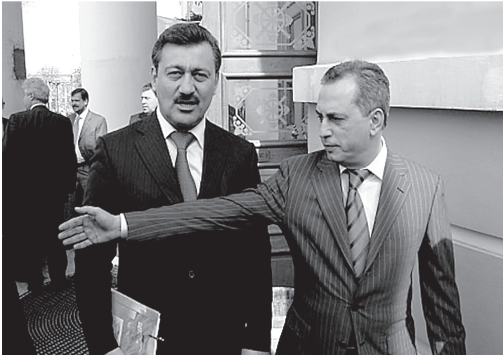
Василь Джарти і Борис Колесніков

зацій 535 . Також з'їзд обрав президію політради, переобрав Януковича головою партії і обрав 12 його заступників на цій посаді.