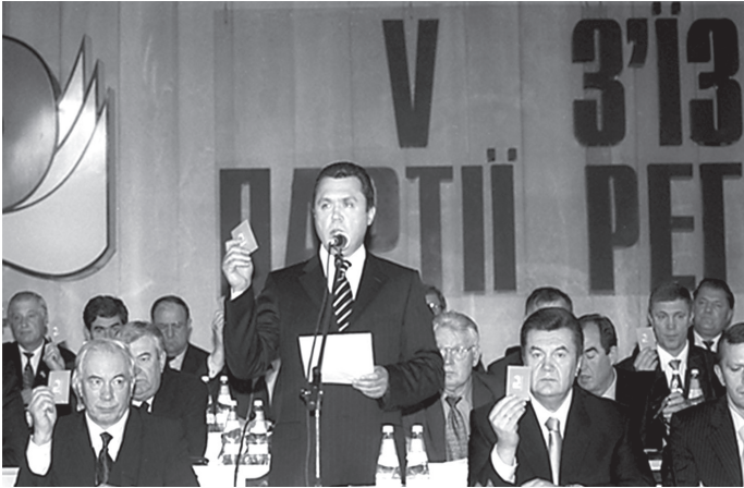
В з'їзд Партії регіонів. 2003 р.

Основним опонентом прем'єр-міністра В. Януковича на президентських виборах 2004 року став Віктор Ющенко. Його включення у передвиборчі перегони відбулося 4 липня 2004 року в Києві. На Співочому полі В. Ющенко оголосив, що висуває свою кандидатуру на пост Президента України 190 .