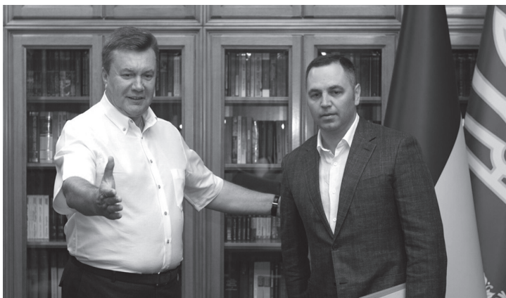
Віктор Янукович і Андрій Портнов

У вересні 1997 р. починає працювати в Державній комісії із цінних паперів та фондового ринку, де робить стрімку кар'єру: помічник голови – начальник управління корпоративних фінансів – керівник групи помічників і радників голови – начальник управління корпоративних фінансів. У 2002 р. відкриває власну юридичну компанію «Портнов і партнери» у Києві. Фірма спеціалізувалася на послугах у сфері інвестиційного бізнесу, корпоративного управління, приватизації, операцій з цінними паперами. Наступного року повертається до Державної комісії із цінних паперів та фондового ринку на посаду першого заступника виконавчого секретаря, а згодом – члена комісії. Через кілька років Андрій Портнов полишає роботу в комісії й займається адвокатською діяльністю.