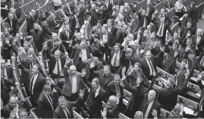
Ухвалення «диктаторських законів». 16 січня 2014 р.

закони і передати їх на підпис Президенту. Янукович вже в четвер підписав ці закони.