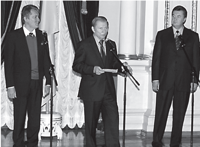
В. Ющенко, Л. Кучма, В. Янукович. 2004 р.

ацію». Судячи з усього, росіяни дали мовчазне добро на проведення третього туру.