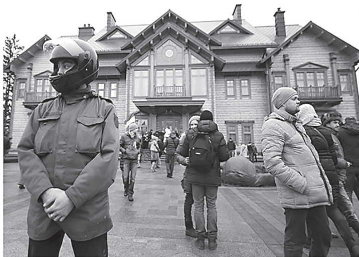
Резиденція В. Януковича «Межигір'я»

Водночас на засіданні Верховної Ради було зачитано заяви про звільнення спікера Володимира Рибак і його першого заступника Ігоря Калетника. Новим головою Ради було обрано Олександра Турчинова 1548 , за нього проголосувало 288 народних депутатів. Було визначено, що новообраний Голова Верховної Ради Турчинов координуватиме роботу Кабміну до формування коаліційного уряду. Таке рішення було підтримане 314 депутатами 1549 .