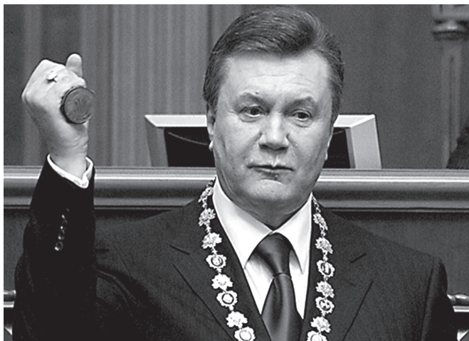
Інавгурація В. Януковича. 2010 р.

3) мобілізація базового електорату в ключових для Партії регіонів областях;