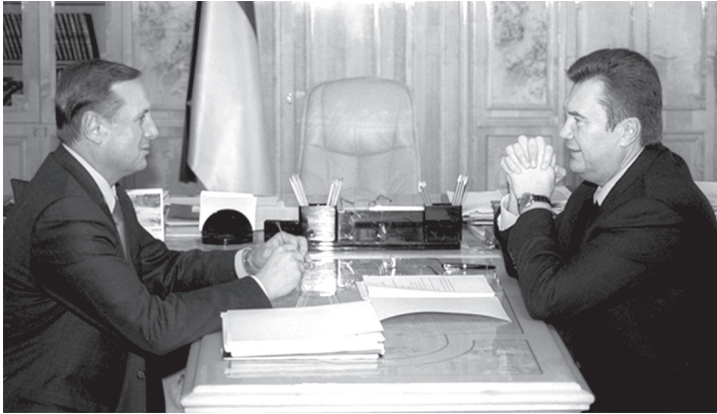
Прем'єр-міністр України В. Ф. Янукович (праворуч) під час зустрічі з головою Луганської облдержадміністрації О. С. Єфремовим. 2003 р.

(народний депутат II скликання від Донецчини, очолював Фонд держмайна з квітня 2003 р. по квітень 2005 р.). 17 січня 2007 р. помер Кушнар'єв після поранення на полюванні, 8 лютого Слаута був призначений віцепрем'єром, але нових заступників голови фракції ПР їм на заміну обрано не було.