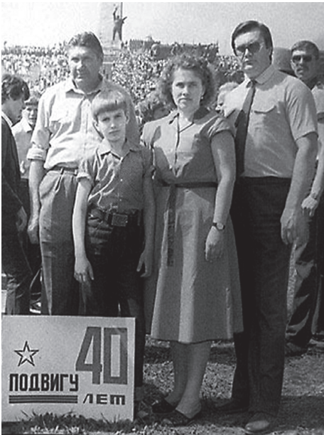
Віктор Янукович з дружиною, сином і батьком

но-виробничого об'єднання автотранспорту. Воно було створене ще 1988 р. під час спроб реорганізації планової економіки і діяло вже в незалежній Україні.