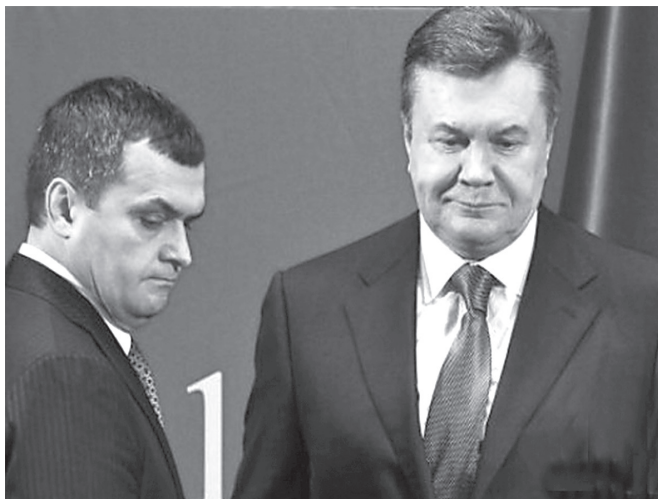
Віталій Захарченко і Віктор Янукович

7 листопада 2011 р. Янукович звільнив Захарченка з посади голови ДПСУ 457 і призначив його міністром внутрішніх справ 458 , а на посаду голови ДПСУ призначив Олександра Клименка, якому на той момент ще не виповнилося 31 року 459 . Він теж належав до «сім'ї» Януковича і через свого старшого брата Антона Клименка був пов'язаний із Сергієм Арбузовим.