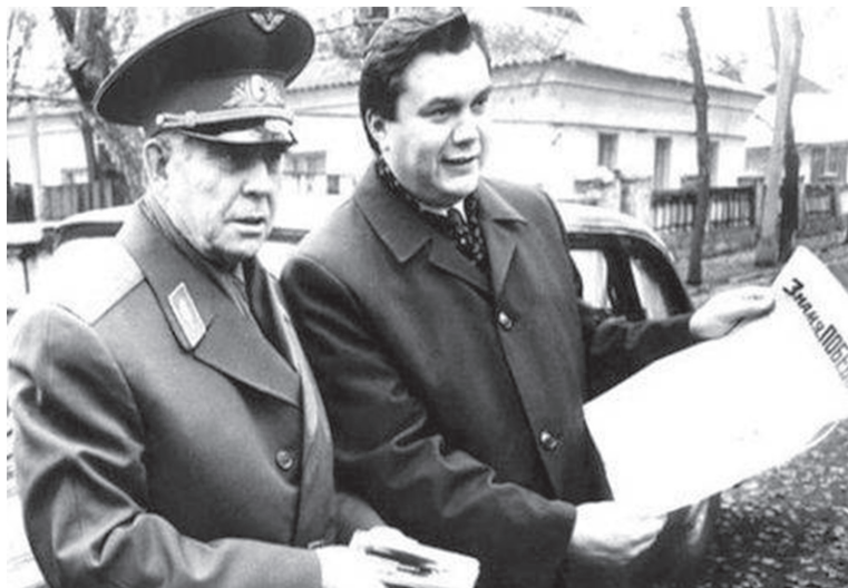
Георгій Береговий і Віктор Янукович

на керівні посади, і майбутніх студентів. Ще незвичайнішими виявилися подальші віхи біографії колишнього арештанта. У 1978 р. до Донецького обласного суду начебто звертається депутат Верховної Ради СРСР, льотчик-космонавт Георгій Береговий з проханням реабілітувати Віктора Януковича. Несподіване прохання пізніше створило кілька легенд. За однією з них, батько Януковича дружив з легендарним космонавтом і в скрутний час той допоміг непуцящому синові друга. Це видається неможливим, адже Береговий займався в Єнакіївському аероклубі наприкінці 1930-х рр., а Федір Янукович за архівними документами потрапив на Донбас не раніше 1945 р.