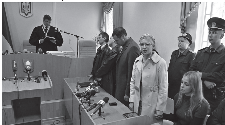
Судовий процес над Юлією Тимошенко

На підставі заяв комісії про порушення під час укладання українсько-російських газових контрактів Генеральна прокуратура України відкрила ще одну справу проти Тимошенко за частиною 3 статті 365 Кримінального кодексу України – «перевищення влади або службових повноважень». За версією слідства, Юлія Тимошенко, перебуваючи на посаді прем'єр-міністра України у 2009 р., незаконно доручила голові НАК «Нафтогаз» підписати невідповідні для України газові контракти.