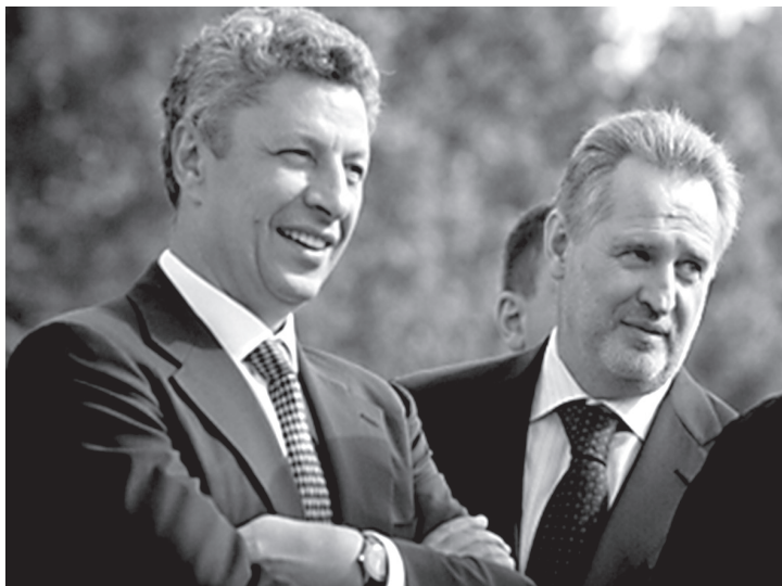
Юрій Бойко і Дмитро Фірташ

Київську область після президентських виборів віддали групі Фірташа-Львовчкіна-Бойка. І головою обласної державної адміністрації призначили Анатолія Присяжнюка, який до того очолював «Чорноморнафтогаз» (2006-2009 рр.), а потім був заступником голови СБУ. Його головне завдання – перебрати контроль над обласною