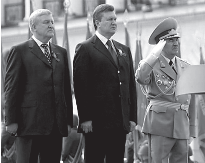
Міністр оборони України Михайло Єжель, президент Віктор Янукович і начальник Генерального штабу, головнокомандувач Збройних сил України, генерал армії Іван Свида під час військового параду. Київ 9 травня 2010 р.

2010 р., коли Верховна Рада формувала новий уряд, Янукович звернувся з поданням про призначення Єжеля міністром оборони 595 , і вона задовольнила це прохання 596 . Вибір Януковичем кандидатури Єжеля виявився несподіваним не лише для оглядачів, а й для керівництва Партії регіонів і оточення Януковича.