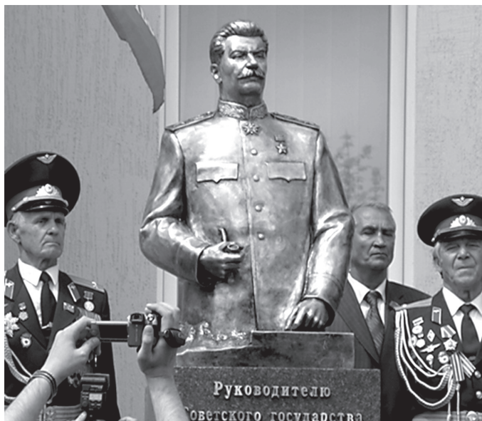
Пам'ятник Сталіну у Запоріжжі. 2010 р.

Особливе місце в планах режиму Віктора Януковича щодо придушення опозиції займав праворадикальний рух. В умовах переслідування прихильників Юлії Тимошенко та нейтралізації Податкового майдану саме націоналісти мали найбільший потенціал для силового опору владі. Крім того, борючись з українськими праворадикалами, Янукович мав змогу укріпити свій образ як «захисника стабільності та порядку», на які зазіхають «екстремістськи налаштовані елементи».