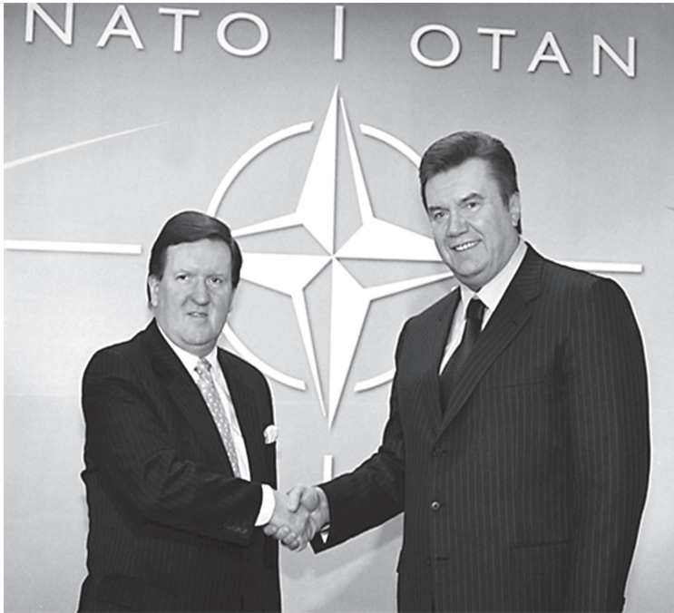
Прем'єр-міністр України В. Ф. Янукович (праворуч) під час зустрічі з Генеральним секретарем НАТО Джорджем Робертсоном. 2003 р.

ізоляцію режиму Леоніда Кучми на тлі «касетного» 182 та «кольчужного» 183 скандалів з боку західних партнерів. Це виражалося в підтримці ініціатив Кучми щодо активізації українсько-російських відносин. У вересні 2003 р. в Ялті укладено угоду про приєднання до Єдиного економічного простору з Росією, Білоруссю та Казахстаном, а сам рік було оголошено «Роком Росії в Україні» 184 .