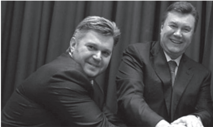
Едуард Ставицький і Віктор Янукович

Податківці підписували необхідні документи на повернення ПДВ без проведення належних перевірок. Відтак підприємства недоплачували кошти в держбюджет, і гроші розподілялися між підконтрольними особами, податківцями та іншими зацікавленими 382 .