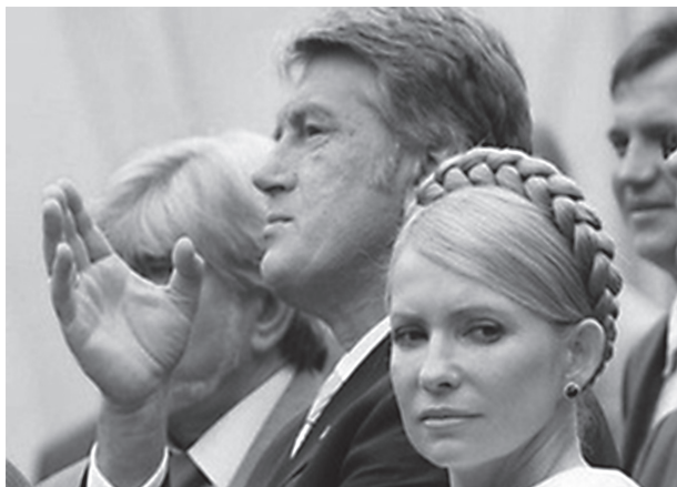
Віктор Ющенко і Юлія Тимошенко

потрапили п'ять політичних сил – Партія регіонів – 175 депутатів (34,37%), Блок Юлії Тимошенко – 156 депутатів (30,71%), Блок «Наша Україна – Народна Самооборона» – 72 депутати (14,15%), Комуністична партія України – 27 депутатів (5,39%), «Блок Литвина» – 20 депутатів (3,96%) 227 . На основі вказаного розподілу депутатських мандатів сформувалася парламентська коаліція. Більшість у парламенті цього скликання отримали Блок Юлії Тимошенко й блок «Наша Україна-Народна самооборона». Саме ці два політичні об'єднання сформували парламентську коаліцію за назвою «Коаліція демократичних сил» 228 .