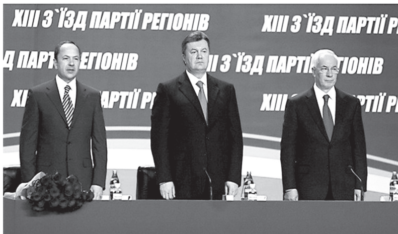
XIII з'їзд Партії Регіонів. 17 березня 2012 р. Сергій Тігіпко, Віктор Янукович, Микола Азаров

Однак Партія регіонів розпочала підготовку до виборів задовго до цієї дати. Першим підготовчим кроком став XIII з'їзд ПР 17 березня 2012 р., на якому ПР прийняла пропозицію партії «Сильна Україна» про припинення її діяльності (саморозпуск) і злиття з ПР шляхом індивідуального вступу членів «Сильної України» до ПР. Лідер «Сильної України» віцепрем'єр – міністр соціальної політики Сергій Тігіпко був обраний членом політради і заступником Миколи Азарова на посаді голови ПР 563 .