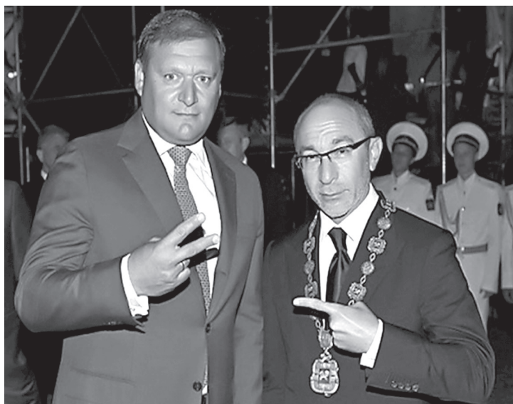
Михайло Добкін і Геннадій Кернес

секретар міськради Геннадій Кернес. Власне цей тандем і став основою всієї регіональної політики Харківщини періоду правління Януковича (Добкін залишався головою ОДА до повалення режиму Януковича, а Геннадій Кернес – міським головою Харкова). В області після смерті Євгена Кушнарєва було лише два діячі, які могли скласти конкуренцію – це керівник групи «ДСН» Олександр Ярославський та керівник Харківської ОДА часів Ющенка Арсен Аваков.