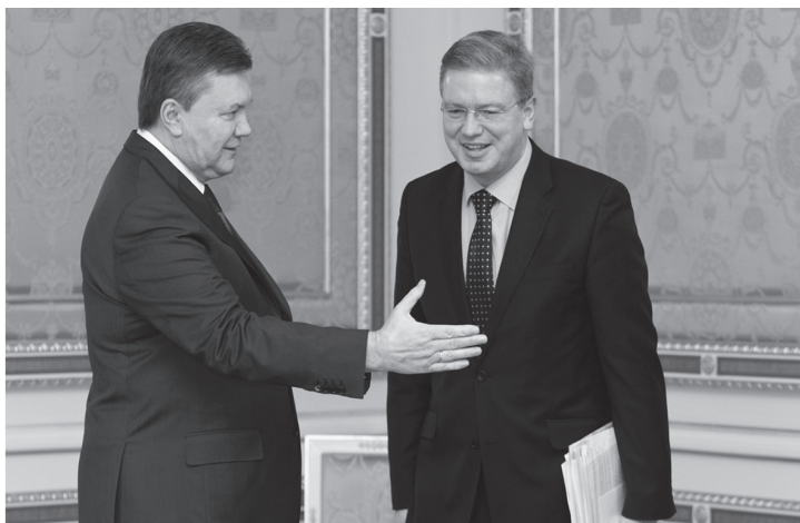
Віктор Янукович з єврокомісаром Штефаном Фюле

Східного партнерства у Вільнюсі. «Що стосується термінів, то вони чітко зрозумілі – це листопад 2013 р. Я сказав про те, що таких термінів, як грудень 2013-го або січень 2014-го, не існує», – сказав Фюле. Він зазначив, що ЄС чекає від України рішучих кроків на шляху виконання умов, сформульованих у висновках Ради ЄС у закордонних справах 10 грудня, і наголосив: «У нас є вікно можливостей для того, щоб рухатися вперед, проте час обмежений» 1313 .