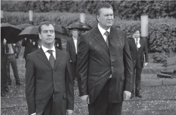
Віктор Янукович та Дмитро Медведєв під час покладання вінків до пам'ятника невідомому солдату Другої світової війни. Київ, 17 травня 2010 р.

Говорячи про цю подію та відносини, що складаються між Україною і Росією останнім часом, Віктор Янукович зазначив: «За цей короткий період часу ми змогли знайти взаємовигідні рішення, які відповідають не лише національним інтересам наших країн, а й інтересам та сподіванням українського і російського народів. Люди давно чекали, коли наші держави знімуть незрозумілу та складну тональність у відносинах».