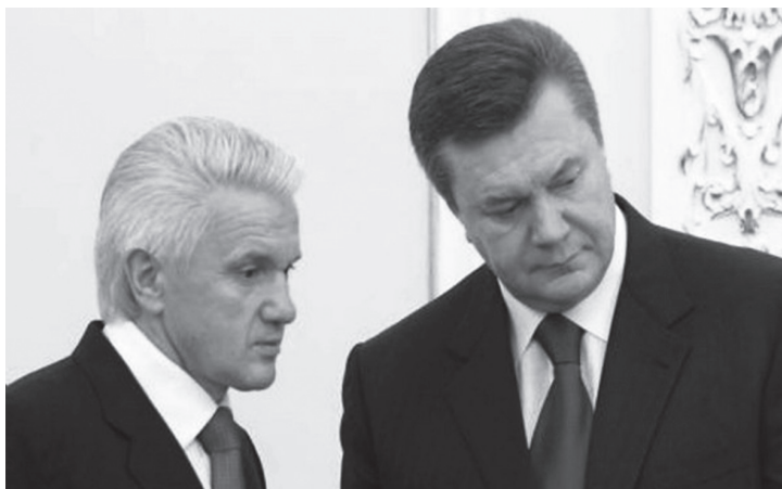
Володимир Литвин і Віктор Янукович

3) швидкість отримання результату – нові коаліційні переговори з НУНС або ж перевибори вимагали тривалого часу (щонайменше кілька місяців), протягом якого уряд залишався би під контролем Юлії Тимошенко – ключового опонента нового президента. «Коаліція тушок» дозволяла максимально швидко отримати контроль над парламентом.