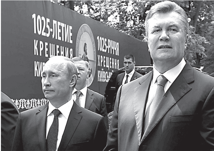
Володимир Путін і Віктор Янукович під час святкування 1025-річчя хрещення Київської Русі

1025-ліття хрещення Русі та на спільне святкування Дня флоту ВМС України та Чорноморським флотом РФ. Зустріч президентів у Києві тривала всього 15 хв (!), після цього Путін поїхав на круглий стіл, організований «Українським вибором» Медведчука 957 .