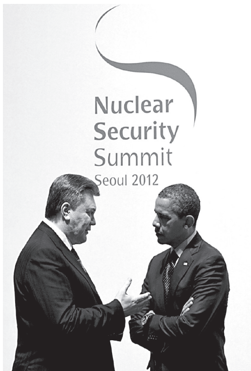
Віктор Янукович і Барак Обама на Сеульському саміті. 2012 р.

Цей виступ відбувся напередодні Сеульського саміту, на якому українська сторона прагнула зустрічі Янукович-Обама. Звідси, 27 березня 2012 р. у Сеулі, в межах саміту з питань ядерної безпеки, відбулася надкоротка зустріч Обами та Януковича. Президент США в тій політичній ситуації просто не міг мати класичної двосторонньої зустрічі з Президентом України, якого звинувачували в політичних переслідуваннях. Тоді, саме в березні 2012 року, Україна відправила останню партію військового урану до Росії 995 .