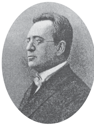
Броніслав Григорович Пржевальський

Українські історики медицини не приділяли належної уваги цій персоні. Тому сучасні дослідження 3 , згадуючи професора Броніслава Пржевальського на його черговий ювілей, не тільки не відрізняються оригінальністю, а й містять низку фактографічних помилок, які переходять з однієї статті до іншої. На превеликий