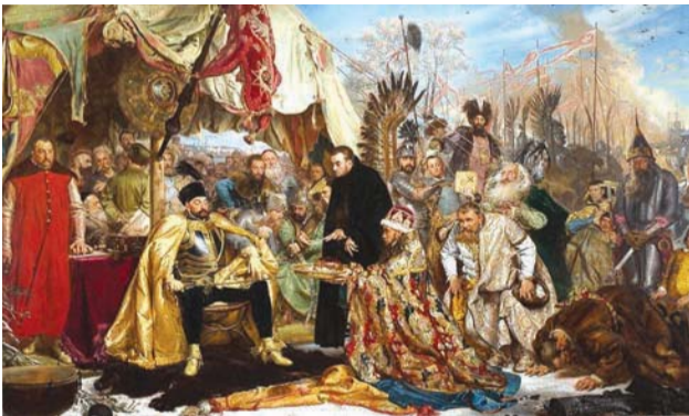
Стефан Баторій під Псковом, Ян Матейко, 1872