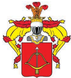
Родовой герб Пржевальських

инство возводить его Самого и потомков Его на вечные времена. Желая притом Герб, а равно и Дворянским Достоинством и всеми правами и преимуществами Дворянству присвоенными, он с потомством своим пользоваться имеет по