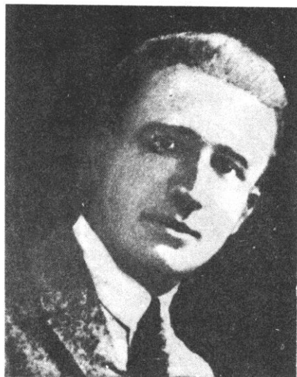
Полковник Андрій Мельник (1923—1924)