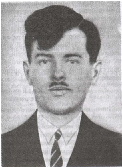
Степан Охримович визначний член УВО, СУНМ і Крайовий Провідник ОУН у 1930 р.