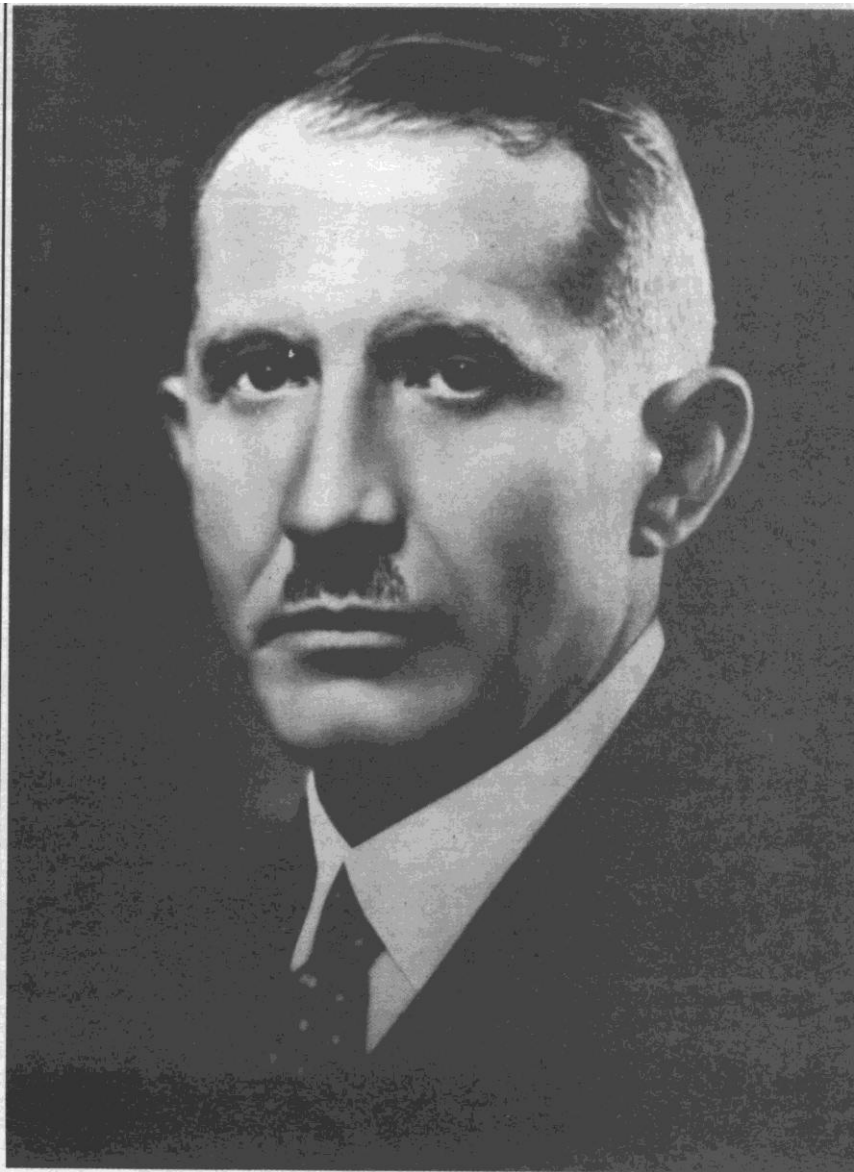
Евген Коновалець Головний комендант УВО