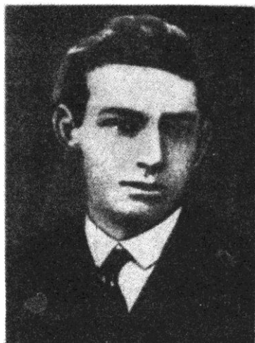
Ярослав Любович, застрілений 5.3.1929 р. у бойовій акції УВО у Львові