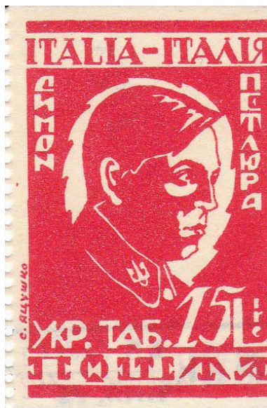
Рис. 9. Марка «Симон Петлюра. Укр. таб. пошта. Italia-Италія»

9. Марка негашена, зубкована. Назва: «Симон Петлюра. Укр. таб. пошта. Italia-Италія». Італійська Республіка. Інвентарний № 2923/2. Книжковий друк у біло-червоних кольорах. Зображено портрет Симона Васильовича Петлюри (1879–1926) – українського державного, військового та політичного діяча, публіциста, літературного й театрального критика, організатора українських збройних сил, Генерального секретаря з військових справ при Генеральному секретаріаті Української Центральної Ради (28 червня – 3 грудня 1917), Головного отамана військ Української Народної Республіки (з листопада 1918); Голови Директорії УНР (9 травня 1919 – 10 листопада 1920). Написи: «Симон Петлюра», «Укр. таб. пошта», «Italia-Италія». Вказані ціна «15 Lire» та автор «С. Яцушко». Розмір марки: 5,1×3,4 см. (Рис. 9)