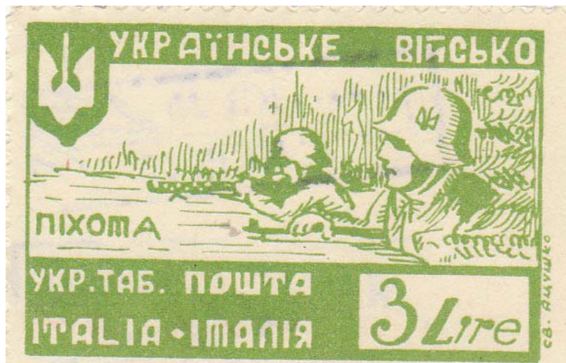
Рис. 11. Марка «Українське військо. Піхота в окопах. Укр. таб. пошта. Italia-Італія»

2. Марка негашена, зубкована. Назва: «Українське військо. Піхота в окопах. Укр. таб. пошта. Italia-Італія». Італійська Республіка. Інвентарний № 2920/1. Друкована у біло-зелених кольорах. Зображено піхотинців українського війська в шоломах німецького зразка із тризубом, у одного в руках – німецький кулемет часів Другої світової війни MG 34, у другого – гвинтівка; зверху в лівому куті – тризуб. Написи: «Українське військо», «Піхота», «Укр. таб. пошта», «Italia-Італія». Вказані ціна «3 Lire» та автор «С. В. Яцушко». Розмір марки: 5,1×3,4 см. (Рис. 11)