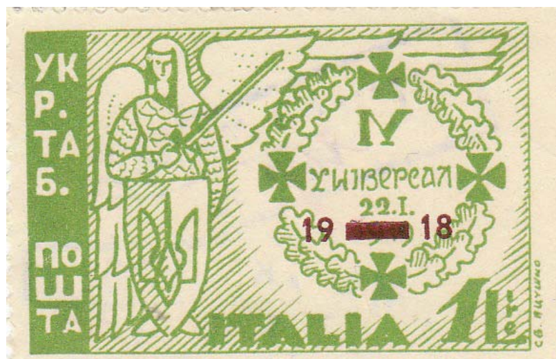
Рис. 12. Марка «IV Універсал 22.I.1918. Укр. таб. пошта. Italia-Італія»

Означена пропам'ятна марка видана до 28-річчя IV Універсалу Центральної Ради Української Народної Республіки, яким 22 січня 1918 р. було проголошено державну незалежність України. (Рис. 12)