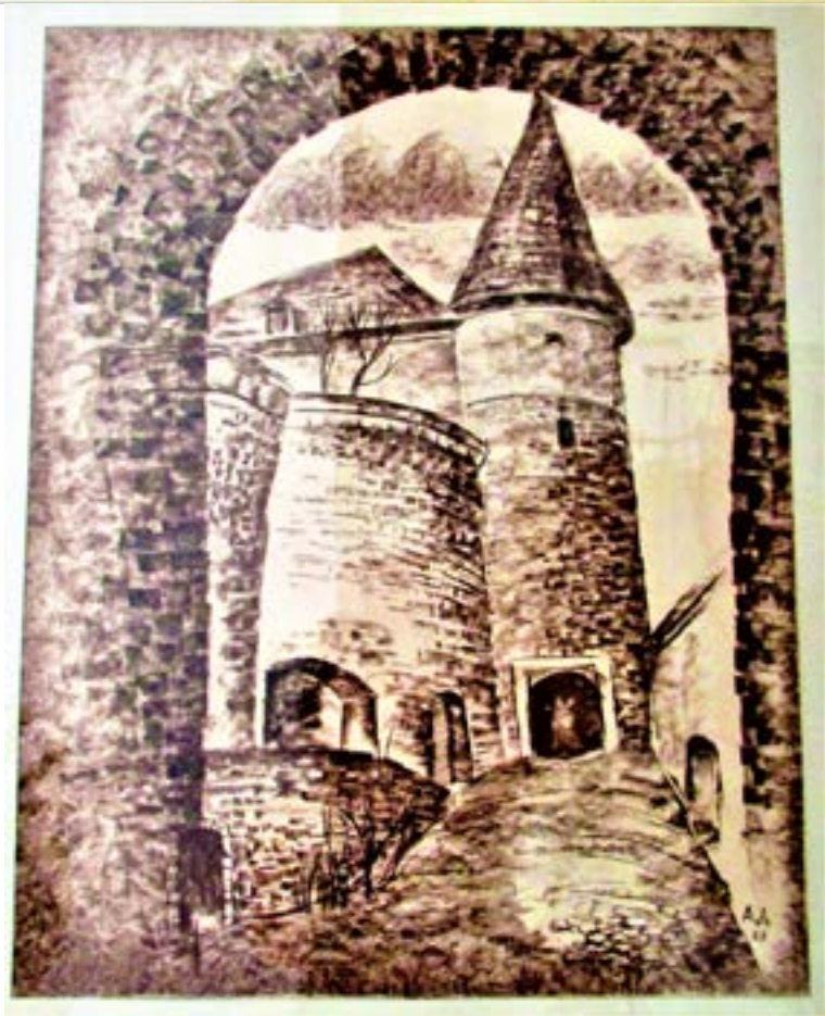
Рис. 4, 5