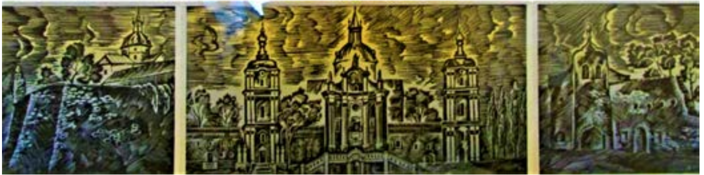
Рис. 6, 7, 8