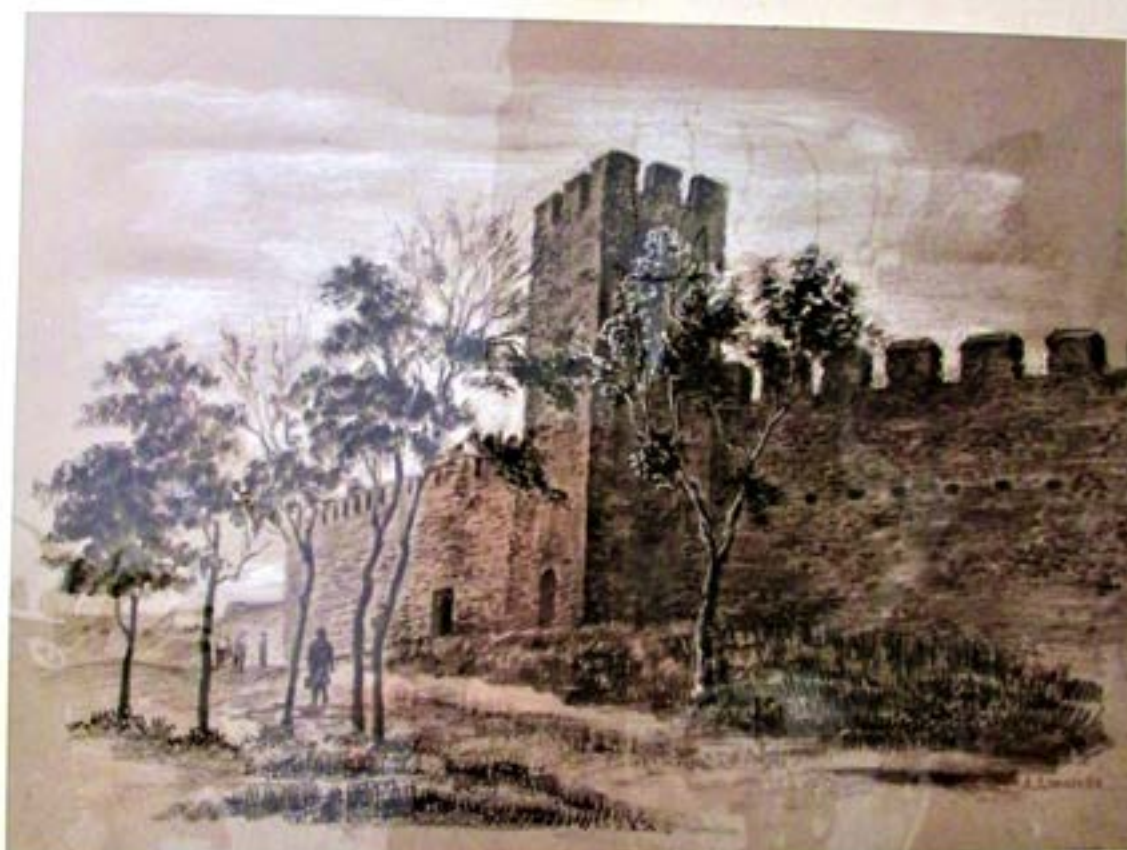
Рис. 2, 3