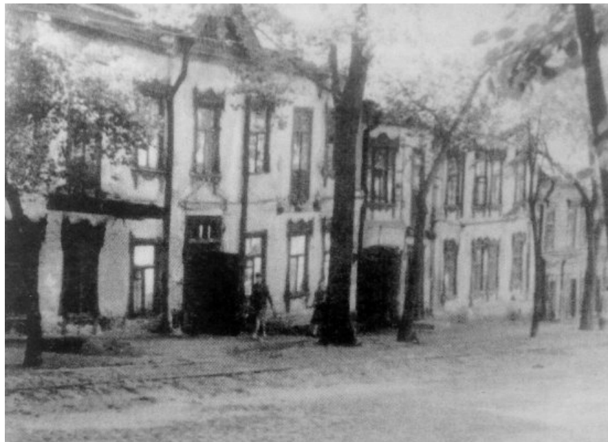
Будинок у Києві по вулиці Гоголівській, 27, у якому від початку ХХ ст. мешкали родина Дурдуківських та С. Єфремов до арешту С. Єфремова та В. Дурдуківського у 1929 році. 1966 рік.