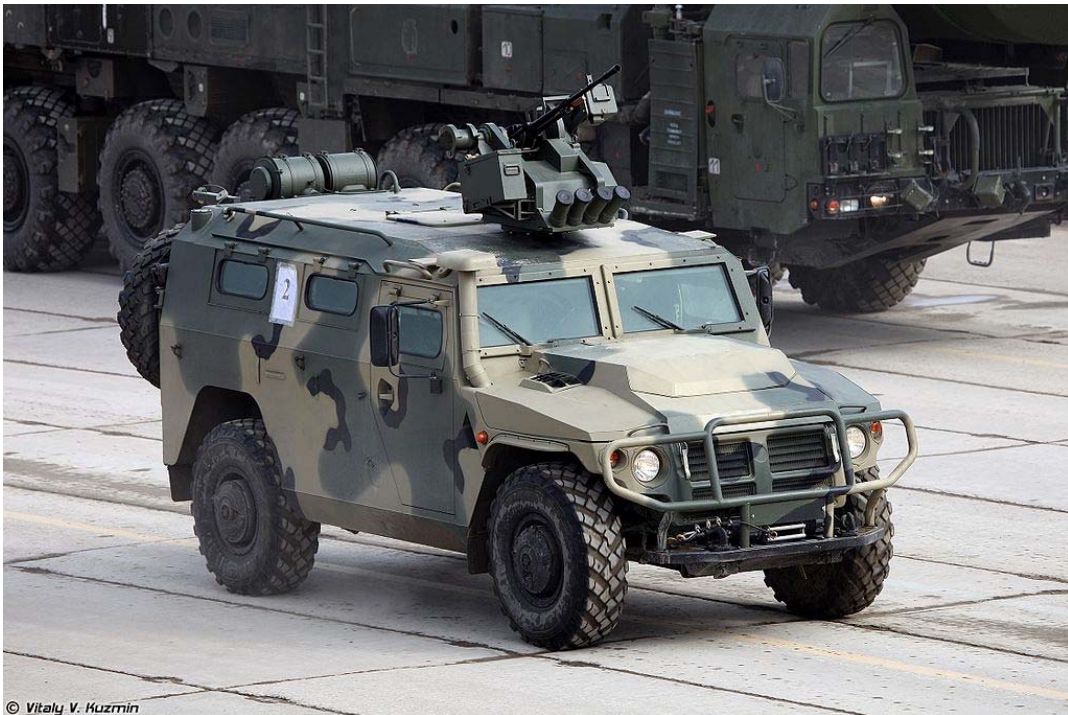
Российский военный бронированный внедорожник ГАЗ-2330 (АМН 233114) «Тигр», уничтоженный уже в количестве нескольких сотен божественным войском украинцев.

Коварная и ненасытная и Россия, психически инфантильное население которой привыкло испоганивать свои земли и поэтому испокон веков нуждается в новых, сейчас передислоцирует в Европу даже с Дальнего Востока свои войска с амурскими «Тиграми». Поэтому руководители Китая будут недалновидными, если не воспользуются такой удобной возможностью и не присоединят прямо сейчас к Китаю Восточную Сибирь вместе с Дальним Востоком нынешней России: