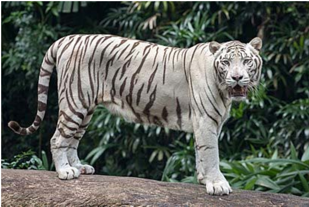
Белый тигр – коварный, жестокий и кровожадный зверь, убитый предками украинцев.