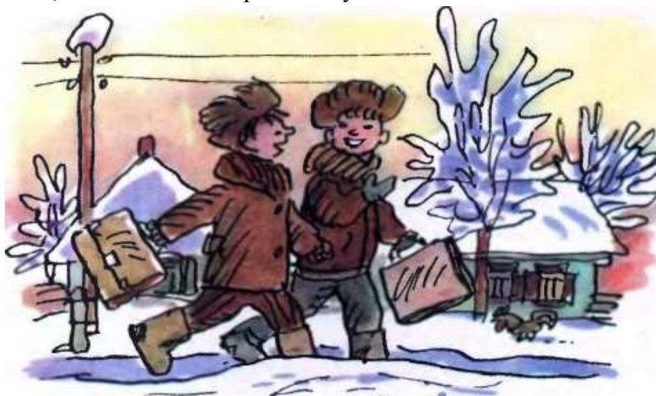
Фото на згадку

— Хлопці, а що там на завтра додому задавали?