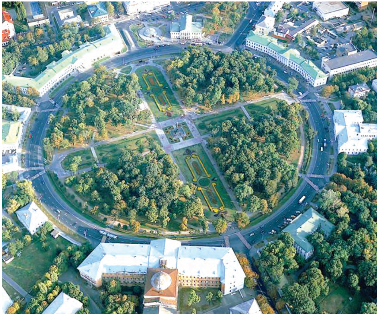
Фото 1. Кругла площа у Полтаві. 2000-і рр.