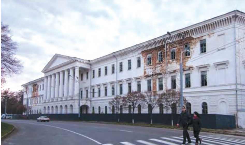
Фото 7. Полтавський Петровський кадетський корпус. 2013 р.

особі, незважаючи на те, що за законодавством пам'ятки культурної спадщини національного значення приватизації не підлягають. Протягом наступного десятиліття йшли судові процеси про повернення Кадетського корпусу у комунальну власність, причому за цей час його приміщення кілька разів горіло, адже ніким не охороняється (фото 7).