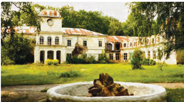
Фото 5. Центральний вхід палацу Муравйових-Апостолів. 2013 р.

цієї душі – осіб без певного місця проживання 10 . Не менш занедбаний і старовинний пейзажний парк навколо палацу площею 77 га. У 1960 р. йому надано статус пам'ятки садово-паркового мистецтва загальнодержавного значення, хоча ще у 1927 р. округовим центральним пролетарським музеєм Лубенщини пропонувалося взяти під охорону держави парк і взагалі весь маєток як мистецьку та історичну пам'ятку 11 . В парку ростуть липи, берези, граби, й хоч більшість з них уже самосів, проте ще залишились деякі дерева старіше 200 років. Його окрасою залишається потрійний дуб, посаджений І. Муравйовим-Апостолом на честь синів-декабристів, як нагадування про родинну та історичну драму. За палацом знаходиться ставок, на якому в часи розквіту маєтку був острівець з бесідкою, але зараз все захаращене і потребує прочистки 12 . Складається враження, що до 200-річчя повстання декабристів їхнє родинне гніздо просто не доживе.