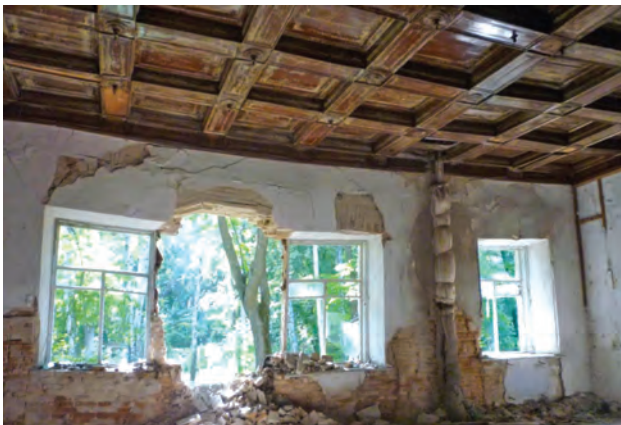
Фото 4. Дерев'яна стеля у залі, в якій був музей-кімната декабристів. 2013 р.