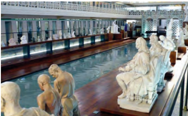
Фото 10. Басейн-музей м. Рубе. 2011 р.