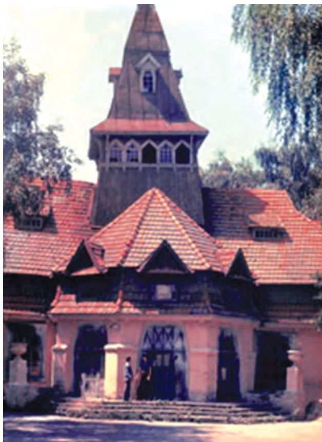
Фото 15. Водолікарня Миргородського курорту. 70-і рр. ХХ ст.