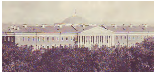
Фото 6. Полтавський Петровський кадетський корпус. Поч. ХХ ст.

До подібного стану доведена ще одна пам'ятка культурної спадщини національного значення Полтавської області, занесена до Державного реєстру нерухомих пам'яток України – Полтавський Петровський кадетський корпус, найбільша за розмірами споруда архітектурно-містобудівного ансамблю Круглої площі в Полтаві. Побудований у 1835–1840 рр. архітектором М. Бонч-Бруевичем на кошти кількох губерній Кадетський корпус має товщину стін – півтора метра, що ніби то є гарантією довговічності (фото 6). У радянський час його будівля використовувалася за безпосереднім призначенням,