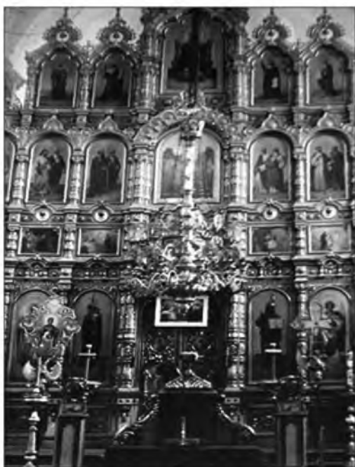
Лютенька. Успенська церква. Поч. 1900-х. 1950-і. 1970-і. Іконостас.

Фото 16. Успенська церква у с. Лютенька Гадяцького району, опубліковано у 12 томі Полтавської Енциклопедії «Полтавіка». Полтава, 2009. – С. 362.