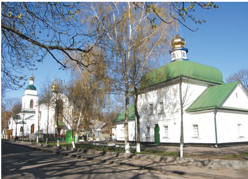
Фото 19. Спаська церква у Полтаві. 2015 р.

(вже другу) Спаської церкви у її первісному вигляді. Побудовану у 2004 р. дзвіницю теж залишили й використовують зараз як каплицю, таким чином історичний комплекс Спаської церкви невіpravно спотворено, та й сама церква загубилася серед цих новобудов (фото 19).