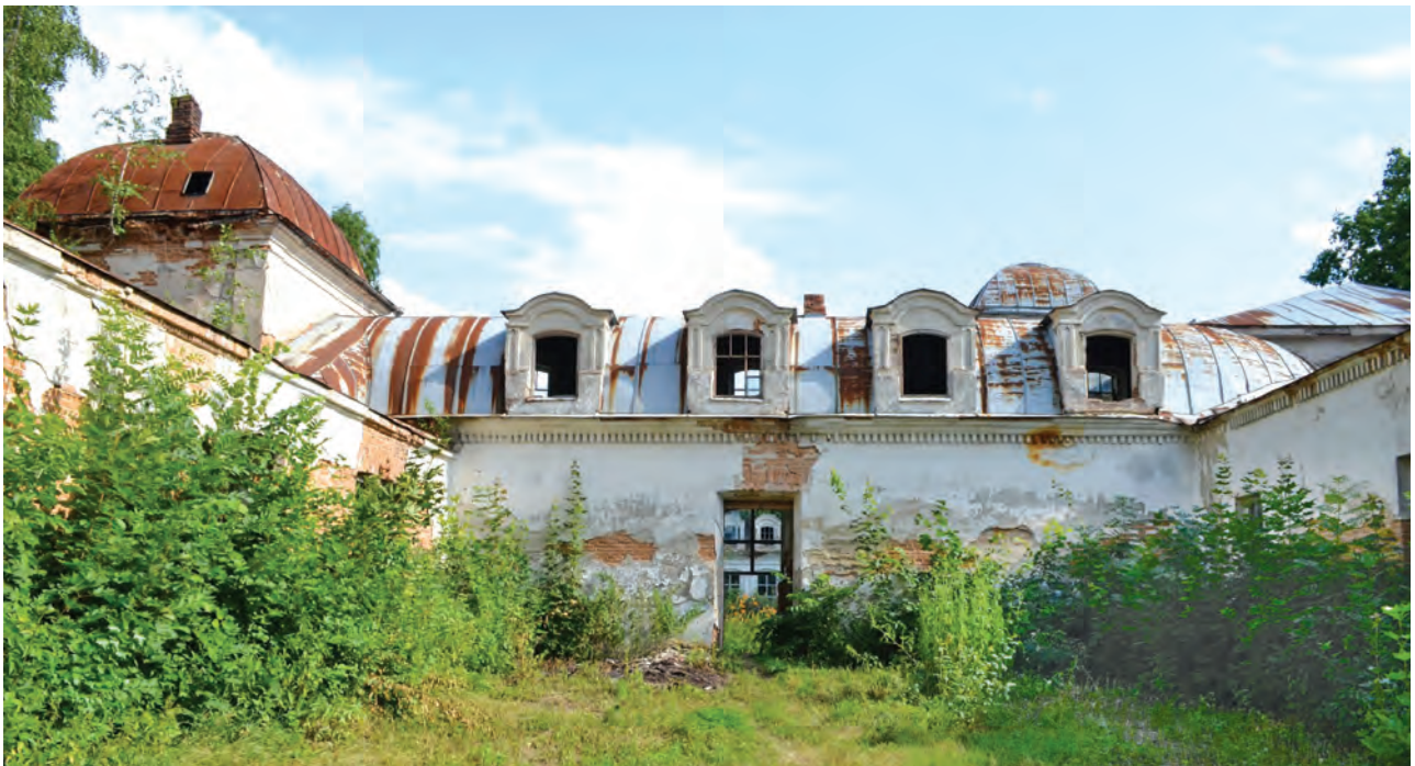
Фото 3. Палац Муравйових-Апостолів. 2011 р.

Палац братів Муравйових-Апостолів у с. Хомутець Миргородського району з 2009 р. є пам'яткою культурної спадщини національного значення Полтавської області, занесеною до Державного реєстру нерухомих пам'яток України. Але після переїзду до нового приміщення Хомутецького ветеринарно-зоотехнічного технікуму, у який 1933 р. трансформувалася сільськогосподарська школа, палац стоїть пустою й поступово руйнується (фото 3). Всі звернення до центральних і місцевих органів влади закінчуються традиційними ще з радянських часів відповідями про відсутність коштів, причому чиновники різного рівня намагаються перекласти відповідальність один на одного, не вирішуючи проблему по суті. Хоча «Планом заходів щодо збереження, реставрації та реабілітації пам'яток культурної спадщини на території області», затвердженим головою Полтавської облдержадміністрації у 2011 р., передбачалося здійснити протягом 2011–2014 рр. «виготовлення науково-проектної документації та виконання ремонтно-реставраційних робіт музею-садиби Муравйових-Апостолів у с. Хомутець» 9 .