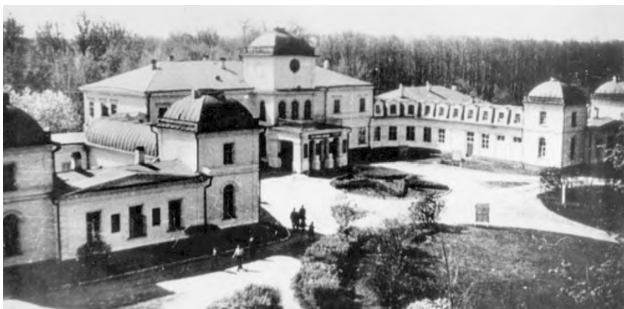
Фото 2. Палац Муравйових-Апостолів. 60-і рр. ХХ ст.