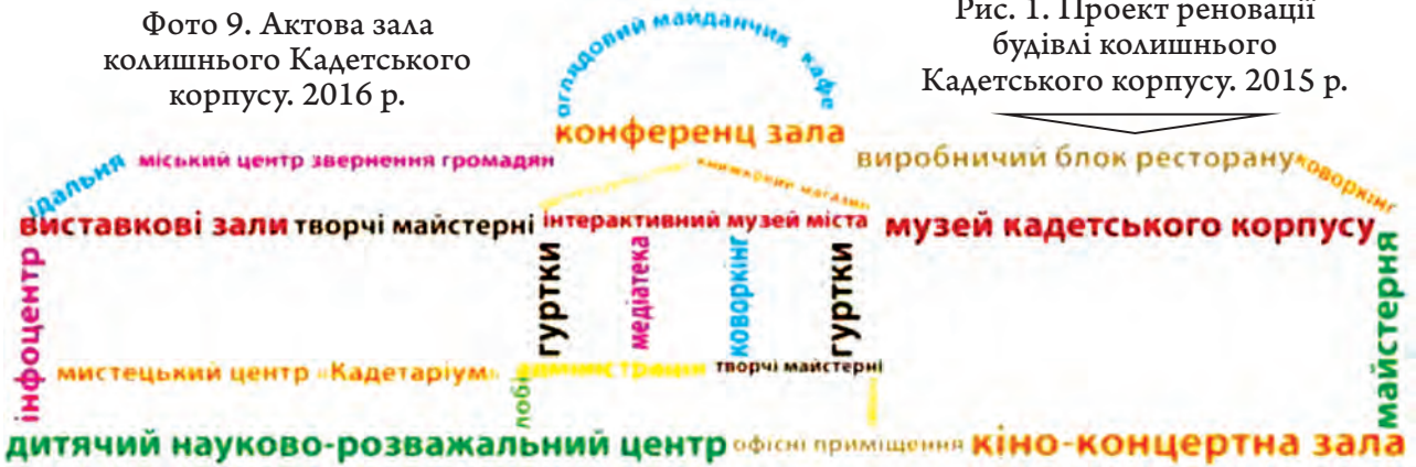
Рис. 1. Проект реновації будівлі колишнього Кадетського корпусу. 2015 р.