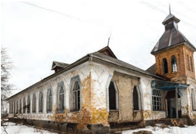
Фото 13. Школа в с. Харсіки Чорнухинського району. 2016 р.

виділяються. Для включення шкіл до вказаного реєстру, спочатку їх потрібно описати, але навіть на це не виділяються кошти. Більше п'яти років долею архітектурних пам'яток із віковою історією опікується відома журналістка й громадська діячка О. Герасим'юк, завдяки наполегливості якої перші шість шкіл (по три в Лохвицькому районі Полтавської та Роменському районі Сумської областей) у 2013 р. були внесені до переліку щойно виявлених об'єктів культурної спадщини. Навколо ідеї збереження унікальних зразків українського архітектурного модерну об'єдналися архітектори, журналісти,