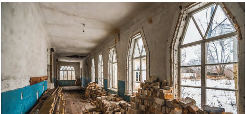
Фото 14. Інтер'єр Харсіцької школи Чорнухинського району. 2016 р. (з сайту «Школи Лохвицького земства»).