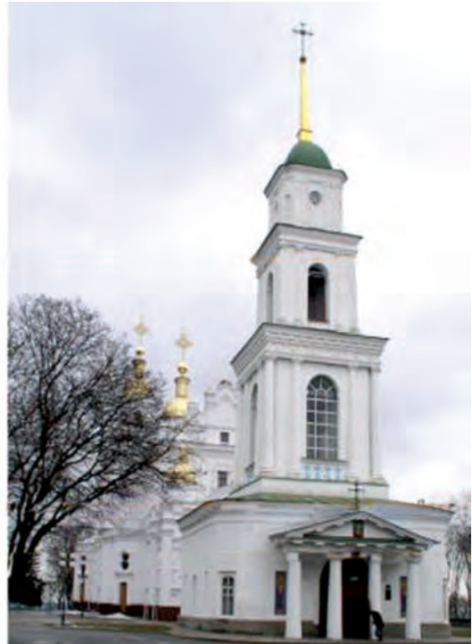
Фото 17. Історичний та сучасний вигляд Свято-Успенського собору у Полтаві, опубліковано В. Трегубовим у книзі «История и современные «обломы» полтавской архитектурной классики». Полтава, 2006.