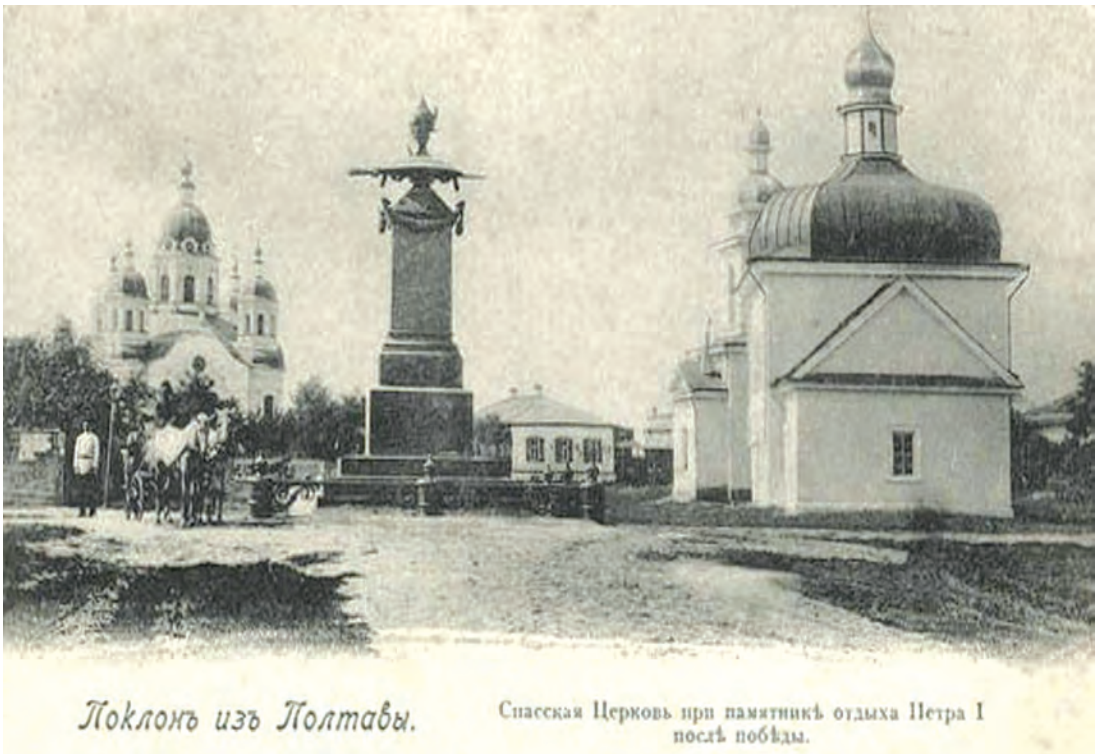
Поклонъ изъ Полтавы.

Однак вже на початку XXI ст., а саме 2002 р. Полтавський міськвиконком прийняв рішення про відтворення комплексу Спаської церкви. Відповідно до цього рішення був розроблений проект спорудження історичної споруди дзвіниці у її первісних формах та розмірах. Але потім повторилася ситуація, подібна до Свято-Успенського собору: восени 2004 р. за рішенням міської влади на місці історичної дзвіниці поспіхом побудували за зовсім іншим проектом дзвіницю маленького об'єму, аргументуючи це відсутністю коштів 35 . Після чергових місцевих