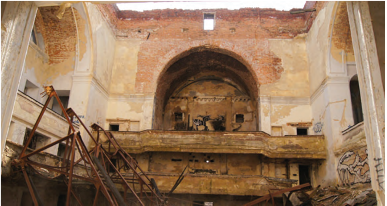
Фото 9. Актова зала колишнього Кадетського корпусу. 2016 р.

Сучасний стан Кадетського корпусу яскраво відображений у 30-хвилинному фільмі-відчутті «Крізь порожнечу», створеному молодими полтавськими документалістами, які ще пам'ятають величну будівлю неущожденною 16 . Ініціативною групою розроблено проект його реновації у якості культурно-художнього центру для творчої молоді з виставковими, танцювальними та конференц-залами, офісними приміщеннями 17 (рис. 1). Для