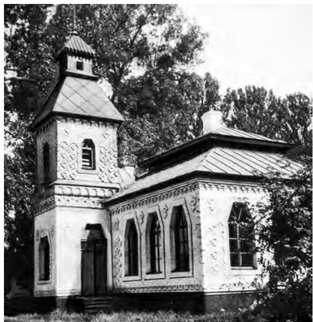
Фото 12. Школа у с. Западінці Лохвицького району, опубліковане В. Чепеликом у статті «Пионер сельской архитектуры»

Вцілілі будівлі потребують термінових ремонтних робіт – протікають дахи, руйнуються нижні яруси облицювання й каркасу. Переважна більшість їх не внесена до реєстру пам'яток культурної спадщини й не охороняються державою, тому з бюджету кошти на їхній ремонт не