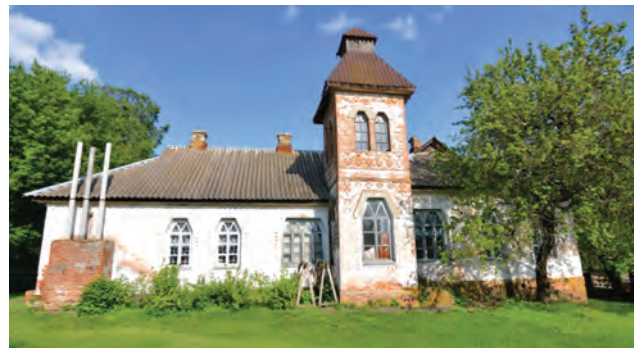
Фото 11. Школа у с. Чорнухи Чорнухинського району. 2016 р.