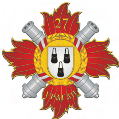
Іл. 7. Пам'ятний нагрудний знак „27 Сумський реактивний артилерійський полк”