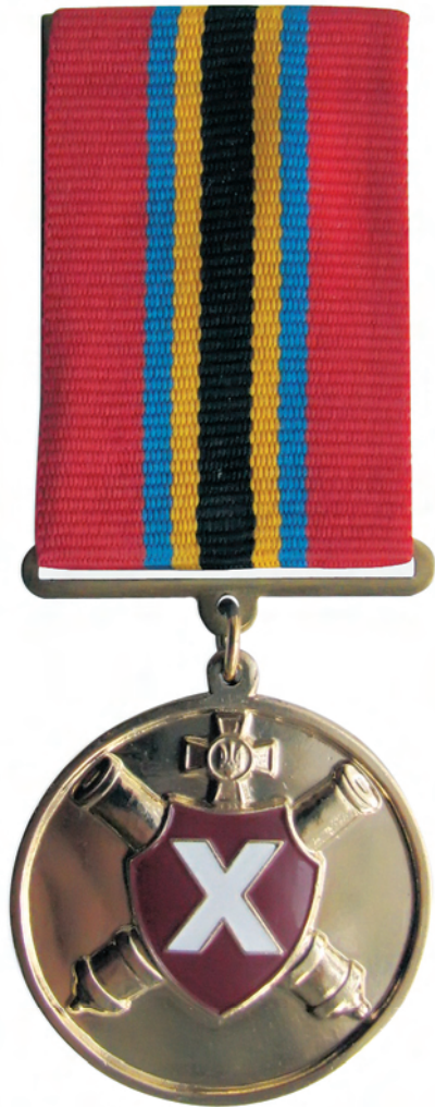
Іл. 2. Пам'ятний нагрудний знак „10 років ракетним військам і артилерії Збройних Сил України”

Бойові прапори, виготовлені за цим зразком, почали вручати ще до його офіційного затвердження. Так, у 2003 році такий Бойовий Прапор отримав Військовий двічі орден Червоного Прапора інститут артилерії імені Богдана Хмельницького при Сумському державному університеті. 2006 року Бойові прапори вручили 11-й окремій гвардійській артилерійській Київській орденів Червоного Прапора і Богдана Хмельницького бригаді та 15-му гвардійському реактивному артилерійському Київському орденів Леніна, Червоного Прапора, Богдана Хмельницького і Олександра Невського полку, 2007 – 26-й артилерійській бригаді. Емблеми ракетних