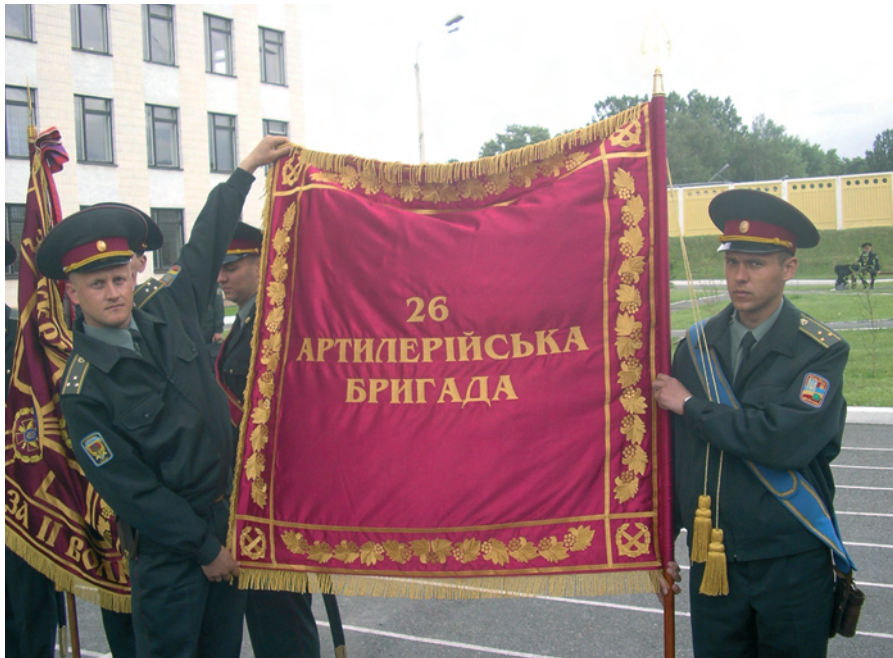
Іл. 3. Зворотний бік Бойового Прапора 26-ї артилерійської бригади

вручено 14 вересня 2008 року 107-му реактивному артилерійському Ленінградському ордену Кутузова полку.