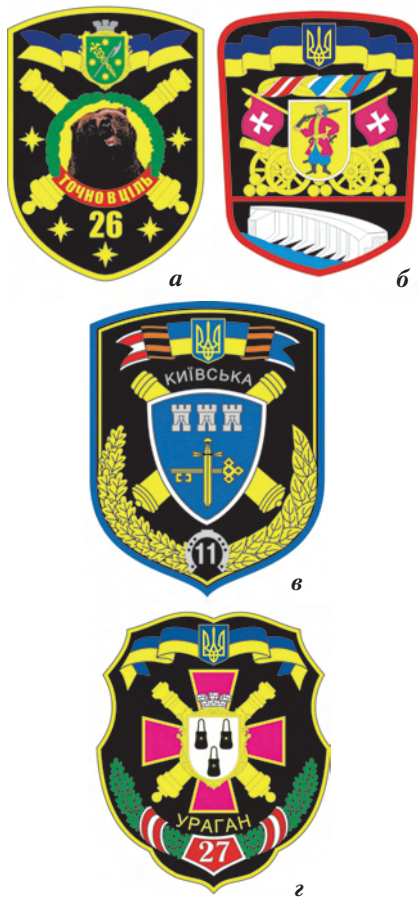
Іл. 4. Наркуавні емблеми військових частин ракетних військ і артилерії, затверджені начальником Генерального штабу – Головнокомандувачем ЗС України: а) 26-та Бердичівська артилерійська бригада; б) 55-та Запорізька окрема артилерійська Будапештська орденів Червоного Прапора, Богдана Хмельницького і Олександра Невського бригада; в) 11-та Тернопільська окрема гвардійська артилерійська Київська орденів Червоного Прапора і Богдана Хмельницького бригада; г) 27-й Сумський реактивний артилерійський полк

ми живучими. Червоний колір канта щита наркуавної емблеми 55-ї окремої артилерійської бригади відображає колір артилерії у збройних силах українських державних утворень 1917 – 1920 років, синій і золотий (жовтий) канти щита наркуавної емблеми 11-ї окремої артилерійської бригади відтворюють кольори Державного Прапора України. Натомість канти щитів наркуавних емблем 26-ї артилерійської бригади і 27-го реактивного артилерійського полку символічного значення не мають. Приналежність до артилерії засвідчують схрещені гарматні стволи, лише в наркуавній емблемі 55-ї окремої артилерійської бригади присутнє зображення старовинних гармат з ядрами. В усіх наркуавних емблемах застосовується символіка міст чи місцевостей, де дислокуються частини. Так, на наркуавних емблемах 26-ї артилерійської бригади і 27-го реактивного артилерійського полку присутні міські герби відповідно Бердичева і Сум, на наркуавній емблемі 11-ї окремої артилерійської бригади – герб Тернопільської області. Водночас територіальне розташування 55-ї окремої артилерійської бригади відбивають герб Війська Запорозького (козак з самопалом) і стилізоване зображення Запорізької греблі. З гербом Війська Запорозького вдало поєднуються козацькі прапори, що свідчать про успадкування військовиками бригади кращих традицій запорозького лицарства. У наркуавних емблемах частин, які зберігають присвоєні за часів СРСР державні нагороди та