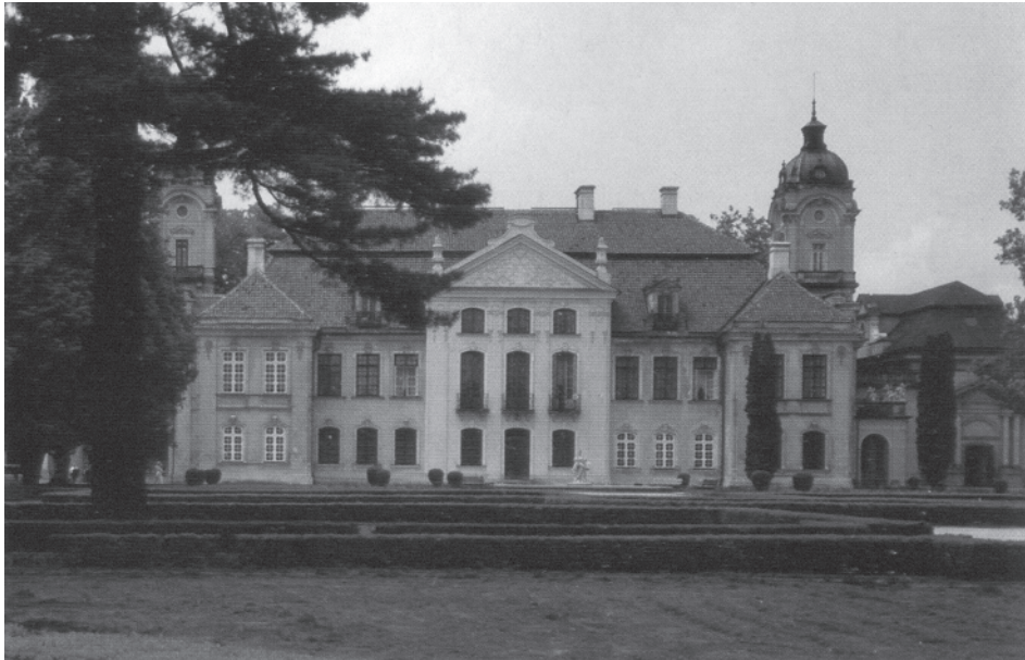
Східний фасад палацу. Сучасний вигляд

З 1917 р. граф Адам Міхал Замойський не брав участі в політичному житті незалежної Польщі. Він не користувався популярністю через близькість до російського імператорського Двору, проте обіймав численні громадські посади, був співорганізатором плебісциту у Вармії (1920).