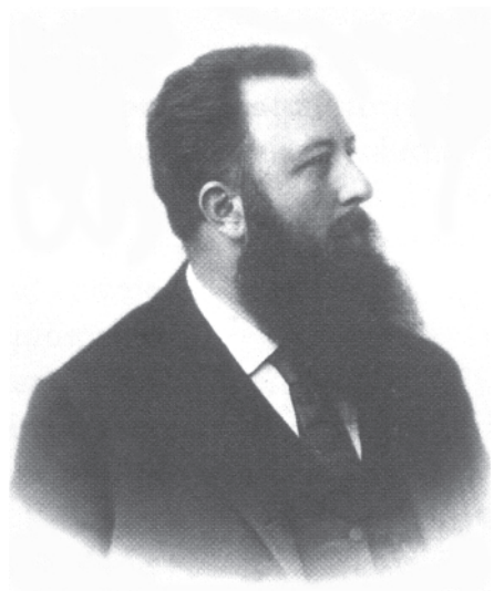
Ян Замойський. Фото

маєтність діставала назву “заповѣд- ное наследственное імѣніе”* або “вре- менно-заповѣдное імѣніе” (ст. 395), що визнавалося власністю всього роду, а не його окремих представ- ників (ст. 485). Так сталося з Коз- ловецьким ключем Замойських. От- же, статус “заказної маєтності” пе- редбачав невідчужуваність, неподіль- ність маєтку, заборону на продаж і спадкоємність старшим сином або іншим чоловіком з роду. Територія такого маєтку повинна була стано- вити не менше 5 тис. і не переви- щувати 100 тис. десятин або ж да- вати середньорічний дохід не мен- ше 6 тис. і не більше 200 тис. руб. (ст. 470). Козловецька заказна маєт- ність відповідала цим вимогам. Її