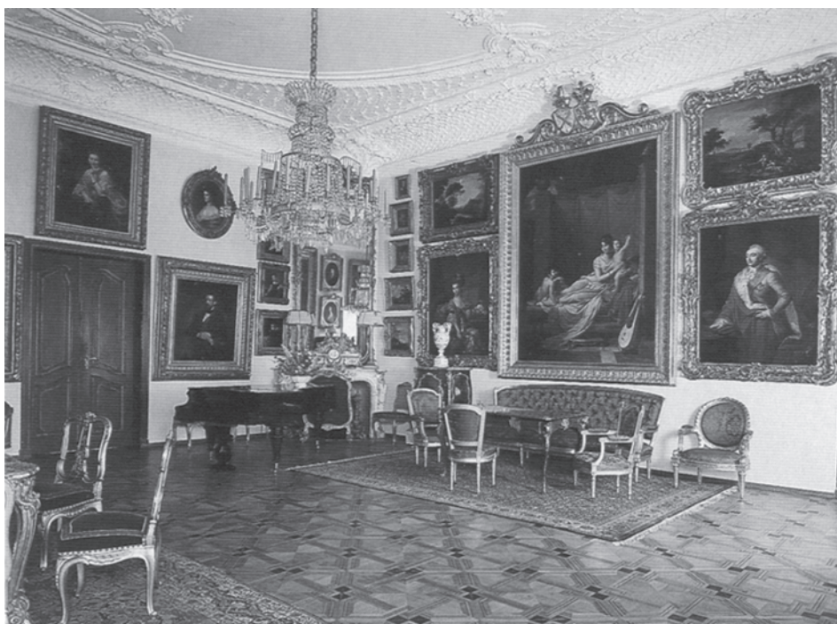
Білий салон. Музейна експозиція