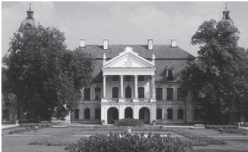
Західний фасад палацу. Сучасний вигляд