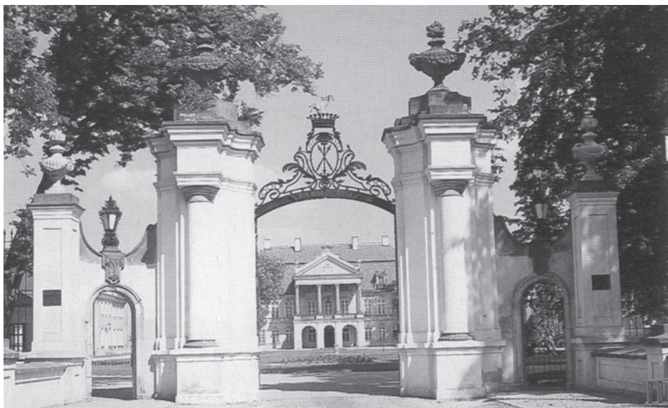
В'їзна брама палацу. 80-ті роки XIX ст. Сучасний вигляд