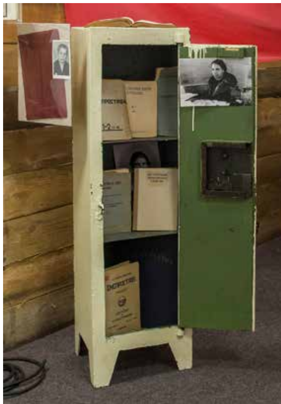
Ілюстрація 14. Експонат-символ «металевий сейф»

На будівництві ДніпроГЕСу відбувалось конструювання нових біографічних проектів та сценаріїв життя жінок. Задекларована громадянська рівність незалежно від статі, підкріплена рівними юридичними правами в усіх сферах соціального й виробничого життя, відкривала нові обрії для жінок в кар'єрному плані. Цьому повною мірою сприяв культ людей праці,