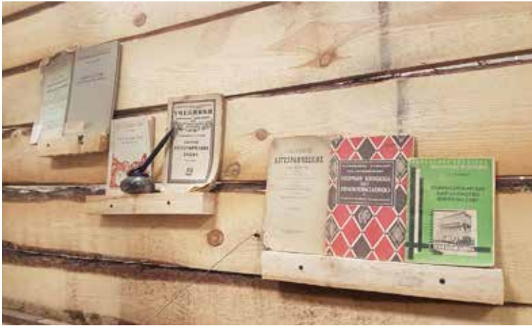
Ілюстрація 17. Натюрморт-символ «полічка з підручниками»

кривається за допомогою невеличкої полицки з підручниками, чорнильницею та ручкою, які є натюрмортом-символом (ілюстр. 17).