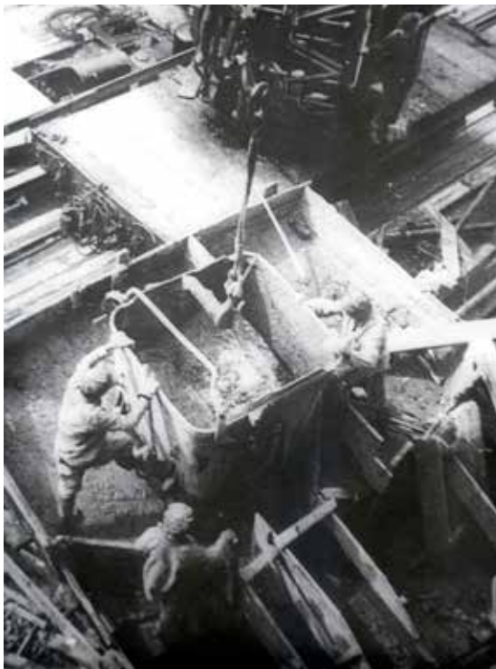
Ілюстрація 31. Роботи з бетонування, Дніпробуд (НДФ-2876)

тельно простругані опалубки, які необхідно було добре підготувати.