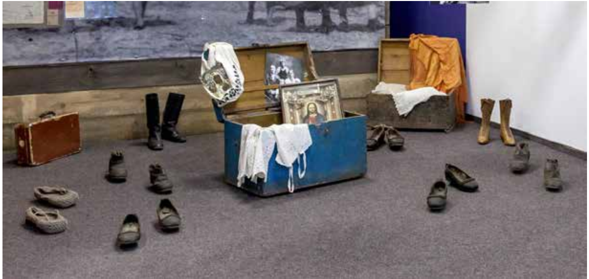
Ілюстрація 7. Натюрморти зі скринями і масова хода

Для підтримки головної теми розділу – жінки, які за різних обставин потрапили на будівництво з метою заробітку, – використані оригінальні предмети, що відносяться до середовищних: розрахункові книжки; табельні жетони робітників Дніпробуду; гроші того часу (копійки та карбованці) (ілюстр. 6).