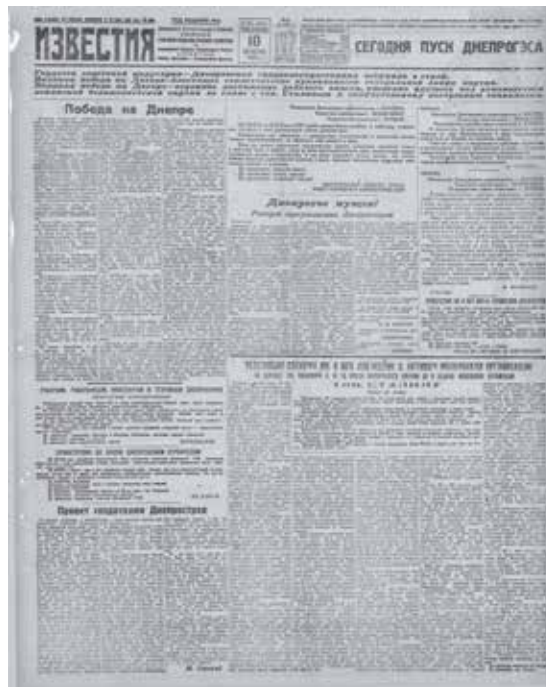
Ілюстрація 1. Газета «Известия» №281 від 10.10.1932 р. (15270/П-10040)

На жаль, поза увагою багатьох науковців та митців залишилась цікава та багатогранна тема «жінка на Дніпробуді». Ця ситуація не є виключенням. Сьогодні, не дивлячись на активні дослідження, присвячені участі жінок в суспільно-політичному та економічному житті країни, безліч аспектів складного клубка суперечностей під назвою «жінка і праця в СРСР» досі чекають свого зоряного часу. Femina sovetica вислизає, ховаючи своє обличчя 2 . Запорізька історична фемінологія часів будівництва ДніпроГЕСу також залишається «білою плямою» в українській гуманітаристиці, в тому числі музе-