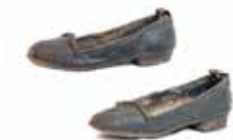
Туфлі жіночі, кінець XIX–початок XX ст.

Шкіра, метал, фабричне виробництво, 255*95 мм