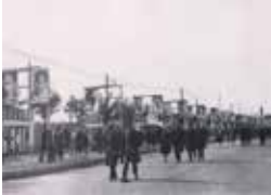
Фото. Загальний вигляд алеї ударників, 1932 р.

Автор невідомий Фотопапір, друк, 180*240 мм акт №223 від 21.09.1976 НЗХ НДФ-2729