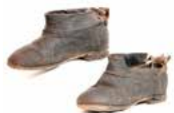
Черевики жіночі, кінець XIX–початок XX ст.