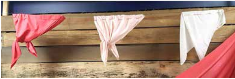
Ілюстрація 3. Концепт «хустки на мотузці»

тему, задану концептом, створюють загальну атмосферу розділу, його предметне наповнення.