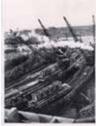
Фото. Загальний вид будівництва ДніпроГЕСу. Робота підйомних кранів, 1929 р.

Автор невідомий Фотопапір, друк, 180*240 мм акт №223 від 21.09.1976 НЗХ НДФ-2723