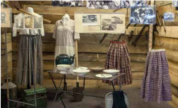
Ілюстрація 9. Натюрморт-концепт «накритий стіл»