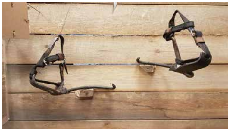
Ілюстрація 16. Експонат-маркер «кігті верхолазні»