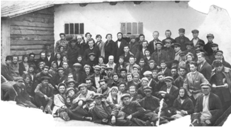
Ілюстрація 22. Група курсантів ЦІП (Центральний інститут праці), Дніпробуд, 1930 р. (НДФ-3307)