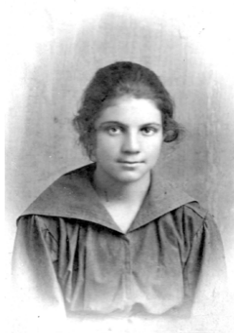
Ілюстрація 37. Фото Шуламис Зільберштейн, початок ХХ ст. (6792/ФН-676)