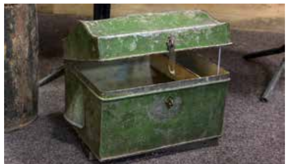
Ілюстрація 8. Скриня паровозного машиніста С. Кішинського (28806/М-2467)