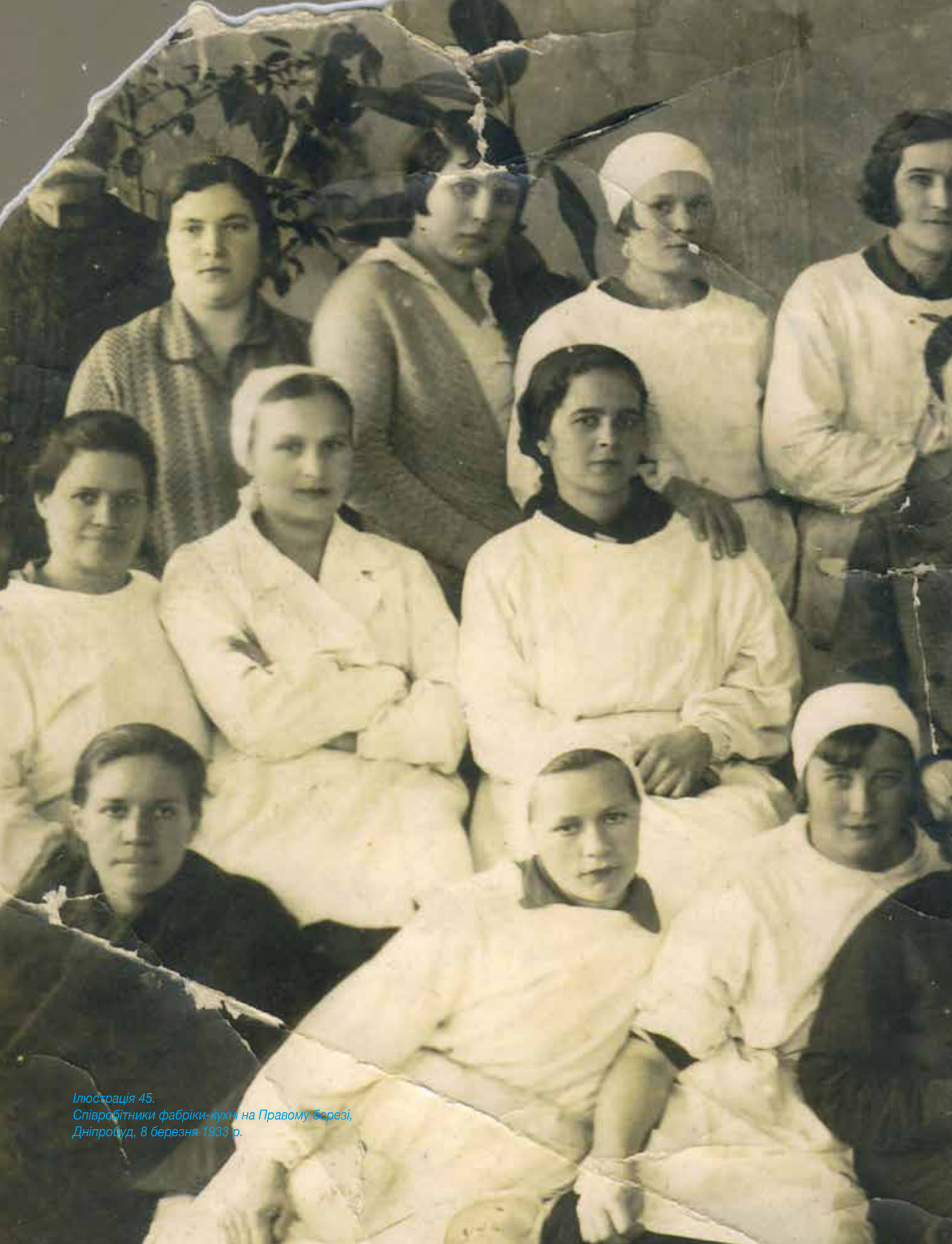
Ілюстрація 45. Співробітники фабрики-кухні на Правому березі, Дніпробуд, 8 березня 1933 р.