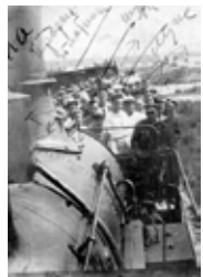
Фото. Робітники Дніпробуду повертаються до дому після робіт на прориві греблі, 1930 р.

Матеріали з архіву Євдокії Андріївни Худякової (1906-?), яка працювала на будівництві і відбудові ДніпроГЕС