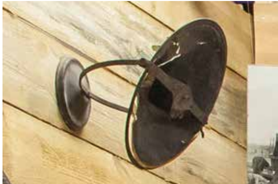
Ілюстрація 12. Експонат-маркер «електромагнітний абонентський гучномовець»

що майже стали нормою трудового повсякдення Країни Рад. Радісне «Єсть!» і завзяте «Дайош!» – така загальна тональність експозиційного розділу «Марія», який присвячений ударницям за ідею та за обставинами. Цей сюжет підкреслюється за допомогою експоната-маркера – електромагнітного абонентського гучномовця, відомого під назвою «Рекорд», «Пролетар», «Зоря», «Піонер» (в народі його називали словом «репродуктор», «радіо» або «тарілка», навіть, «брехунець») (ілюстр. 12). У свідомості старшого покоління з такими репродукторами нерозривно пов'язані бадьорі трудові рапорти 30-х років, які увійшли в історію країни як час небувалих виробничих досягнень, і назва «Рекорд» якнайкраще відображало дух цієї епохи.