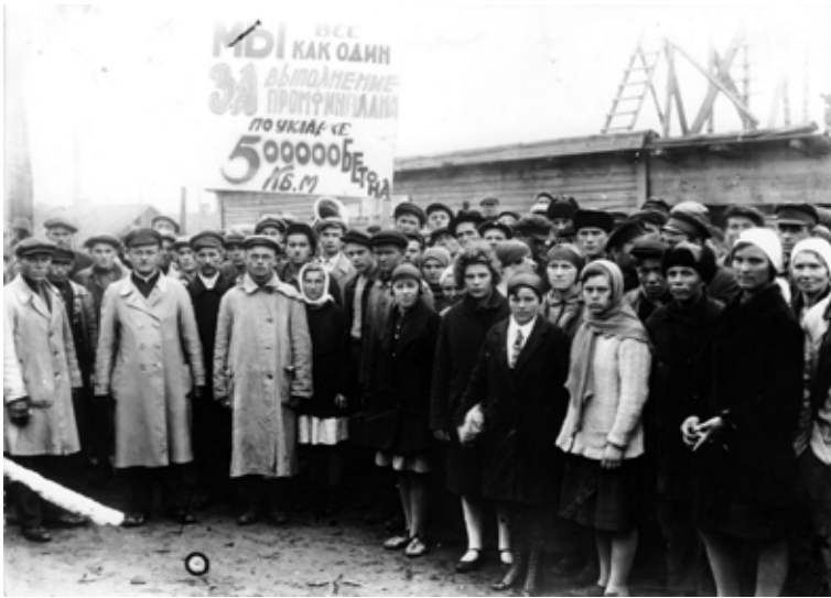
Ілюстрація 34. Група бетонувальників Дніпробуду, 1930-і роки (НДФ-2655)

Дівчата-ударниці проти плану 100 кубометрів уклали по 130, перемагаючи дванадцятку змішану бригаду 25 .