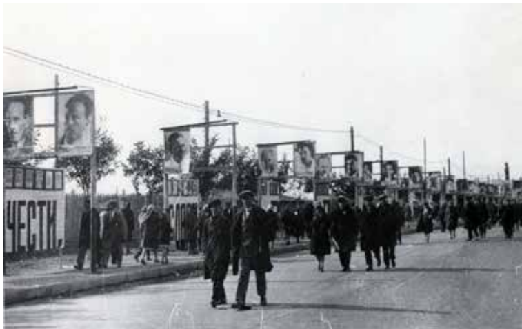
Ілюстрація 44. Загальний вигляд алеї ударників, 1932 р. (НДФ-2201)

матеріально. В експозиції представлено фото «Алея ударників»: 1930-й рік, вздовж проспекту встановлено великі портрети чоловіків та жінок – ентузіастів і перевиконувачів планових показників (ілюстр. 44). Поруч експонуються «Грамоти ударника», з яких видно, що подібне заохочення проводилось систематично. Матеріальне і грошове винагородження демонструє «Книжка ударника» 21 , в якій зазначено преміювання у вигляді теплої ковдри, відрізу на костюм.