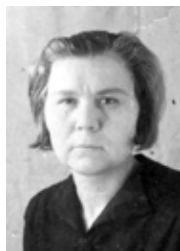
1944 р.