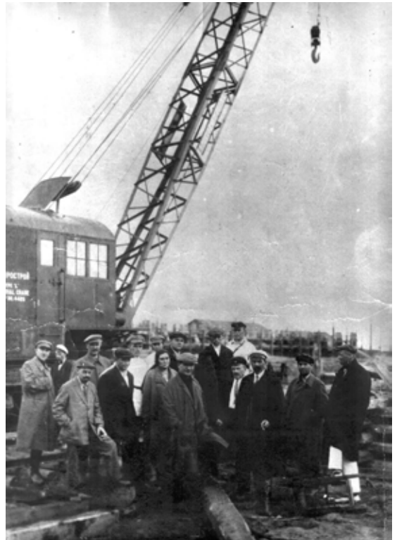
Ілюстрація 39. Огляд перемички правого берега, на фоні підйомного крану. 1927 р. (17847/ФН-2150)