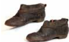
Черевики жіночі, кінець XIX–початок XX ст.