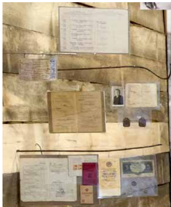
Ілюстрація 6. Тема заробітку підтримана комплексом середовищних експонатів