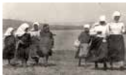
Фото. Мешканці с. Вознесенівка йдуть на будівництво Дніпробуду, 1927-1932-і роки

Автор невідомий. Фотопапір, друк, 90*140 мм акт №32 від 25.02.1977 НЗХ 6024/ФН-471