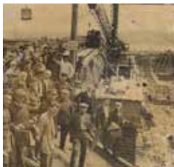
Фото. Учасники мітингу з приводу відкриття ДніпроГЕС, 10.10.1932 р.

Папір, друк, 437*660 мм акт №260 від 02.09.1980 НЗХ 15268/П-10039