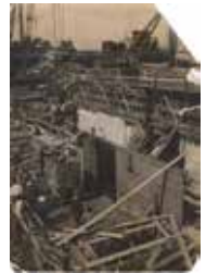
Фото. Дніпробуд 22.08.1929 р.

Автор невідомий Фотопапір, друк, 180*240 мм акт №127 від 21.06.1976 НЗХ НДФ-2191