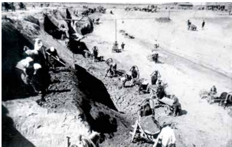
Ілюстрація 2. Грабарі на початку будівництва ДніпроГЕСу, 1927-1928 роки Автор невідомий (НДФ-3314)