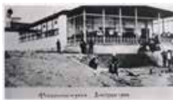
Фотокопія. «Фабрика-кухня Дніпробуду», 1930 р. Автор невідомий Фотопапір, 130*180 мм акт №32 від 25.02.1977 НЗХ НДФ-3326