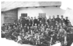
Фото. Група курсантів ЦІП (Центральний інститут праці), Дніпробуд, 1930 р.

Фотопапір, друк, 120*170 мм акт №75 від 17.04.1981 НЗХ 17846/ФН-2149