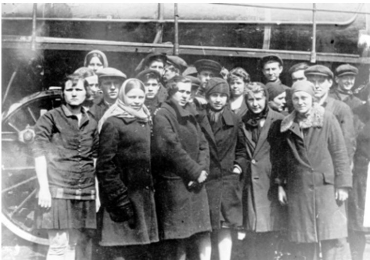
Ілюстрація 23. Комсомольська бригада дострокового ремонту паровозу серії «ЄХ» на Дніпробуді, 1931-32 роки (НДФ-2654)