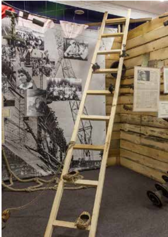
Ілюстрація 15. Композиція-концепт «сходи»

мосфери гнітучої повсякденності в місто, до достатку і кар'єри 33 .