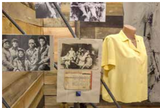
Ілюстрація 13. Меморіальний комплекс Ф. А. Пономаренко