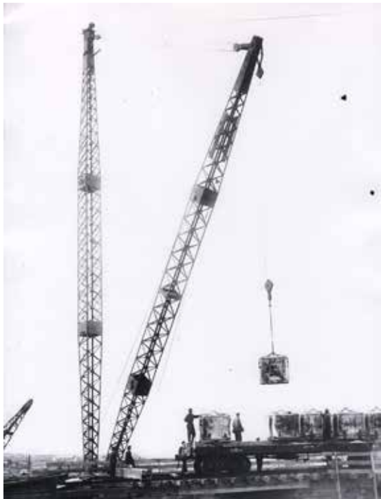
Ілюстрація 30. Навантаження бетону на платформу, Дніпробуд, 1929 р. (НДФ-2723)