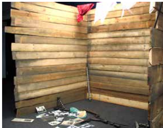
Ілюстрація 4. Головний експозиційний образ (концепт) виставки – блок для бетонування

Головним експозиційним образом (концептом) виставки є блок для бетонування: жінки ДніпроГЕСу були відомі всій країні саме як бетонниці; бетонницею працювала героїня, яка дала ім'я виставці – Харитина. Блок – не тільки конструкція, що утворює границі експозиційного простору (ілюстр. 4). Це – метафора. Блок для бетонування будувався за допомогою щитів опалубки – дерев'яної ФОРМИ, що наповню-