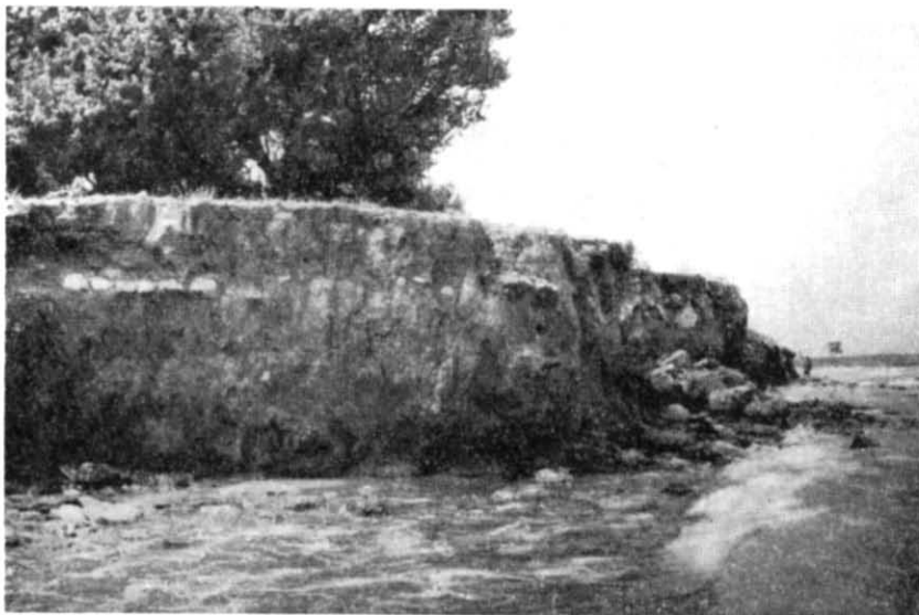
Рис. 2. Городище Маслини в ур. Чеголтай поблизу с. Северного.