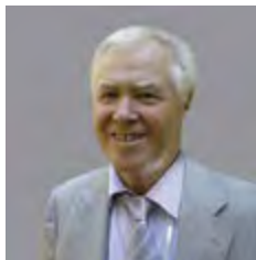
Директор Інституту психології ім. Г.С. Костюка Національної АПН України, доктор психологічних наук, професор Сергій МАКСИМЕНКО

За даними «Центру цифрових технологій майбутнього», 25% дорослих стурбовані тим, що їхні діти проводять в інтернеті забагато часу, 53% вважають кіберзлочинність реальною загрозою, а 63% висловлюють схвильованість через спілкування їхніх дітей у віртуальних співтовариствах, що лякають сучасних батьків так само, як попередні покоління бачили загрозу в негативному впливі «вулиці» на дітей. При цьому 46% користувачів всесвітньої мережі, які належать до молодіжної аудиторії, особисто зустрічалися зі своїми віртуальними знайомими. Для когось інтернет може бути єдиним джерелом спілкування, але слід враховувати те, що віртуальна реальність ніколи не замінить гармонійних взаємин і повноцінного спілкування між людьми.