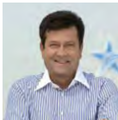
Президент «Київстар» Ігор ЛИТОВЧЕНКО

Наше завдання як дорослих і батьків - навчити дітей використовувати інтернет правильно. Так само, як ми вчимо дітей безпеки в реальному житті - на вулиці та дорозі, нам необхідно навчити їх безпечній поведінці у віртуальному житті - в інтернеті. Цей посібник покликаний допомогти батькам впоратися з цим завданням. У ньому просто та зрозуміло викладені основні правила та рекомендації, як створити у себе вдома територію безпечного інтернету.