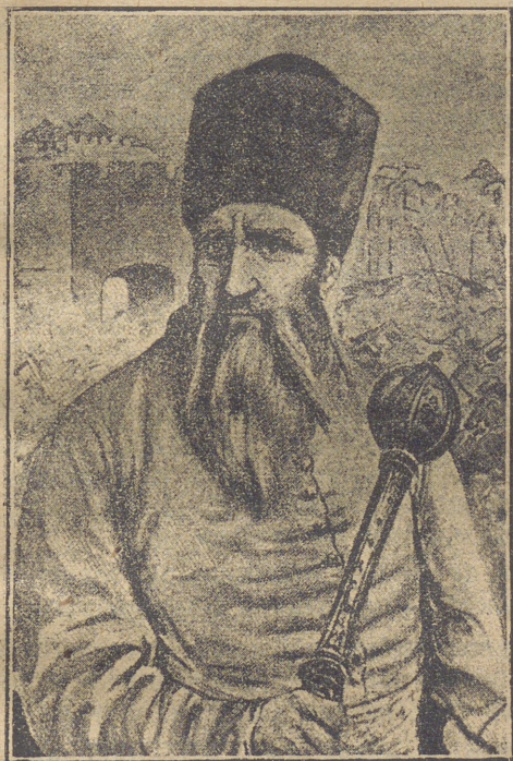
Гетьман Петро-Конашевич Сагайдачний