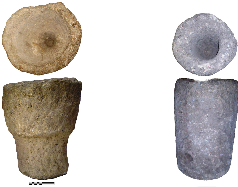
Рис. 1, 3

Рис. 9. Ступи вапнякові. НІАЗ “Ольвія”.Р