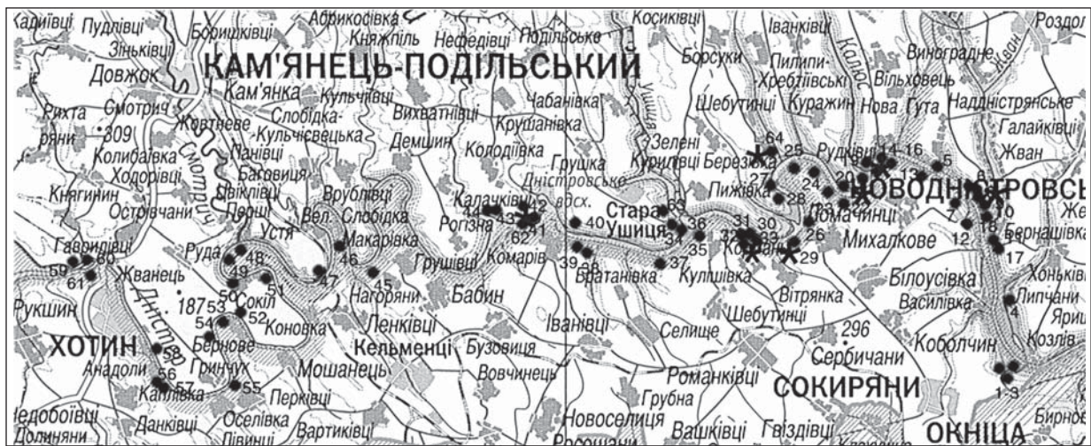
Рис. 1. Мапа пам'яток трипільської культури, виявлених Середньодністровською експедицією: I — поселення трипільської культури, II — поселення-майстерні; пам'ятки: 1—3 — Волошкове; 4 — Липчани; Березівський хутір; 5 — пох. 48, 6 — пох. 39; ГЕС, правий берег: 7 — пох. 15, 12 — пох. 13, 13 — пох. 16; ГЕС, лівий берег: 8 — пох. 12, 9 — пох. 11, 10 — пох. 10, 11 — пох. 9; 14 — Ломачинці—Вишнева, пох. 17, 15 — I і II, пох. 18, 16 — пох. 19; 17, 18 — Бернашівка; 19 — Малий Берег, пох. 24; 20 — Калюс, пох. 26; 21 — Великий Берег, пох. 29; 22 — Галиця, пох. 104; Непоротове: 23 — пох. 22, 24 — пох. 38, 25 — пох. 34; 26 — Михалків, пох. 50; Лоївці: 27 — пох. 44, 28 — пох. 42; 29 — Михалків—Гришівський Яр, пох. 52; Кормань: 30 — пох. 56, 31 — пох. 58, 32 — пох. 4; 33 — пох. 83; 35 — пох. 79; Стара Ушиця: 34 — пох. 54, 36 — пох. 71; Молодове: 37 — пох. 78, 38 — пох. 76; 39 — Шеїн, пох. 75; 40 — Наддністрянська, пох. 80; 41 — Бакота, пох. 85; 42 — Теремці, пох. 88; 43 — Студенія; 44 — Біла Гора (Студенія); 45 — Нагоряни, пох. 103; 46 — Велика Слобідка, пох. 102; 47 — Велика Слобідка—Дубина, пох. 109; Вороновія: 48 — пох. 7, 49 — пох. 125; 50 — Соклі—Шовб, пох. 132; 51 — Соклі-Плантація, пох. 130; 52 — Слобідка Малиновецька, пох. 152; 53 — Бернове—Малинки, пох. 144; 54 — Малинівці, пох. 150; 55 — Оселівка, пох. 142; 56 — Дарабани—Замчисько; 57 — Дарабани—Вал, пох. 139; 58 — Бабшин, пох. 157; Ісаківці: 59 — пох. 165, 60 — пох. 162; 61 — Атаки; 62 — Бакота, пох. 3; 63 — Стара Ушиця, пох. 1

Загалом у колекціях Середньодністровської експедиції номенклатуру знахідок, що свідчать про кременеву індустрію трипільської культури, можна подати як відходи первинної та вторинної обробки кременю, заготовки, напівфабрикати та готові вироби, зокрема сокири (рис. 2, 1—9), долота, серпи, ножі, свердла, скребачки, вістря стріл (рис. 2, 16) та дротики. Привертають увагу пункти, де зосереджено багато знахідок, що вказують на первинну обробку кременю, а можливо, і його видобуток, а також на наявність поселень-майстерень.