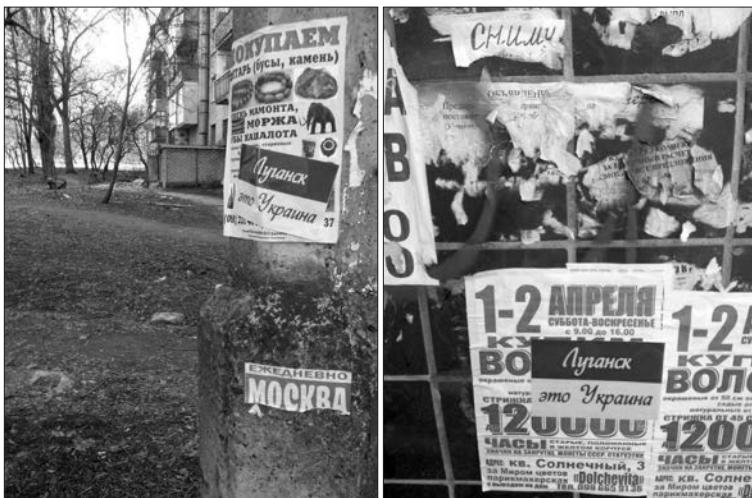
Листівки, розклеїні Анастасією Мухіною у Луганську

ли, і наступну добу також. А тоді повезли до моєї квартири знову й допитували ще й там. Погрожували повісити мене на дверях, якщо я не здам своїх «начальників»: це були четверо людей зі зброєю. І підвісили б певно, але їм подзвонили, щось сказали, і вони стишили агресію, але продовжили допит. У квартирі після них — наче цунамі пройшло. Ввечері, після чергового допиту в «ОБОП», мене повезли до слідчого й тоді кинули до «КПЗ» Ленінського району міста. А через три дні був суд і мене арештували на 2 місяці у в'язниці. І кожні 2 місяці продовжувався термін мого утримання.