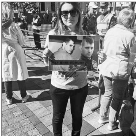
Дружина Віка на акції у підтримку військовополонених

Я намагався не піддаватися емоціям, щоб мною не заволоділа депресія. Це було б найгірше. Тримався з усіх сил, навіть коли минав черговий обмін без мене. Я точно знав,