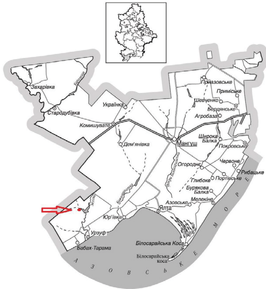
Рис. 3. Схема розташування археологічних об'єктів – поселень «Урзуф-1» та «Урзуф-4» на мапі Мангушської ОТГ Маріупольського району Донецької обл.