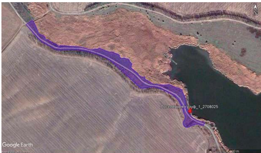
Рис. 5. Схема розташування археологічного об'єкту поселення «Урзуф-1» за супутниковою картою Google Maps

ведення товарного сільськогосподарського виробництва (кадастровий № 1423985500:03:000:2606) Урзуфської сільської ради Мангушського р-ну Донецької обл. за межами населених пунктів, було проведено натурне обстеження об'єктів археологічної спадщини. При цьому було встановлено наступне. На території ділянки за даними обмеженого натурального археологічного обстеження пам'яток археології, Публічної кадастрової карти та планово-картографічного матеріалу встановлено наявність археологічного об'єкта – поселення (рис. 4; 6).