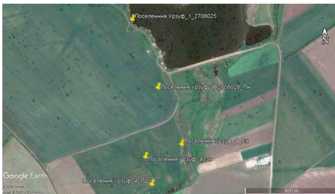
Рис. 6. Схема розташування археологічного об'єкту поселення «Урзуф-4» за супутниковою картою Google Maps