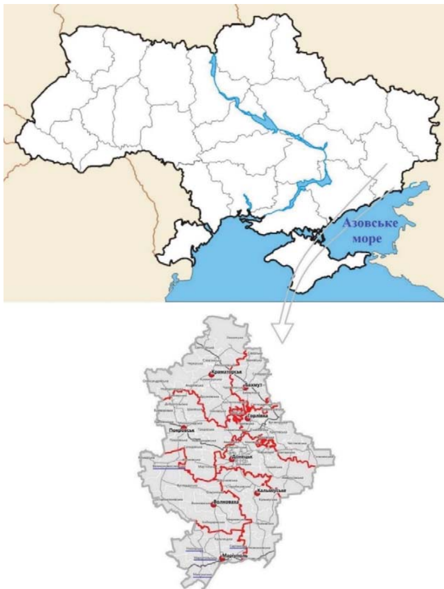
Рис. 1. Схема розташування досліджених ділянок у Північному Приазов'ї на території Маріупольського та Великоновосілківського районів Донецької обл.

У 2021 р. АЕ МДУ під час проведення розвідки були виконані натурні обстеження території на півдні та південному заході Донецької області з метою інвентаризації відомих на даний час археологічних об'єктів та визначення режимів використання території зони охорони археологічного культурного шару. Мета передбачала вирішення завдань створення сприятливих умов для збереження національної історико-культурної спадщини та підвищення суспільної відповідальності за стан охорони й збереження пам'яток археології.