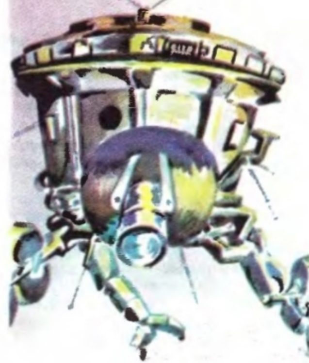
Малюнки Г. КУПЦЕВОЇ

Удалов теж не марнував часу. Він спочатку намалював у повітрі коло й трикутник, звернувся так до спільних для всіх розум-