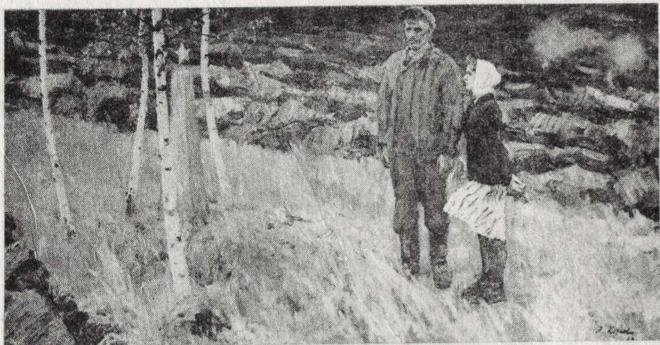
Э. Козлов. «Родная земля». Х., л.