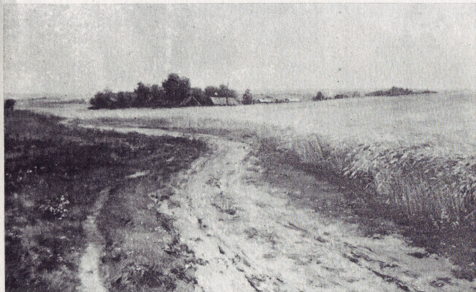
В. Коненко. «Рожь колосится». X., м.