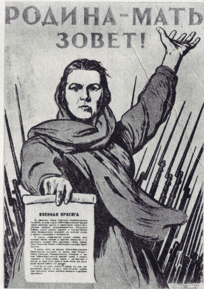
И. Тондзе. «Родина-мать зовет». Плакат. Гуашь, темпера, карандаш.