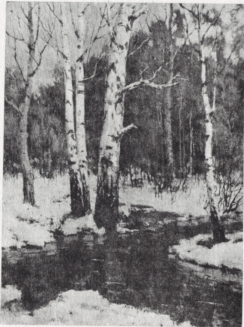
В. Коненко. «Пробуждение». Х., м.