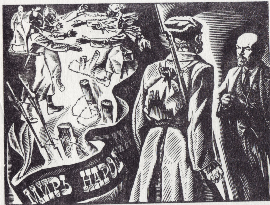
Ю. Рязанов. «Мир народам». Цветная линогравюра.