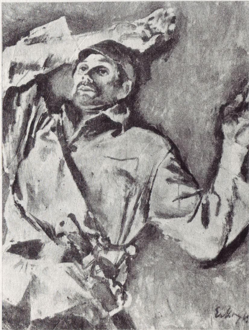
Е. Мойсеенко. «Черешня». Х., м. Эскиз к картине.