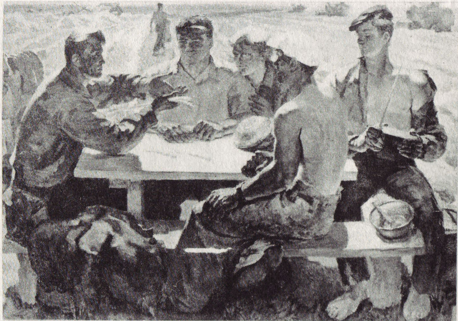
Ю. Ятченко. «Хлеборобы». Х., м.