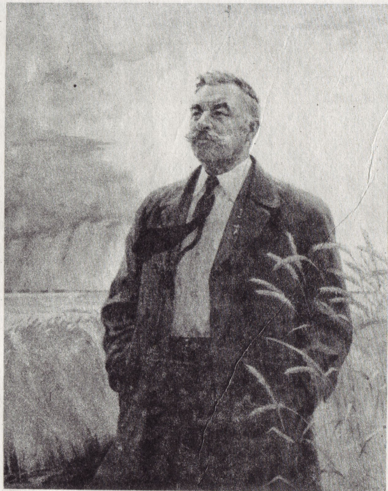
В. Лапин. «Портрет Н. Н. Рябошапки — Героя Социалистического Труда». Х., м.