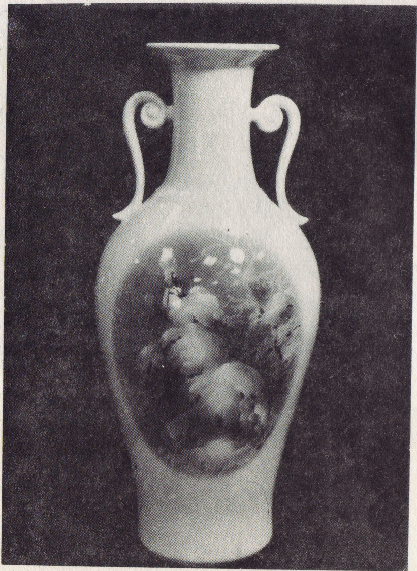
В. Жбанов. Ваза «Зима». Фарфор.