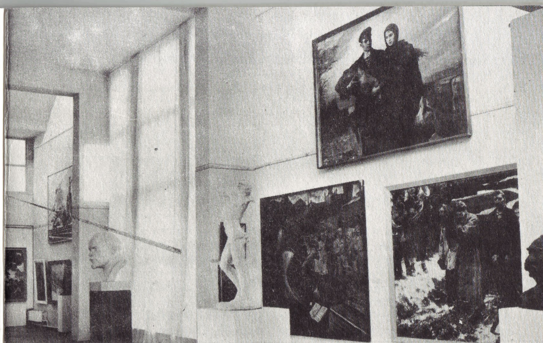
Фрагмент большого зала.

республиканском смотре народных музеев, а в 1987 году — дипломом III степени ВДНХ УССР.