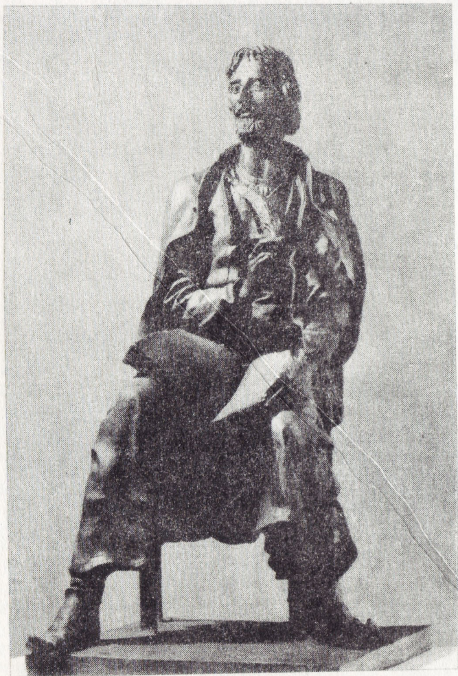
В. Горевой. «Шота Руставели». Бронза.