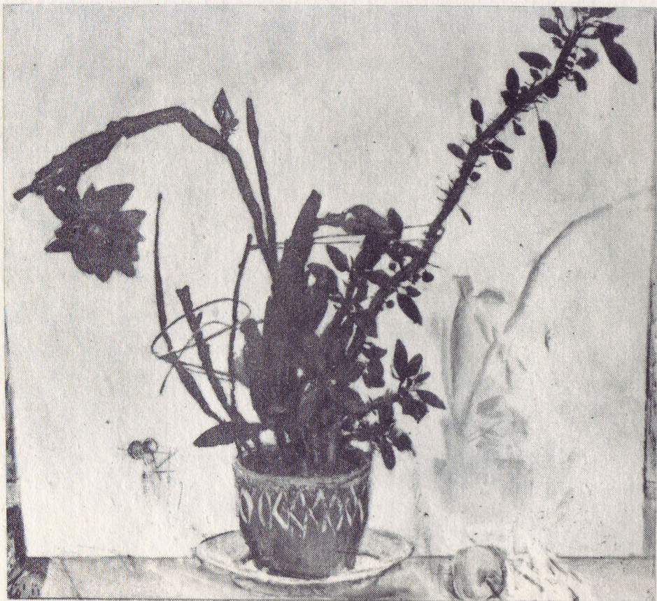
Е. Мойсеенко. Натюрморт с кактусом». Х., м.