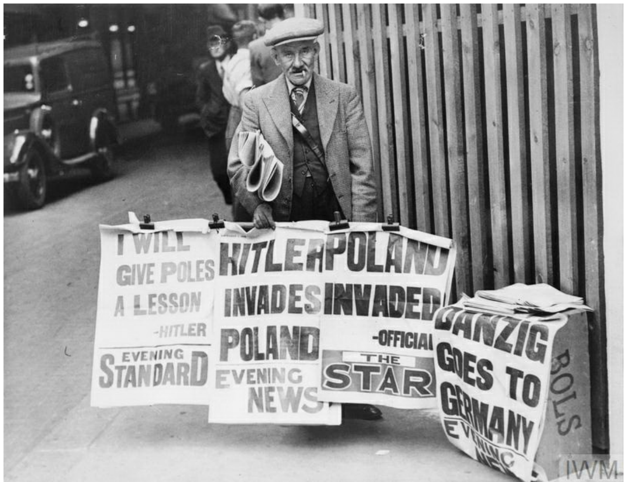
Британський газетяр із заголовками про напад Німеччини на Польщу.

Аналізуючи події тих часів, важливо розуміти, що більшу частину світу наприкінці 1930-х рр. складали колоніальні імперії європейських метрополій (Великої Британії, Франції, Бельгії, Нідерландів, Португалії, Іспанії, Італії), внутрішніх імперій (СРСР) і глобальних економічних наддержав (США). Світовому порядку, встановленому після Першої світової війни (Версальсько-Вашингтонська система) кинули виклик держави, не вдоволені національним приниженням і територіальними змінами, на чолі з нацистською Німеччиною. Німецькими союзниками із часом стали фашистська Італія, яка прагнула панувати в Середземномор'ї й Північній Африці, і мілітаристська Японія з паназійською ідеологією "звільнення" від білого ярма держав Південно-Східної Азії та контролем над територіями в Східній Азії.