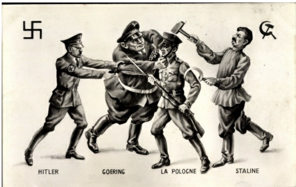
А. Гітлер, Г. Герінг та Й. Сталін знищують Польщу. Карикатура.

У масовій свідомості Друга світова залишається передусім ідеологічним конфліктом, який розв'язали німецький і радянський тоталітарні режими. Але якщо поглянути на проблему ширше, то виявиться, що це була боротьба різних типів імперій за своє існування. Звичайно, таке узагальнення певною мірою спрощує підхід до вивчення тогочасних подій, але саме в той період європейці шукали нових форм управління своїми колоніями, де формувався і набирив сили середній клас, який здобув західну освіту і прагнув звільнитися з-під влади іноземців. Саме тоді світ імперій почав трансформуватися у світ націй, набули поширення й розвитку глобалізм і світовий порядок, який би визначали кілька держав.