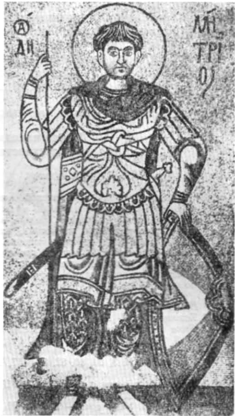
Рис. 4. Зображення Дмитра Солунського з Михайлівського Золотоверхого собору в Києві (часи Ізяслава Ярославича).

Таким чином, немає нічого фантастичного у припущенні, що й Миколаївський (Микільсько-Пустинний) монастир був заснований за врядування Ізяслава Ярославича десь скоро за Печерським і теж дістав від нього певне земельне пожалування — угіддя у Дніпрівій заплаві на лівому березі ріки. Не підлягає сумніву, що Ізяславові бенефіції монастирям мали належне юридичне оформлення у вигляді офіційно стверджених (і завірених) грамот.