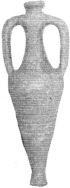
Рис. 1. Амфора з с. Гурбинці, \frac{1}{6} н. в.

Всі перелічені амфори вражають сталістю форм і розрізняються між собою лише незначними відміннями в кольорі й розмірі. Вони мають вузьке високе горло і витягнуту нижню частину, що конічно звужується донизу і закінчується ніжкою у вигляді порожньої трубочки. Горло має потовщений край. Ручки півкругло зігнуті, досить віддалені від корпусу, в розрізі овальні, мають зовні поздовжній рельєфний валик. Нижня половина амфор вкрита горизонтальними жолобками. Ніжка трохи розширюється донизу і має всередині округлий виступ (рис. 1). Висота амфор становить 43—51 см, найчастіше 50—51 см, діаметр бочка звичайно не перевищує \frac{1}{3} висоти посудини. Амфори мають здебільшого сіруватожовтий колір, іноді червоцуватий. Глина, з якої вони виготовлені, містить багато піску, нерідко крупнозернистого. Деякі амфори мають на горлі багаторядкові грецькі написи червоною фарбою (наприклад, амфора із Єрківців).