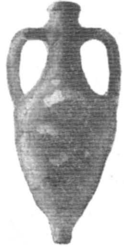
Рис. 2. Амфора з с. Бесідивка, \frac{1}{5} н. в.

Амфори з вузькою конічною нижньою половиною відомі в Херсонесі, звідки походить одна ціла амфора (зберігається в Херсонському музеї) і дві нижні частини амфор, відомі по публікаціях 8 . Такого типу амфори були знайдені в Інкерманському та Чорноречинському могильниках, розташованих поблизу Херсонеса. В Чорноречинському могильнику в 1950 р. було знайдено 2 амфори. Особливо багато подібних амфор походить з Інкермана — 12 екземплярів; із них 4 амфори, що складають ще довоєнні знахідки 1940—1941 рр., зберігаються нині у Київському державному історичному музеї (одна з них була опублікована) 9 , 8 амфор були виявлені розкопками 1948 р. 10 , 3 амфори цього типу походять з Керчі 11 . Крім того, відома одна безпаспортна амфора в Сімферопольському музеї і одна така ж в Керченському музеї (походить з околиць Керчі?).