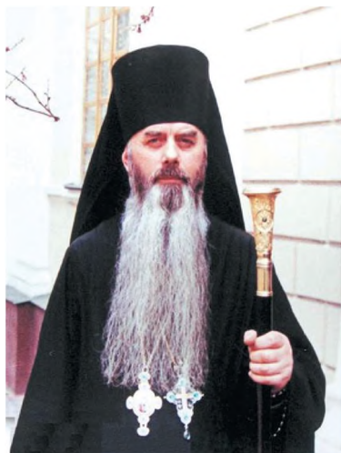
Преосвященнейший Кронид (Мищенко), епископ Днепропетровский и Криворожский (19 сентября 1992 - 7 сентября 1993)

факторы дали возможность верующим возобновлять старые и создавать новые храмы. Яркой иллюстрацией сказанного может послужить постановление Совета Министров УССР, принятое в июне 1988 года, о передаче территории Дальних пещер Киево-Печерского историко-культурного заповедника Православной Церкви под монастырь. Со временем и местная власть стала идти навстречу церковным общинам, возвращая храмовые сооружения. С провозглашением государственного суверенитета (16 июля 1990 года) и независимости Украины (24 августа 1991 года) вышеперечисленные процессы в духовно-религиозной жизни страны лишь углубились.