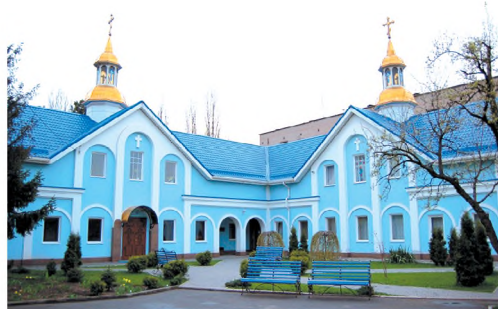
Здание Духовно-просветительского центра