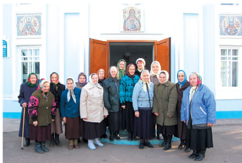
Сестры храма. 2010 г.

Порой, люди долго ищут, где бы можно было применить себя с пользой для окружающих. К счастью, у прихожан храма Рождества Пресвятой Богородицы есть спасительная возможность посильно потрудиться на благо ближних в любом заинтересовавшем их направлении.