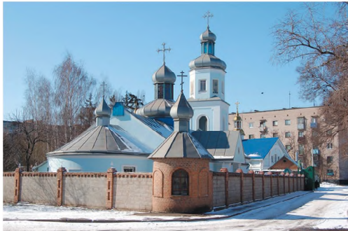
Храм Рождества Пресвятой Богородицы в 2000 - 2010 гг.