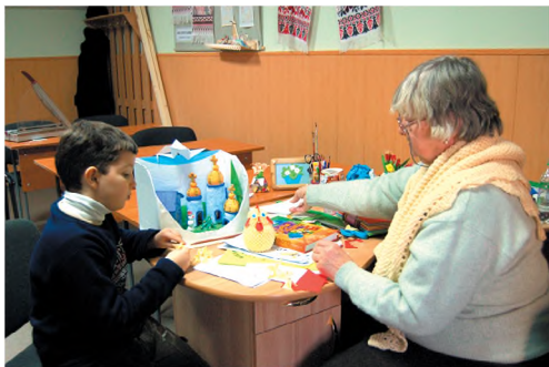
Занятие в клубе «Надежда». 2011 г.

Сегодня каждую субботу в клубе «Надежда», вместе со взрослыми, занимаются дети 7-10 лет. Их работы выставляются на подворье храма во время приходских праздников и торжеств, а также на ежегодных Рождественских епархиальных утренниках «Світло Різдва» 130 . Стараниями взрослых членов клуба были вышиты две