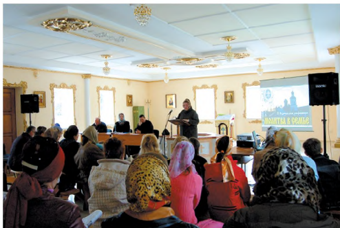
Родительская конференция. 2007 г.