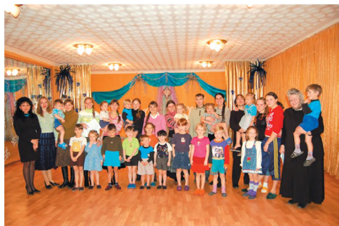
Посещение детского дома. 2006 г.

трех блюд. Ежедневно, по согласованию с Центрально-Городским исполкомом, в трапезной храма горячими обедами кормят 30 детей из малоимущих семей, которых приводят из общеобразовательной