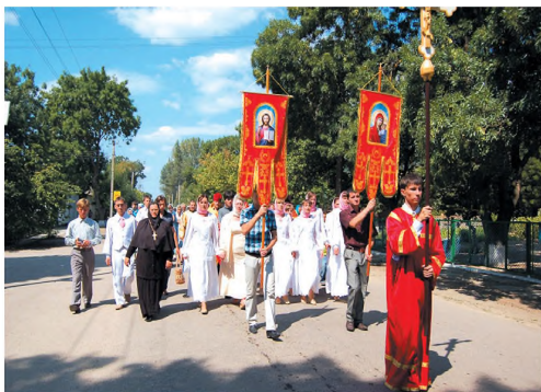
Крестный ход по поселку. 2011 г.

После окончания оздоровительного сезона были подведены итоги первого опыта совместного отдыха учащихся Воскресной школы, учтены сильные и слабые стороны в организации бытовых условий, результатом чего стало приобретение в следующем 2004 году нового дома, более вместительного и приспособленного. С тех пор, благодаря усилиям настоятеля, прихожан храма и самих детей, территория дачи с каждым годом все более облагораживается. Уютный дворик, удобные комнаты и санитарно-гигиенические помещения — все по-хозяйски продумано и обустроено. Как вспоминают сами ребята и их родители, в течение отдыха дети купаются в море, загорают, устраивают походы к источникам, на косу и Птичий остров, экскурсии по достопримечательностям поселка, играют в подвижные игры, проводят футбольные матчи с местными ребятами. В свободное от активного отдыха время разучивают духовные песнопения и стихи, проводят литературные вечера, посвященные творчеству выдающихся писателей и поэтов, истории поселка Хорлы, ставят небольшие театральные постановки. Пребывание в