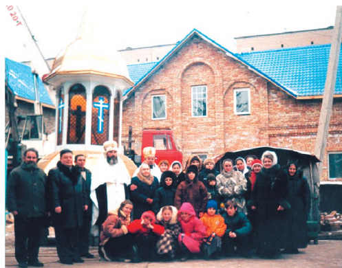
После освящения куполов с крестами на здании Духовно-просветительского центра. 28 декабря 2002 г.

Все более возрастающее количество учащихся Воскресной школы вследствие активной учебно-воспитательной работы, а также при-