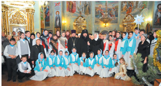
Хоровые коллективы храма в кафедральном соборе на Рождество 2012 года

Не будет преувеличением утверждение, что певчие хора являются представителями храма Рождества Пресвятой Богородицы на разных уровнях — городском, епархиальном, всеукраинском и даже международном, участвуя во всевозможных концертах, фестивалях, выставках и прочих общественных мероприятиях. Первым выступлением на высоком уровне стало участие во Второй международной выставке «Славте Різдво», проходившей с 26 по 30 декабря 2003