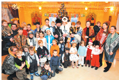
Рождественский утренник для малышей. 2011 г.

Вместе с занятиями в церковной ограде, преподаватели стараются приобщить детей к миру церковно-христианского и светского искусства, показать влияние библейских сюжетов и духовных мотивов на творчество многих мастеров музыки, живописи, архитектуры.