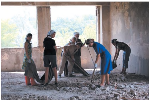
На послушании в Покровском монастыре г. Днепродзержинск. 2009 г.

ние Дня православной молодежи 15 февраля 2005 года, когда в Духовно-просветительском центре храма Рождества Пресвятой Богородицы собрались представители молодежных объединений епархии. После этого в воскресенье 27 февраля состоялось собрание молодых прихожан нашего храма в составе 28