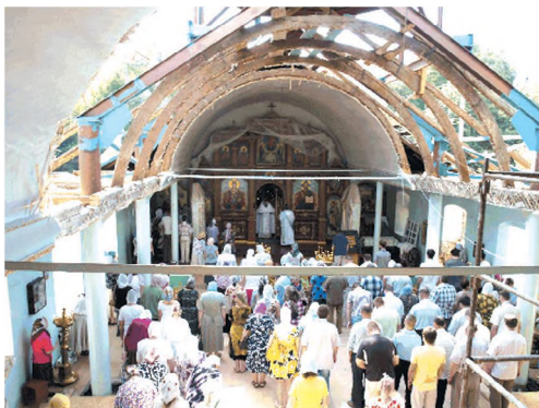
Богослужение под открытым небом. 2010 г.

Вслед за этим было решено осуществить новую реконструкцию здания храма, который мог бы органично вписаться в ансамбль приходских сооружений и достойно выглядеть на их фоне. Согласно разработанному проекту, храм приобрел крестово-купольную форму, был поднят его центральный купол, расширены пономарка и ризница. Вместе с тем, был установлен и новый иконостас, заказанный в городе Самборе Львовской области и выполненный мастером