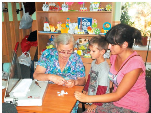
Занятие в клубе «Надежда». 2011 г.