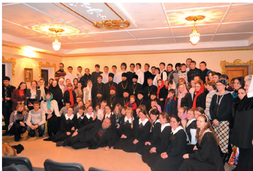
Участники Сретенских встреч. 2010 г.

Так проходят праздники и будни в молодежном братстве имени святителя Петра Могилы. Но кроме больших трудоемких про-