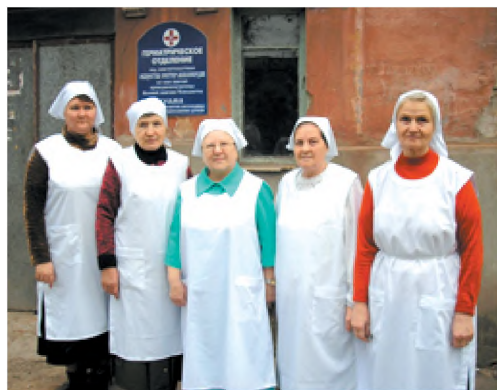
Сестры милосердия. 2011 г.

по улице Пушкина 137 . Со временем, администрация больницы отдала сестрам милосердия целое крыло терапевтического отделения, которое находились в весьма плачевном состоянии. На пожертвования благодетеля Александра Ильича Лившица в нем были капитально отремонтированы все помещения: оборудованы 10 больничных палат и устроена часовня во имя святого великомученика Пантелеимона