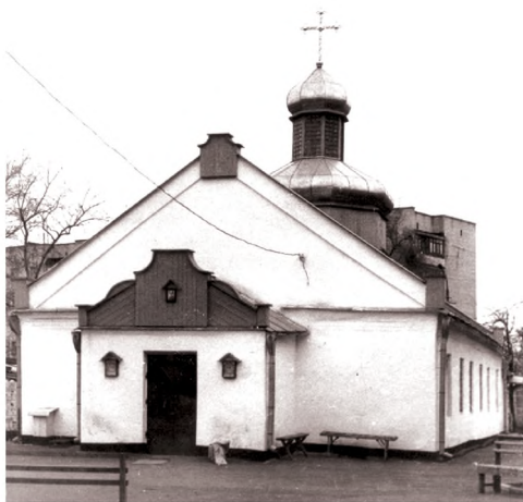
Храм Рождества Пресвятой Богородицы. 1995 г.