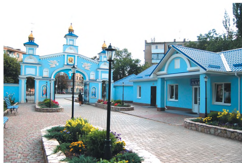
Центральные врата и двор храма Рождества Пресвятой Богородицы.