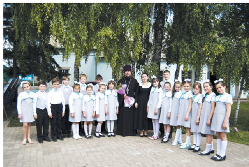
Подготовительная группа Детского хора. 2008 г.

Определяющим для детского хора стало осознание себя христославами, для которых главное — прославить своим пением Бога, а