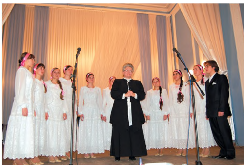
Молодежный хор на сцене музучилища. 2007 г.