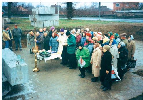
Молебен на фундаменте Покровского храма