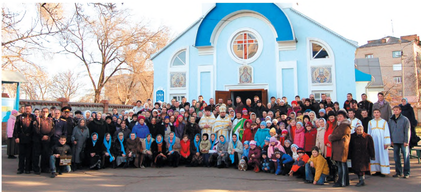
Прихожане храма Рождества Пресвятой Богородицы. 2009 г.