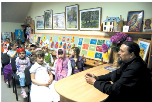
На уроке в Воскресной школе. 2004 г.

на занятиях используются различные виды учебной деятельности. В частности, на уроке ребята с преподавателем могут выучить молитву, при чем идет не только заучивание каждого стиха, но и объяснение его смысла с использованием изречений святых отцов и опытных духовни-