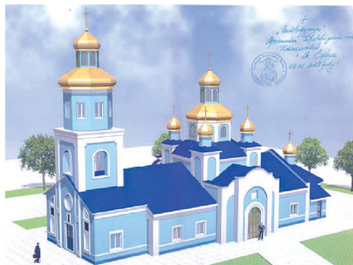
Проект реконструкции храма, осуществленный в 2010 - 2011 гг.