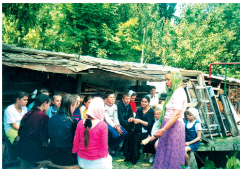
Урок Закона Божия. 2002 г.