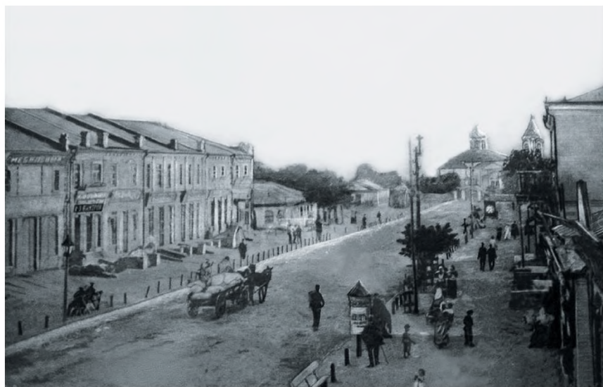
Улица Почтовая с видом на Никольский храм. Начало XX века