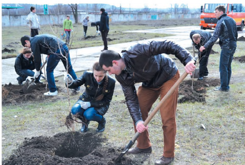
Акция «Рідному місту...». 2012 г.