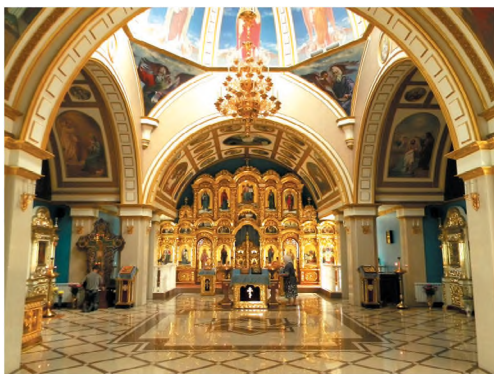
Интерьер храма Рождества Пресвятой Богородицы. 2011 г.