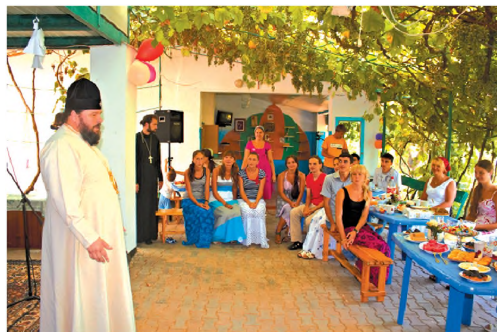
Визит владыки Ефрема в Хорлы. 2011 г.