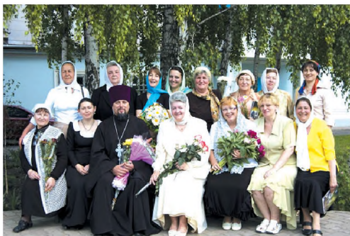
Преподаватели Воскресной школы. 2008 г.