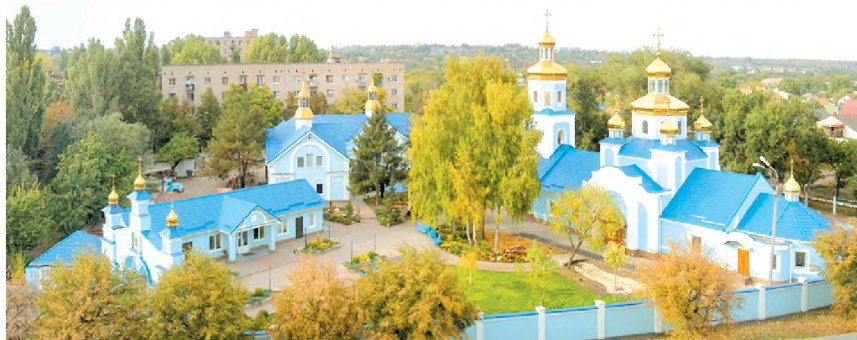
Панорама храма Рождества Пресвятой Богородицы. 2011 г.

Постоянно сознавая себя служителями Царицы Небесной, настоятель, клирики и прихожане храма Рождества Пресвятой Богородицы только в Ней и Ее Божественном Сыне полагают свое упование, и скорое заступничество Пречистой Девы не оскудевает на Ее верных чадах, которые в хвалебном благодарении преисполненного сердца с уверенностью в голосе радостно восклицают, разрешая все недоумения: «Се бо Матерь наша с нами есть»!