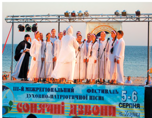
На міжрегіональному фестивалі. 2008 г.

В каждый летний сезон для отдыха на приходской даче в Хорлах организовывается 5 смен продолжительностью в 2 недели, каждая в среднем по 19 человек. Так, летом 2007 года (с 6 июня по