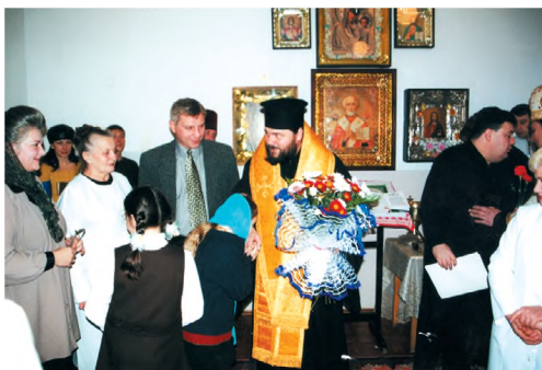
На освящении геронтического отделения. 24 ноября 2001 г.