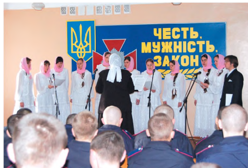
Выступление в воинской части. 2006 г.

Нынешнее молодежное братство во многом пользуется нормами, установленными в 1992 году. Его главной целью является духовно-просветительская деятельность среди современного общества, поэтому духовным покровителем не случайно избран святитель Петр Могила, митрополит Киевский и Галицкий, который трудился для