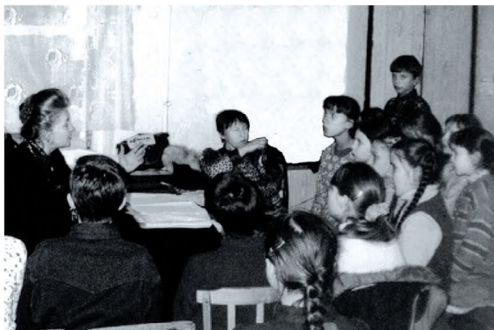
Спевка детского хора. 2000 г.