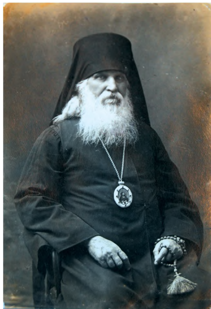
Священномученик Порфирий (Гулевич), епископ Криворожский, викарий Днепропетровской епархии (8 июля 1928 - 18 сентября 1930) (Из собрания Киевской митрополии. Публи- куется впервые)

человеческую бдительность и не дает увидеть реальность происходящего вокруг; что попы — это туеядцы и дармоеды, которые живут за счет своих менее расторопных и понятливых сограждан; что свободного советского человека ничто не должно сковывать: ни моральные или общественные установления (семья, брак), ни церковные (воздержание, посты). Нужно жить в свое удовольствие,