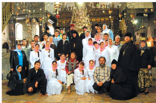
В Вифлееме. 2006 г.