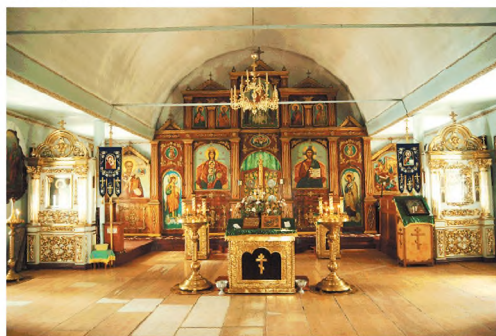
Интерьер храма Рождества Пресвятой Богородицы в 1995 - 2010 гг.