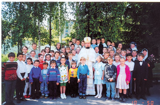
Учащиеся Воскресной школы на выпускном 1999 года