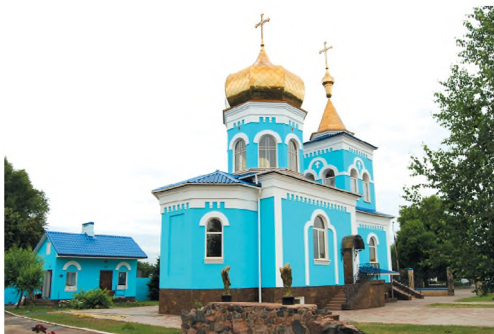
Свято-Покровская церковь на Карнаватке