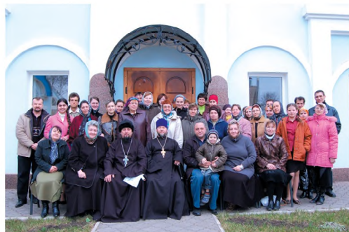
Участники родительской конференции. 2007 г.

Совместными усилиями всеукраинского объединения «Жіноча громада», Совета многодетных семей и «Путь православных» 18 – 19 декабря 2001 года в молодежном центре «Гольфстрим» была проведена I Всеукраинская конференция «Детский дом семейного