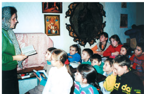
Занятие в школе. 2000 г.

в Никополе, Желтых Водах, Павлограде, Днепропетровске, Киеве, всегда интересовались обучением детей в ходе многочисленных паломнических поездок, но никого не копируя, старались найти свой путь развития Воскресной школы 82 . А в ней со середины 90-х годов Закон Божий