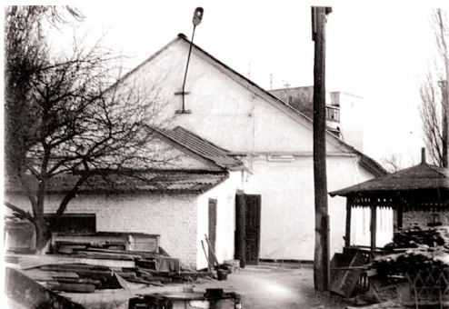
Здание храма после передачи общине. 1991

вера в Бога ушла в небытие вместе со старшим поколением, лишенная перспектив на будущее. Восстановление святыни Возрождение и подъем церковной жизни в Советском Союзе неразрывно связан с празднованием 1000-летнего юбилея Крещения Руси в 1988 году, которое стало своеобразной точкой отсчета для многих качественно новых явлений и процессов в жизни Русской Православной Церкви и Украинского Экзархата, как ее составляющей. В свою очередь, празднование этого эпохального события стало возможным благодаря тем изменениям в советском обществе, которые начались в 1985 году с приходом к власти Михаила Сергеевича Горбачева и были обусловлены его курсом на перестройку, политикой гласности. Неотвратимое и безвозвратное падение коммунистической идеологии благоприятствовало тому, что народ в поиске новых ценностных ориентиров стал оглядываться назад, всматриваться в свое прошлое, возвращаться к вере своих отцов. Несмотря на годы богоборческой власти, массовые репрессии и антирелигиозные кампании, целью которых было искоренить само упоминание о Боге, дискредитировать священников и навязать атеистическое мировоззрение всем жителям огромной страны, в народе сохранялась вера в Бога, память о погранных святынях, необъяснимая тяга к ним. На этом фоне начала складываться и совершенно новая модель церковно-государственных отношений. Все эти