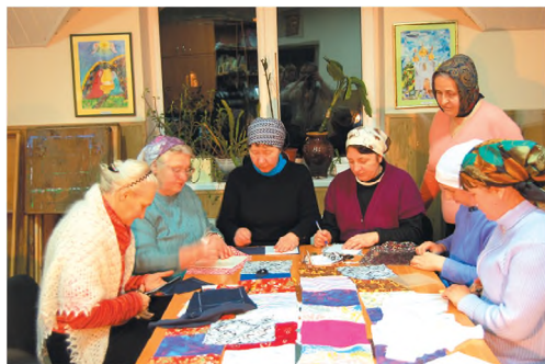
На собрании сестринства. 2007 г.

В сентябре 2006 года по благословению настоятеля было создано сестринство, в котором прихожане храма общаются в тесном кругу, обмениваются духовным опытом, слушают лекции, смотрят