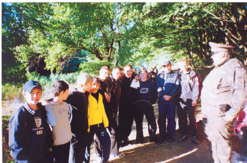
Казачата школы «Джур» в Крыму. 2007 г.