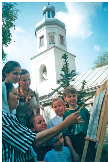
Урок рисования. 2003 г.