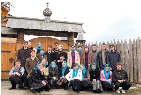
В Святогорской Лавре. 2008 г.

Отдельным пунктом деятельности прихода является общественная работа среди жителей Кривого Рога. 15 июля 2000 года в Киеве, по благословению Блаженнейшего Владимира, митрополита Киевского и всея Украины, состоялся учредительный съезд Всеукраинского общественного объединения в поддержку канонического православия «Путь право-