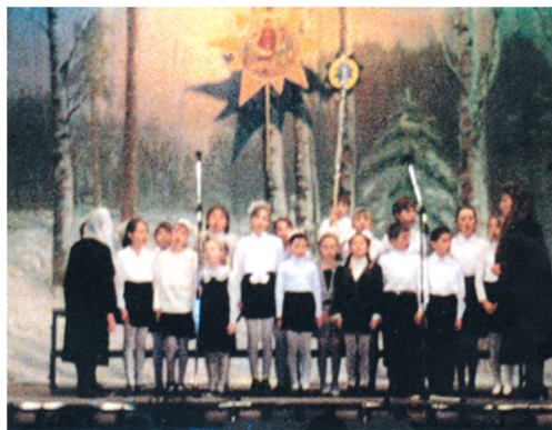
Выступление воспитанников Воскресной школы в Никополе на Рождество Христово. 2000 г.

тиями, в том числе и для нашего прихода и Воскресной школы. Поездка в Никополь во время рождественских святок и посещение Спасо-Преображенского собора стало первым паломничеством учащихся Воскресной школы, первым выступлением с большой сцены, первым прикосновением к местночтимым святыням 89 . В дни Светлой седмицы того же года детский хор выступил на концерте в Никополе по случаю 10-летия со дня восстановления Преображенского собора, и с тех пор дружественные поездки во второй кафедральный город нашей епархии стали традиционными 90 . Регулярными стали и паломничества по храмам и монастырям города и епархии, а также посещения великих православных святынь Украины в Густыне, Киеве, Золотоноше, Днепропетровске, Почаеве, Искровке, которые охватывают все большее и большее число