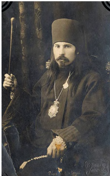
Священномученик Онуфрий (Гагалюк), епископ Елисаветградский, викарий Херсонской епархии (пребывал в Кривом Роге с 23 мая по 16 октября 1923 года)

осуществления второй задачи была организована массовая кампания по конфискации церковного имущества — якобы в помощь голодающим Поволжья. Так, вместе с другими церквями Криворожья, наш храм стал объектом грабежа весной 1922 года 39 . В сентябре следующего года, согласно статье 6 «Положения о государственном приходно-имущественном налоге», священнослужители попали в разряд лиц «свободных профессий» и стали облагаться повышенными налогами 40 . В такой ситуации настоящим утешением для верующих было пребывание в Кривом Роге с 23 мая по 16 октября 1923 года святого священномученика Онуфрия (Гагалюка), епископа Елисаветградского, викария Херсонской епархии. Здесь, после одесского заключения, владыка активно боролся с обновленцами и самосвятами, трудился над созданием отдельного Криворожского викариатства 41 и наверняка служил в нашем храме.