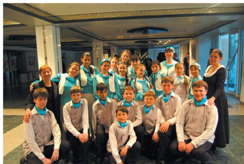
Детский хор в Никополе. 2011 г.