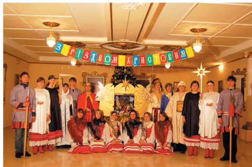
Участники рождественского вертепа. 2009 г.

Однако, кроме концертной деятельности, братство работает и в других направлениях. Его силами издается приходская газета «Свеча», в которой освещается будни и праздники прихода, помещаются актуальные материалы относительно духовной жизни православных христиан, написанные доступным и живым языком. Нередко статьи и заметки в газету пишут сами ребята. В ходе работы над очередным выпуском они постигают основы работы с компьютером, изучают дизайнерские программы, обучаются издательскому делу. Вместе с этим в молодежном братстве ведется работа по изучению истории храмов Криворожья, разрабатываются и проводятся экскурсии по