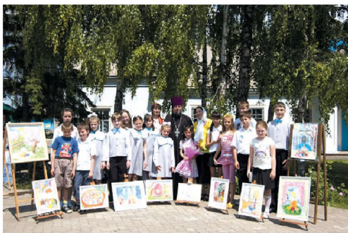
Учащиеся ИЗО-студии. 2008 г.

Студия изобразительного искусства в Воскресной школе отличается от подобных светских классов и школ тем, что основой учебной программы является обычный курс по изучению изобразительного искусства, однако тематика всех рисунков — право-