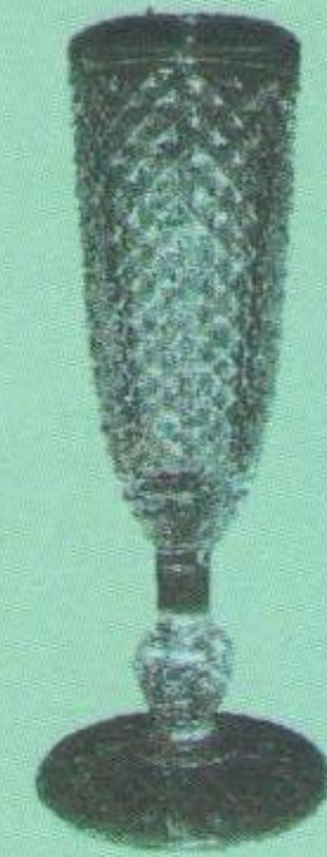
Кришталевий Кубок Західної України (здобутий у 1927, 1928 роках).