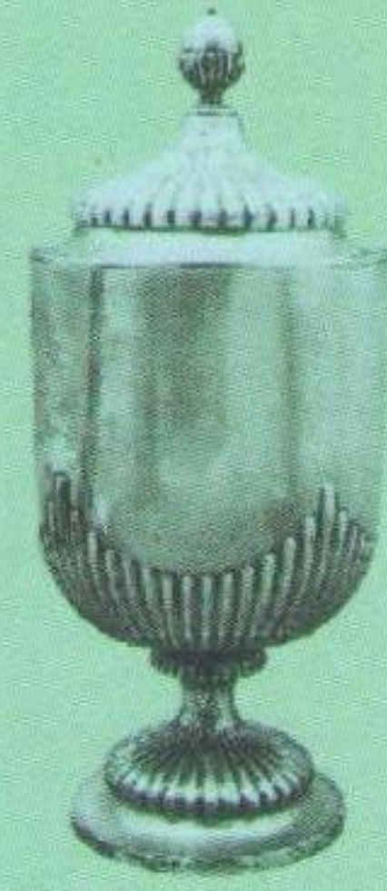
Срібний Кубок чемпіона Підкарпатської Русі та Східної Словаччини (здобутий у 1934/35, 1935/36 роках).