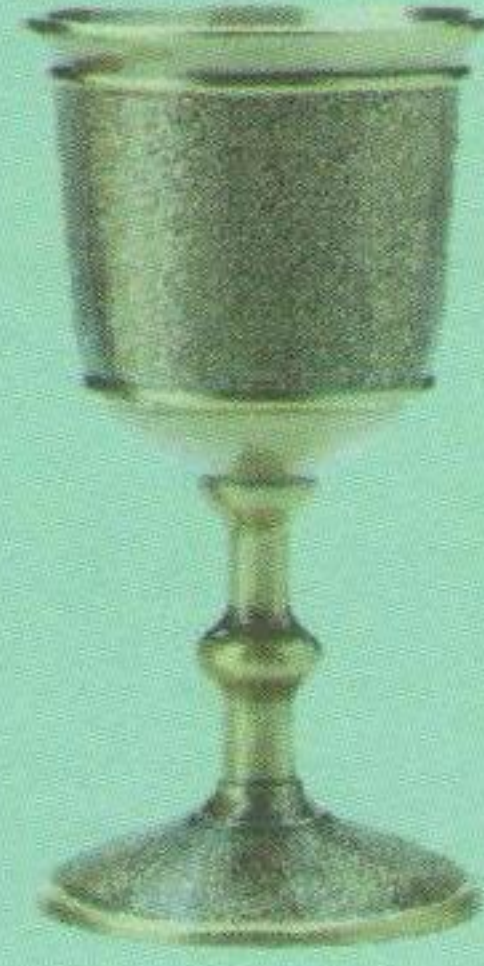
Бронзовий Кубок Чернівців (здобутий у 1923/24, 1929/30 роках).