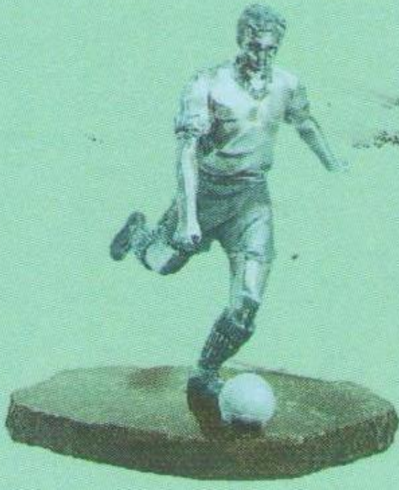
Срібний приз чемпіона Буковини, Молдови та Бессарабії (здобутий у 1936 році).