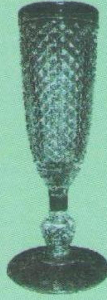
Кришталевий Кубок Західної України (здобутий у 1925, 1926 роках).