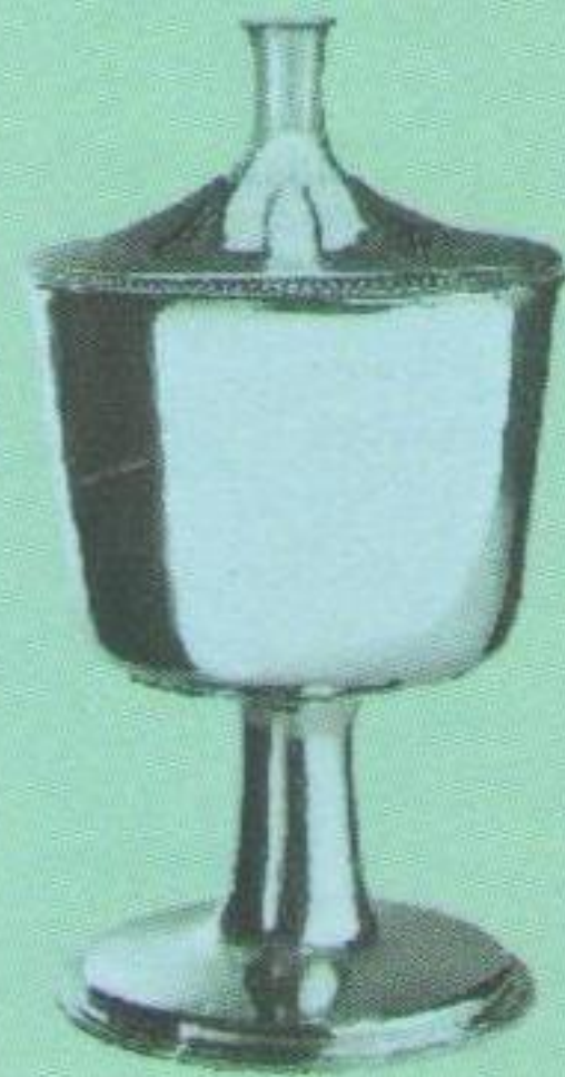
Срібний Кубок чемпіона Підкарпатського краю (здобутий у 1939, 1940 роках).