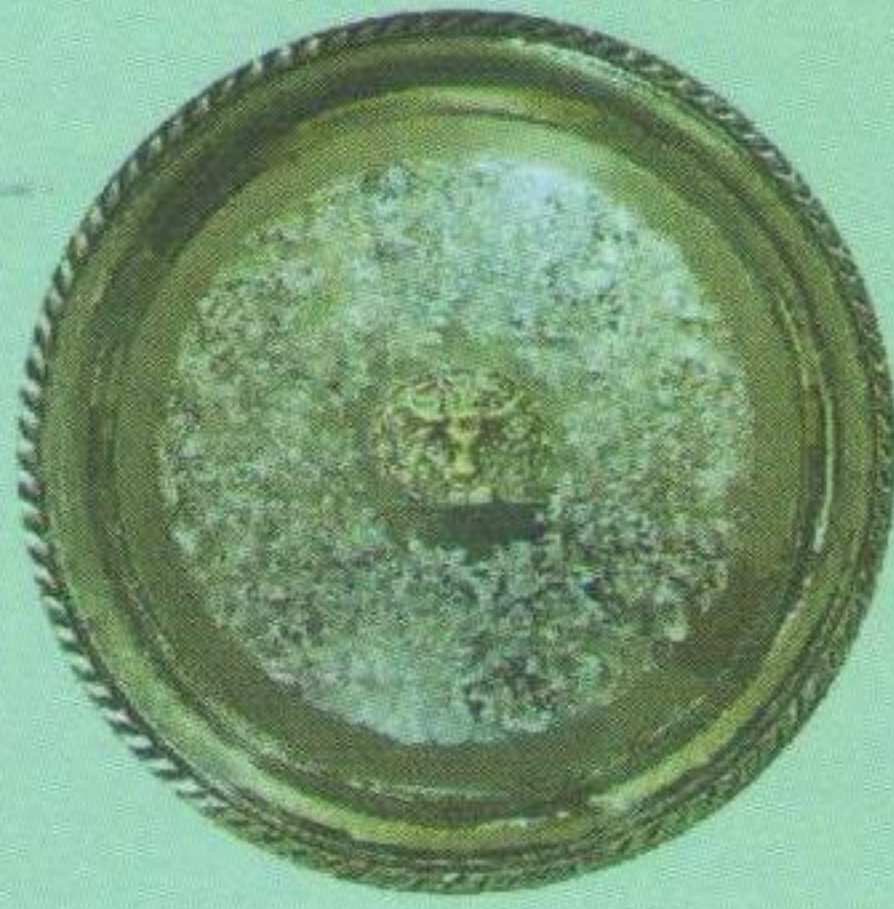
Золота салатниця чемпіона Буковини (здобута у 1935/36 році).