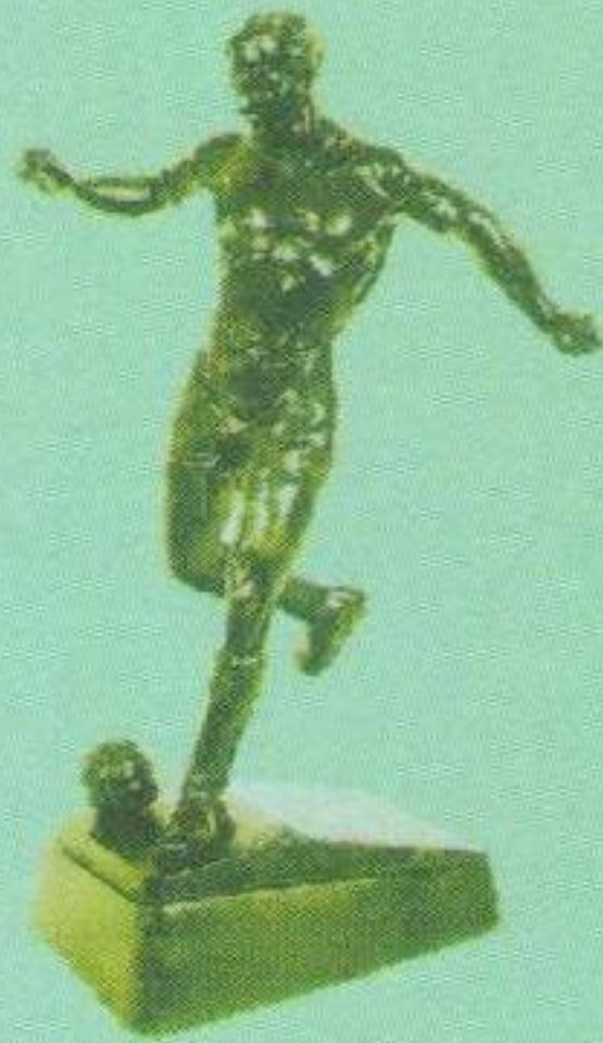
Золотий приз чемпіона Словаччини серед слов'янських команд (здобутий у 1932/33, 1933/34 роках).