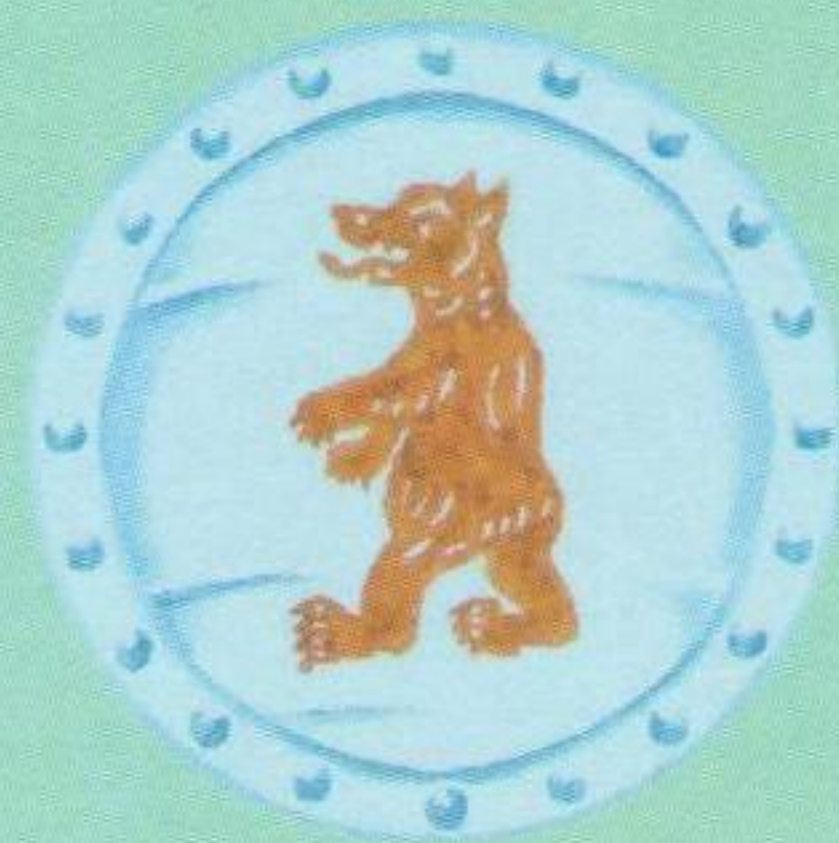
Кришталева салатниця чемпіона Підкарпатської Русі серед слов'янських команд (здобута у 1928/29, 1929/30, 1930/31, 1931/32, 1932/33, 1933/34 роках): художня репродукція.