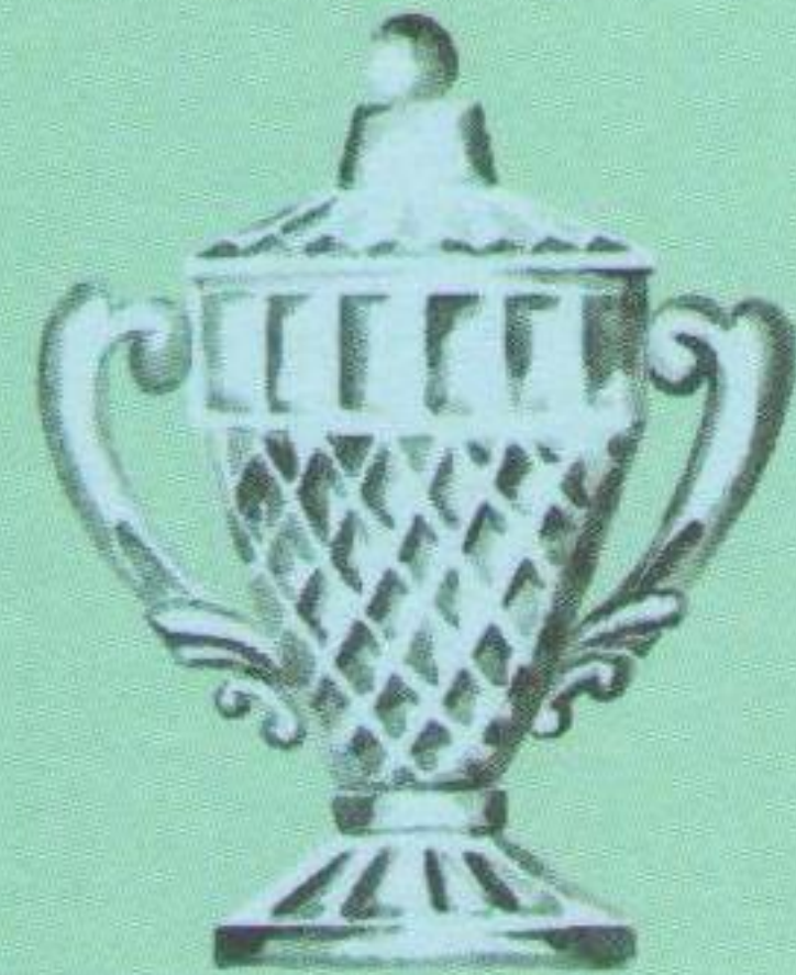
Кришталевий Кубок Підкарпатської Русі + Підкарпатського краю (здобутий у 1926, 1927, 1938, 1939 роках): художня репродукція.