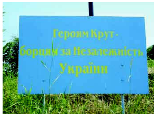
Пам'ятник Героям Крут.