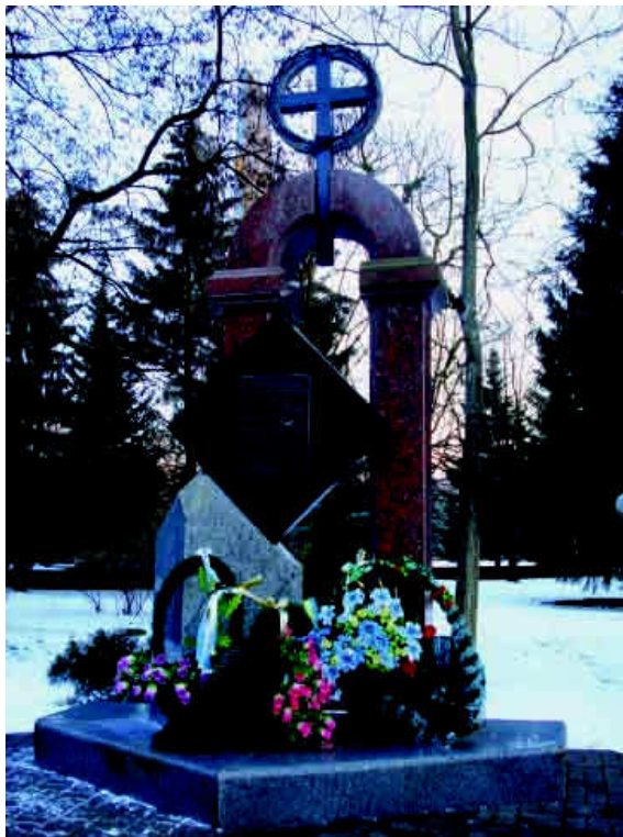
Пам'ятник українцям Холмщини, Підляшшя, Надсяння, Лемківщини, Бойківщини.

Напроти встановлено пам'ятник, відкритий 24 березня 2002 р. Ним вшановано трагічну долю українців Холмщини, Підляшшя, Надсяння, Лемківщини, Бойківщини 12 .