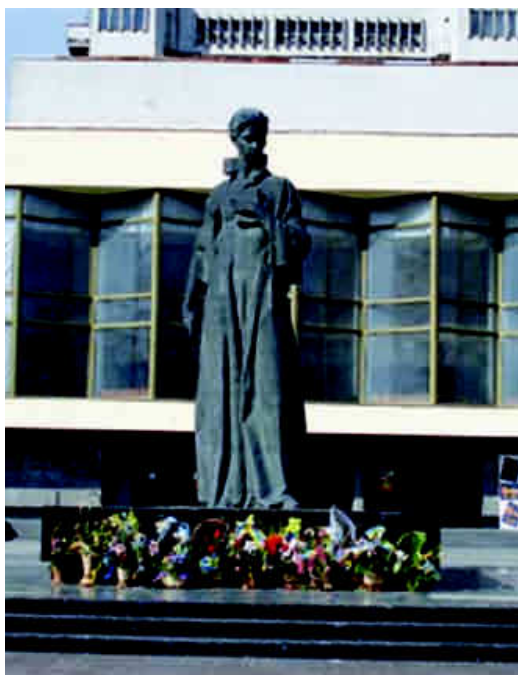
Пам'ятник Лесі Українці (скульптор Лев Муравін).

ім'я Лесі Українки. Один розташований у парку культури і відпочинку з 1966 р. (скульптор Лев Муравін, архітектор Ростислав Метельницький) 7 , другий – на Театральній площі