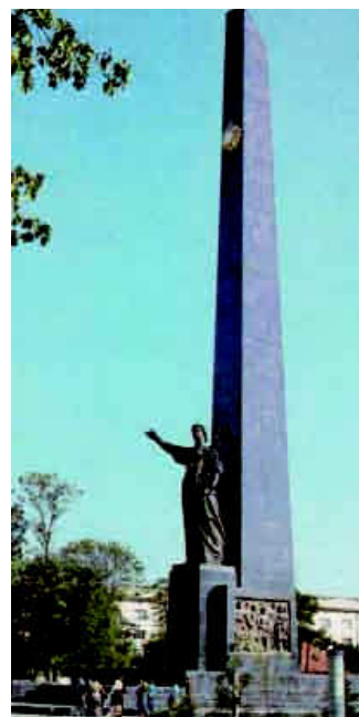
Меморіал вічної слави.

Найбільшим пам'ятко-архітектурним комплексом Луцька (7500 кв. м.) є Меморіал вічної слави, відкритий 29 жовтня 1977 р. 10 . Він поступово наповнюється новими пам'ятками історії краю. Авторами Меморіалу є народний художник УРСР, скульптор М. Вронський, архітектор В. Грезділов, спів-авторами – Г. Бородін та Г. Годлевський. У центрі комплексу – сорокаметровий обеліск із чорного граніту, який увінчує двометровий, покритий золотом орден Перемоги. Біля підніжжя обеліска – дев'ятиметрова бронзова скульптура жінки з лавровою гілкою у лівій руці. Перед нею горить вічний вогонь. На бічних гранях обеліска – вилиті з бронзи два горельєфи: визволителів Луцька і народних месників.