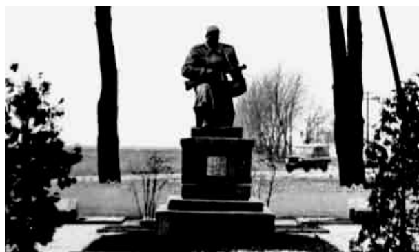
Братська могила жертв фашизму 1941–1942 рр..

на пагорбі – символічний гранітний камінь із написом «Жертвам фашизму від громадян міста Луцька» 4 . Поруч нещодавно насипано дві символічні могили і встановлено дерев'яні хрести з написами. На одному – «Братська могила жертв другої світової війни (Кількість похованих не встановлено)», на іншому – «Братська могила жертв фашизму 1941–1942 рр. Тут перепоховано останки 370 військовослужбовців»