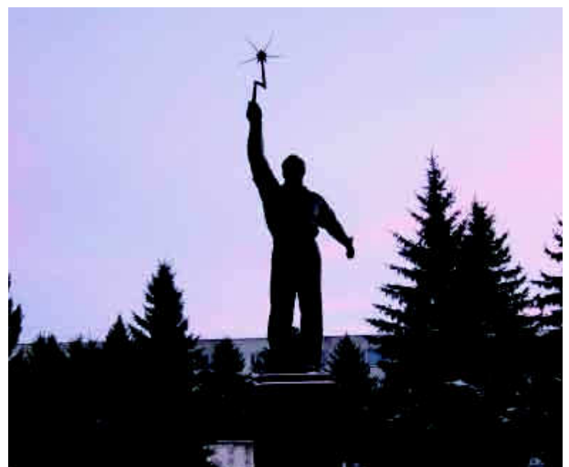
Монумент символу праці – робітникові.