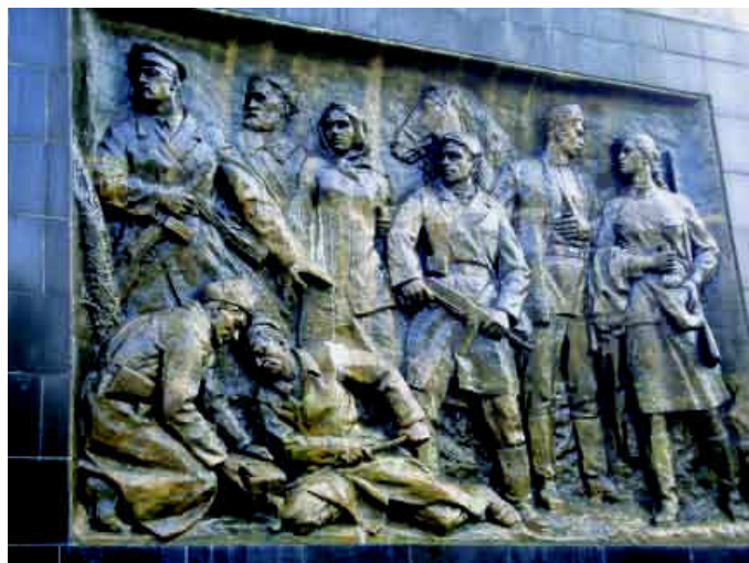
Меморіал вічної слави (скульптор М. Вронський, архітектор В. Грезділов, співавтори – Г. Бородін та Г. Годлевський).

Напроти Меморіалу зі сторони вулиці Шопена також є алея з іменами Героїв Радянського Союзу. Площу навколо обеліска