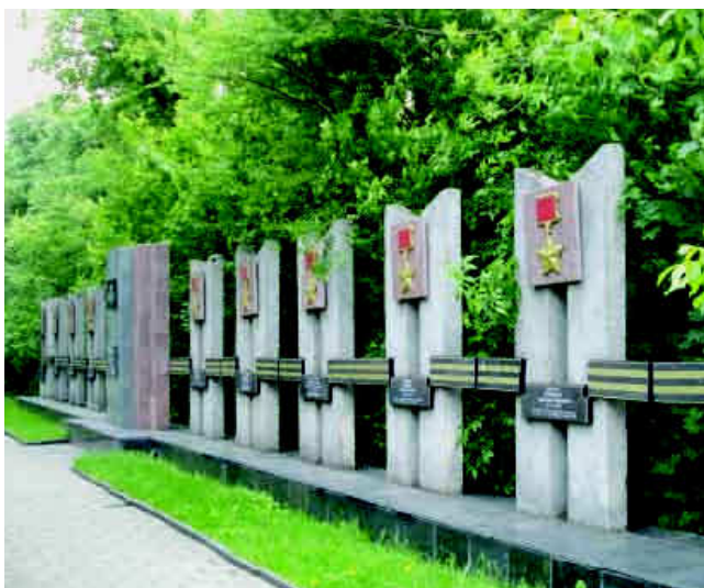
Алея Героїв Радянського Союзу.

Напроти Меморіалу зі сторони вулиці Шопена також є алея з іменами Героїв Радянського Союзу. Площу навколо обеліска