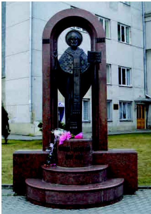
Пам'ятник Святому Миколаю (Скульптор – Ярослав Скакун, архітектор – Андрош Бідзіля).

23 квітня 2000 р. біля Луцької міської ради відкрито пам'ятник покровителю міста Святому Миколаю (вул. Б. Хмельницького). Скульптор – Ярослав Скакун, архітектор – Андрош Бідзіля 16 . 2000 р. на колишній площі Ринок у Старому місті біля Покровської церкви відкрито пам'ятний знак на честь двотисячоліття Різдва Христового. Скульптор – Микола Сівак 17 .