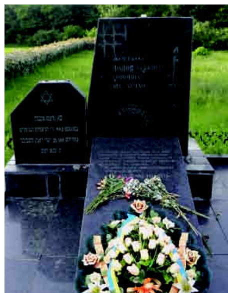
Пам'ятник жертвам фашизму від громадян міста Луцька.

У 1990 р. в районі цукрового заводу біля села Полонка створено меморіал жертвам геноциду і відкрито пам'ятник на триметровому насипному пагорбі. На плитах із лабрадориту, базальту та габро вибиті тексти українською мовою, ідиш та на івриті: «Жертвам фашистського геноциду від лучан», «На цьому місці в серпні 1942 року німецько-фашистськими загарбниками розстріляно 25658 громадян єврейської національності – жителів Луцька та околиць. Вічна Вам пам'ять». До 1990 р. на цьому місці були