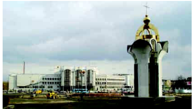
Пам'ятник борцям за волю і незалежність України.

22 серпня 2001 р. до 10-ї річниці незалежності України на Київському майдані відкрито пам'ятник «Борцям за волю і незалежність України» 18 . Згодом, 2 листопада 2001 р., на перетині проспектів Грушевського та Перемоги відкрито бронзовий пам'ятник Голові уряду УНР Михайлові Грушевському (1866–1934). Скульптор – Ярослав Скакун, архітектор – Андрош Бідзіля 19 .