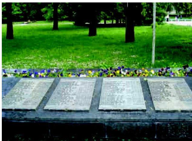
Плити з прізвищами партійних, радянських, комсомольських працівників, які загинули від рук українських націоналістів у 1944-1949 рр.

Неподалік – плити з прізвищами партійних, радянських, комсомольських працівників, які загинули від рук українських націоналістів у 1944–1949 рр.. Трохи далі – плити