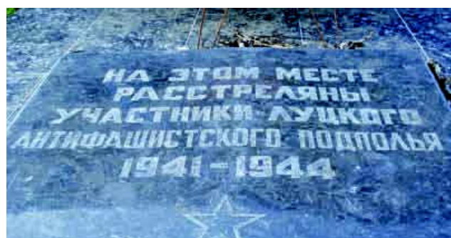
Пам'ятник жертвам Другої світової війни (вул. Драгоманова).

на пагорбі – символічний гранітний камінь із написом «Жертвам фашизму від громадян міста Луцька» 4 . Поруч нещодавно насипано дві символічні могили і встановлено дерев'яні хрести з написами. На одному – «Братська могила жертв другої світової війни (Кількість похованих не встановлено)», на іншому – «Братська могила жертв фашизму 1941–1942 рр. Тут перепоховано останки 370 військовослужбовців»