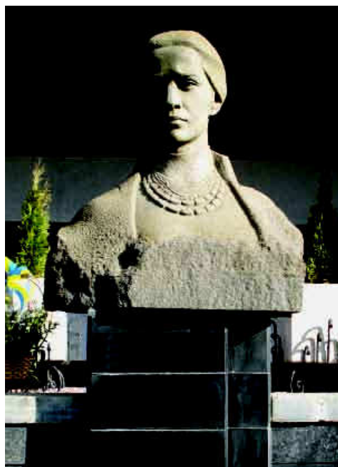
Пам'ятник Лесі Українці (скульптори Микола Обезюк, Андрій Німенко, архітектор Валентин Жигулін та Сергій Кілесо).

з 1977 р. (скульптори Микола Обезюк, Андрій Німенко, архітектор Валентин Жигулін та Сергій Кілесо) 8 ; третій (погруддя) встановлений у 1986 р., біля корпусу № 1 Волинського національного університету (скульптор Галина Кальченко) 9 .