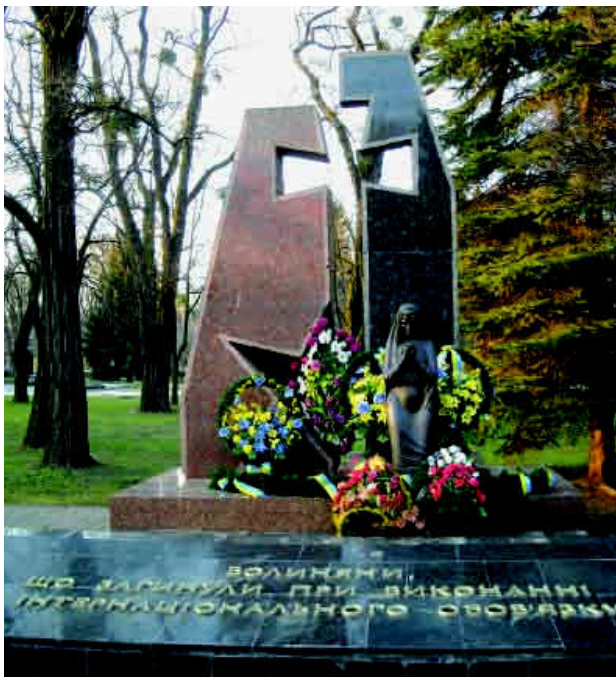
Пам'ятник загиблим воїнам-афганцям (скульптор – Олег Байдуков, архітектор – Андрюш Бідзіля)

У західній частині Меморіалу – стіна Скорботи з назвами 107 спалених окупантами сіл, відомостями про загальні втрати населення області у війні, знищення військовополонених та горельєфом «Прокляття фашизму»