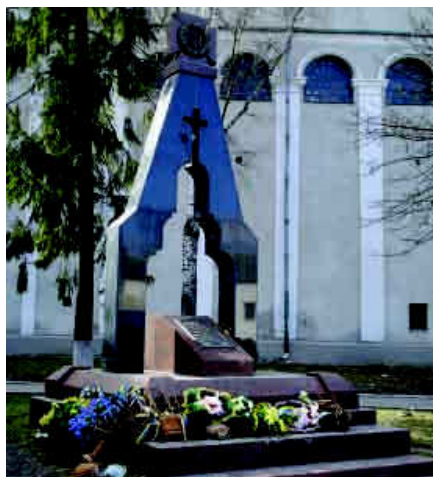
Пам'ятник загиблим (архітектор – Андрош Бідзіля)

двору монастиря знаходиться цілий ряд пам'ятних дощок із прізвищами розстріляних в'язнів та назвами населених пунктів, де вони мешкали. Під ними – плита з написом «Пам'ять людська не забуде повік Братських могил стогін і крик. 23 червня 1996». У 2004 р. біля костелу Св. Петра і Павла на вшанування загиблих споруджено пам'ятник. Архітектор – Андрош Бідзіля.