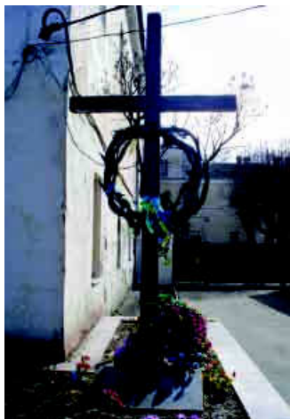
Хрест і плита у пам'ять загиблих в'язнів Луцької в'язниці.

Крім цього у Старому місті (вул. Кафедральна) є цілий комплекс пам'ятних знаків, які свідчать про один із злочинів радянської влади у перші дні Великої Вітчизняної війни – розстріл кількох тисяч в'язнів Луцької в'язниці. На одній із пам'ятних плит – застережливий напис для нащадків: «Тим, хто прийде після нас. Ми полягли за Вашу Свободу. Бережіть її! 23 червня 1941». Неподалік, власне біля стіни колишньої в'язниці (нині тут монастир), – дерев'яний хрест, під яким є напис на плиті «Розстріляним в'язням Луцької тюрми 23–24 червня 1941 року». На стіні внутрішнього