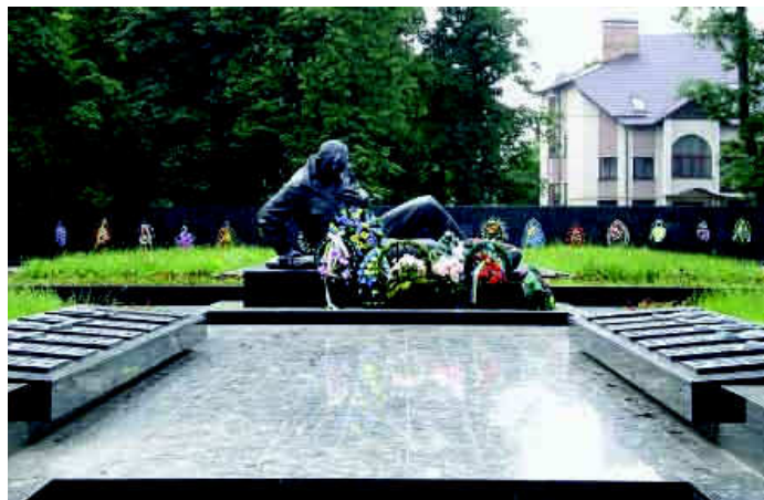
Центральна братська могила.

апсиди з чорного граніту з викладеними на ній назвами фронтів, армій, корпусів, дивізій, прикордонних загонів та застав, партизанських з'єднань і загонів, які брали участь у захисті та визволенні області. Від центрального обеліска алея веде до центральної братської могили, де на бронзових плитах вилито прізвища понад 1800 воїнів, які загинули в боях за визволення міста. На плитах – барельєфи Героїв Радянського Союзу. В центрі братської могили – скульптура смертельно пораненого воїна з автоматом у правій руці.