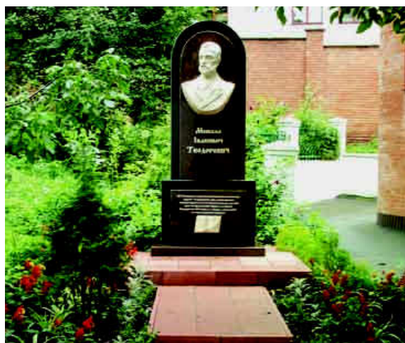
Пам'ятник М. І. Теодоровичу

У 2010 році на подвір'ї Покровської церкви встановлено пам'ятник Миколі Івановичу Теодоровичу, відомому церковному діячеві та досліднику Волині. Багато років тому дослідник волиніани М. Бойко із США у «Літописі Волині» писав: «Микола Теодорович у вільній Україні повинен бути по смерті нагороджений поясом пам'ятником за майже епохальну працю для добра Волині, яку він віддано любив, і в кількох місцях згаданої».