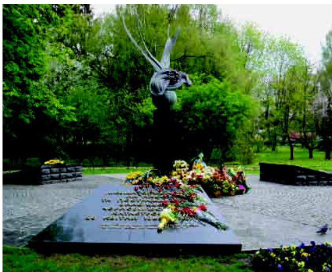
Пам'ятник ліквідаторам аварії на ЧАЕС

22 серпня 2008 р. на Меморіалі відкрито пам'ятник ліквідаторам аварії на ЧАЕС та постраждалим внаслідок Чорнобильської катастрофи 26 квітня 1986 року. Скульптор – Василь Гурмак 13 .