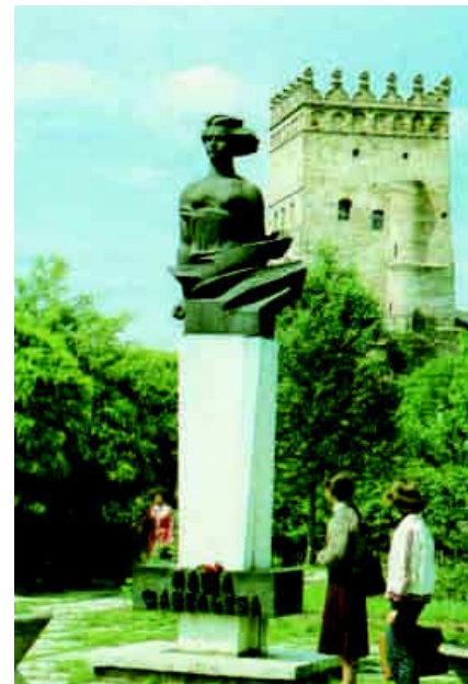
Пам'ятник Паші Савельєвій (скульптор В. Борисенко, архітектор В. Подольський).

(скульптор В. Борисенко, архітектор В. Подольський) – луцької підпільниці у роки Другої світової війни 3 , пам'ятник якій був нещодавно зруйнований, і символу праці робітників біля електроапаратного заводу.