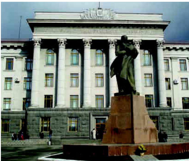
Пам'ятник Т. Шевченку (Скульптор – Едвард Кунцевич, архітектори – Олег Стукалов та Андрош Бідзіля).

23 квітня 2000 р. біля Луцької міської ради відкрито пам'ятник покровителю міста Святому Миколаю (вул. Б. Хмельницького). Скульптор – Ярослав Скакун, архітектор – Андрош Бідзіля 16 . 2000 р. на колишній площі Ринок у Старому місті біля Покровської церкви відкрито пам'ятний знак на честь двотисячоліття Різдва Христового. Скульптор – Микола Сівак 17 .