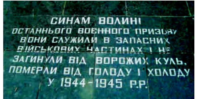
Плита в пам'ять волинян останнього воєнного призову.

У західній частині Меморіалу – стіна Скорботи з назвами 107 спалених окупантами сіл, відомостями про загальні втрати населення області у війні, знищення військовополонених та горельєфом «Прокляття фашизму»