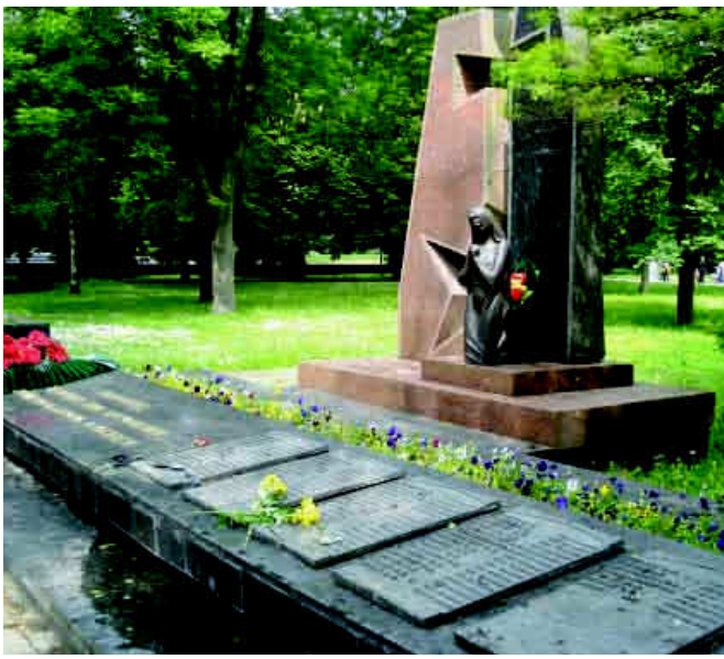
Плити з прізвищами волинян воїнів-інтернаціоналістів.

відкрито пам'ятник загиблим воїнам-афганцям. Центральними фігурами монумента є гранітна стела, проріз якої зображує хрест, а біля його підніжжя – посивіла мати, що оплакує героїв. Скульптор – Олег Байдуков, архітектор – Андрюш Бідзіля 11 . Поруч –