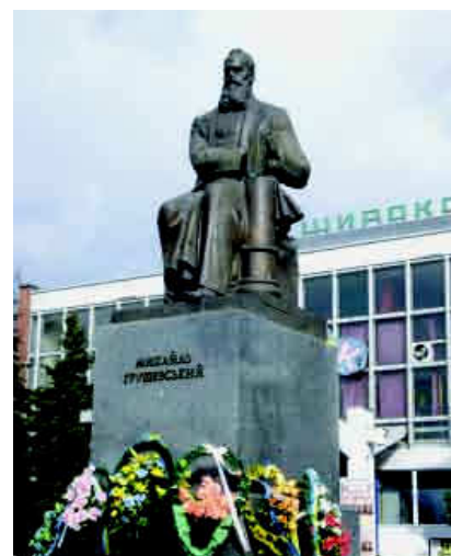
Пам'ятник М. С. Грушевському.